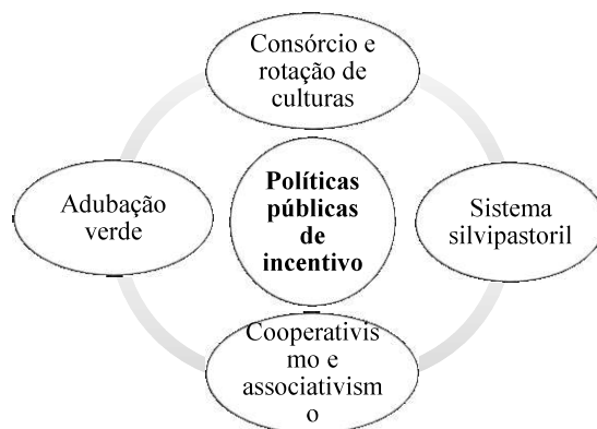
Figura 2 - Alternativas de políticas públicas de incentivo a ser implementado nos principais sistemas do assentamento Paulo Fonteles.

Nos sistemas de ciclo curto, as alternativas viáveis a realidade observada seriam o consorciamento e a rotação de culturas, o uso de cobertura morta sobre o solo e a adubação orgânica, pois essas são práticas que visam, principalmente, a conservação da fertilidade do solo para os próximos cultivos garantindo uma produção eficiente sem que haja a necessidade de abertura de novas áreas (NASCIMENTO et al., 2016; GUARÇONI et al., 2019). Nos sistemas de ciclo permanente e no sistema de criação de animais de grande porte uma boa alternativa seria a implantação de um sistema silvipastoril, utilizando-se de espécies leguminosas lenhosas como o Ingazeiro ( Inga edulis mart. ), Acácia ( Acacia mangium ) e Gliricídia ( Gliricidia sepium ) que podem atuar nesse sistema através da recuperação e da manutenção das pastagens a médio e longo prazo. De acordo com Franke e Furtado (2001), os sistemas silvipastoris diminuem os impactos ambientais negativos e favorecerem a restauração ecológica de pastagens degradadas, a diversificação da produção nas propriedades rurais, gera lucros e produtos adicionais, e ainda atua diretamente sob o bem-estar e desempenho animal.