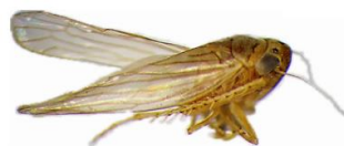
Figura 2. Plesiommata corniculata (YOUNG, 1977) em vista lateral.