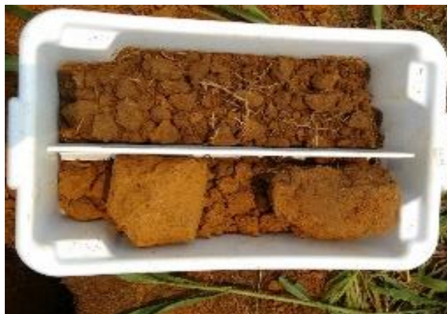
Figura 2. Evidência de compactação do solo na área 2, em função do manejo empregado.

Collares et al. (2011), ressalta que a degradação da estrutura do solo ocorrer em sistemas de produção integrados, em função da pressão do pisoteio animal e do tráfego intenso de máquinas, sendo necessário, portanto, adotar práticas de manejo adequadas para a recuperação destes solos e evitar o aumento da compactação.