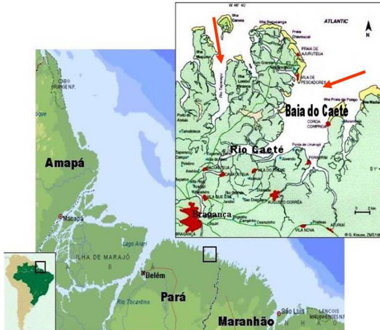
Figura 1 – Área de estudo, na região bragantina, com (a) destaque para os rios Caeté e Taperaçu (Adaptado de Peres 2011) e (b) área de abrangência da Reserva Extrativista Marinha de Caeté-Taperaçu. (Fonte: http://www.mma.gov.br ).

de conservação se deu a partir de uma oferta oficial do poder público federal. As reservas de primeira geração foram criadas no final da década de 1980, em um cenário de lutas e conflitos sociais, principalmente de natureza fundiária.