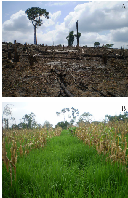
Figura 2 – A) Área queimada e plantio de arroz e B) milho em consórcio na região da Transamazônica.

A degradação dos solos somente é percebida quando o processo de erosão já está avançado, como nas voçorocas e assoreamento dos leitos dos rios. Em raras situações, são percebidos outros fatores que restringem a atividade física e biológica dos solos como a compactação, erosões laminares e perda de matéria orgânica.