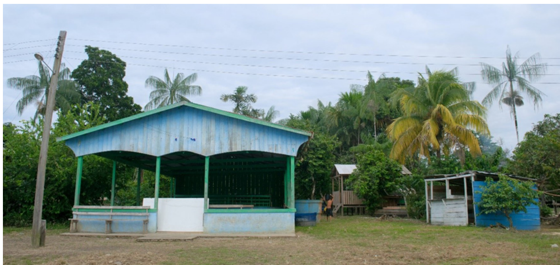
Figura 4 – Centro Comunitário da comunidade Bom Jesus do Baré (a), o refeitório (b) e as barracas de venda de bebidas e espetinhos de carne assada (c).

Após essa etapa, iniciou-se o baile. Os músicos tocaram forró, arrocha, brega, cúmbia e salsa. Como em outros festejos da região, o baile foi a etapa com maior adesão: em seu ápice, entre 23:00 e 02:00, contou com velhos e jovens, somando cerca de trezentas pessoas, conforme estimou posteriormente o presidente da comunidade. Após uma pausa de trinta minutos, com música eletrônica, os mais velhos deixaram o local. O baile, embora retomado, gradualmente perdeu participantes. Alguns se retiraram para casa ou para embarcações no porto, enquanto outros formavam pequenos grupos de conversa entre o Centro Comunitário e a barraca de bebidas. Observa-se, assim, uma diferenciação no comportamento dos participantes do baile: enquanto uns (especialmente os mais jovens) dançaram durante a