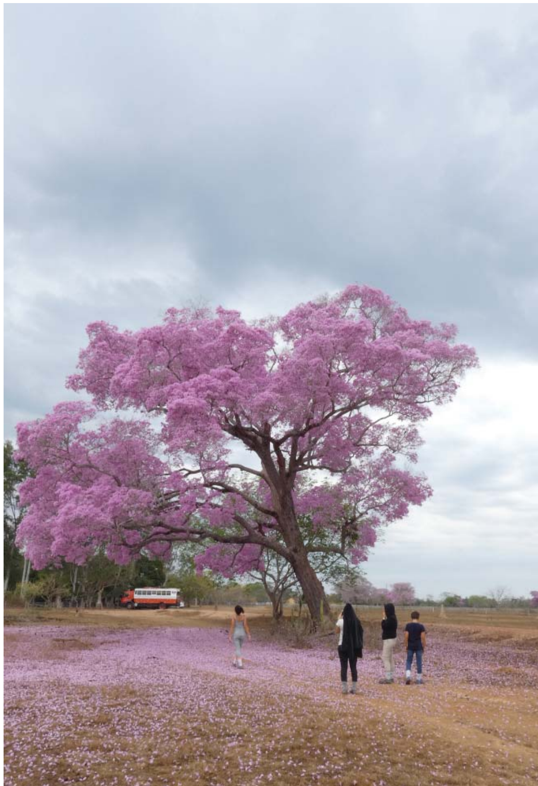
Figura 11 – Ipê florido - Árvore símbolo do Pantanal