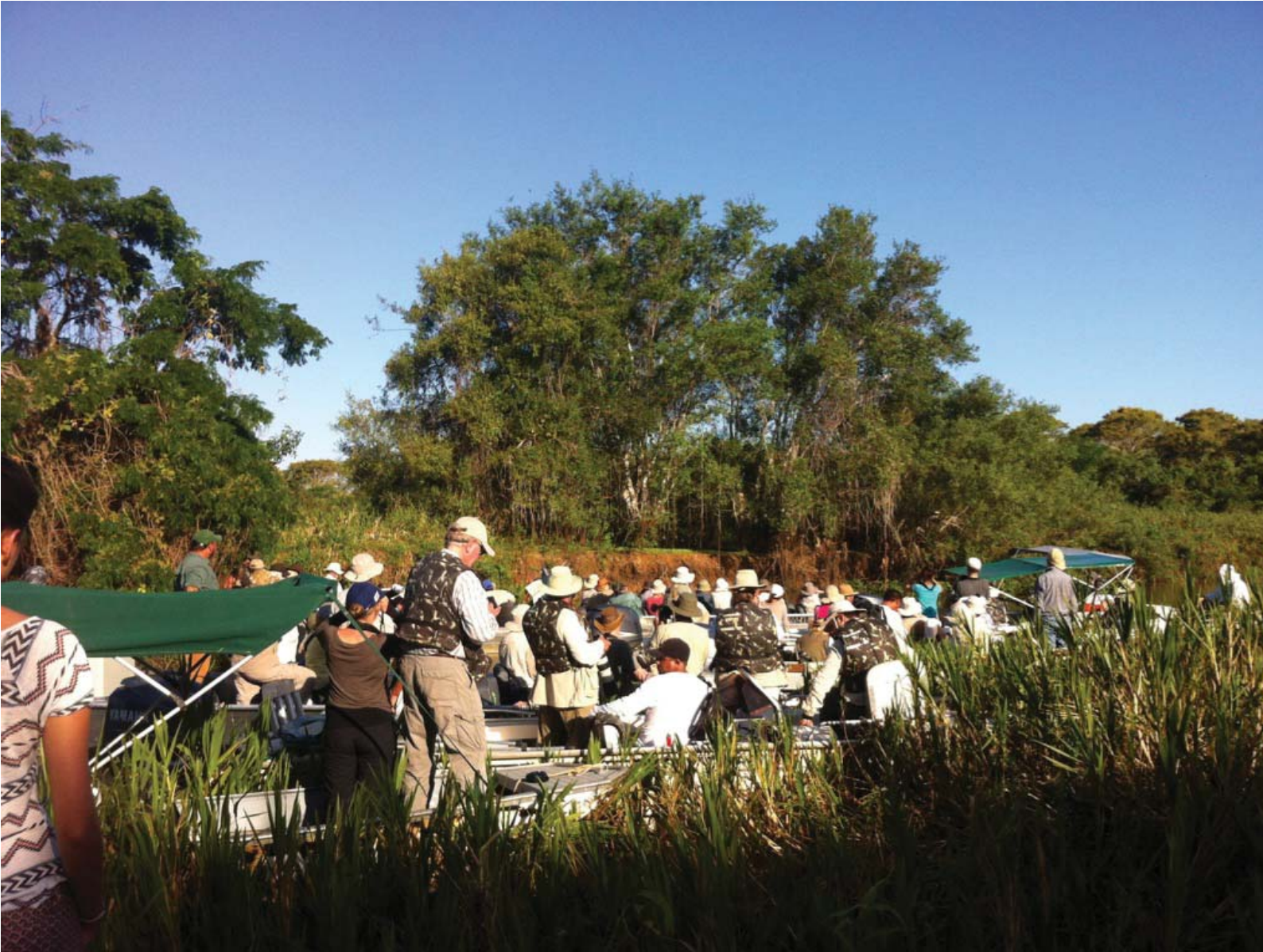
Figura 4 – Calçada Pantaneiro