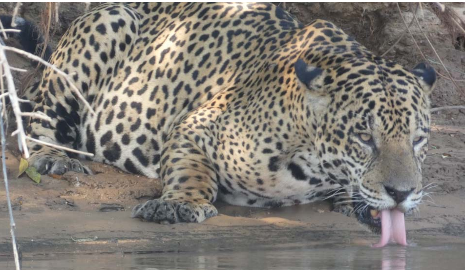
Figura 13 – A hora que a onça bebe água