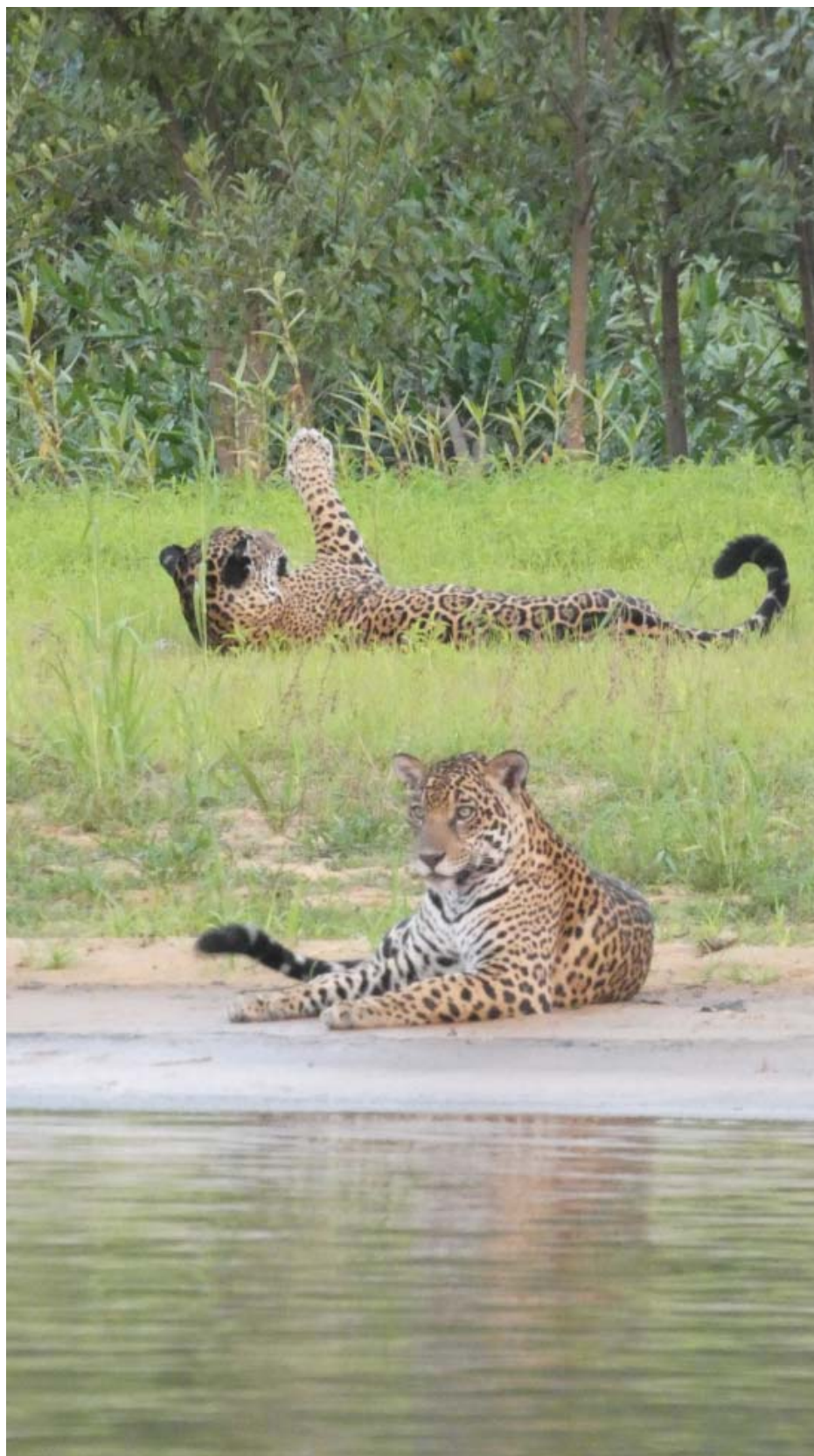
Figura 15 – Ninguém é de ferro: hora de relaxar e dar um espetáculo aos convidados