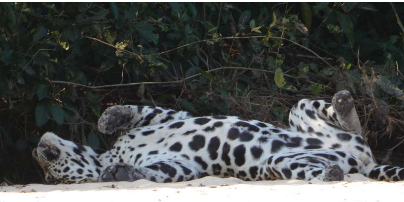
Figura 10 – Gatinha dengosa esperando o macho para o acasalamento