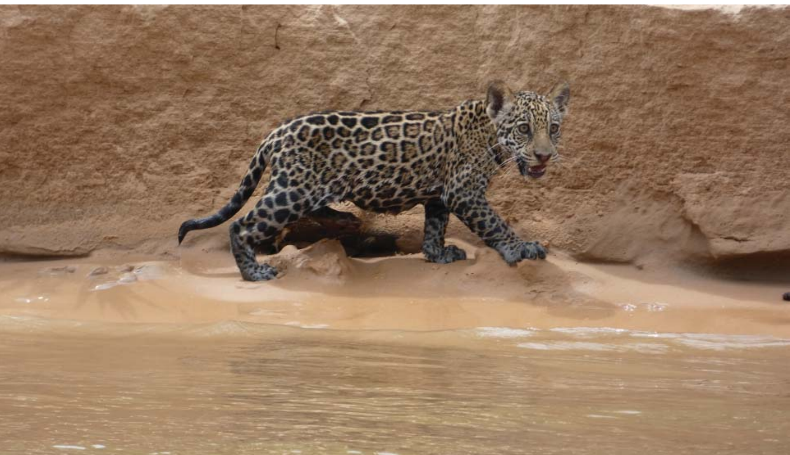
Figura 3 – Raridade: Bebê a bordo