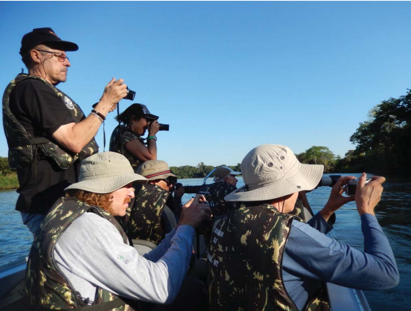
Figura 2 – Na hora do show: Clec clec clec clec