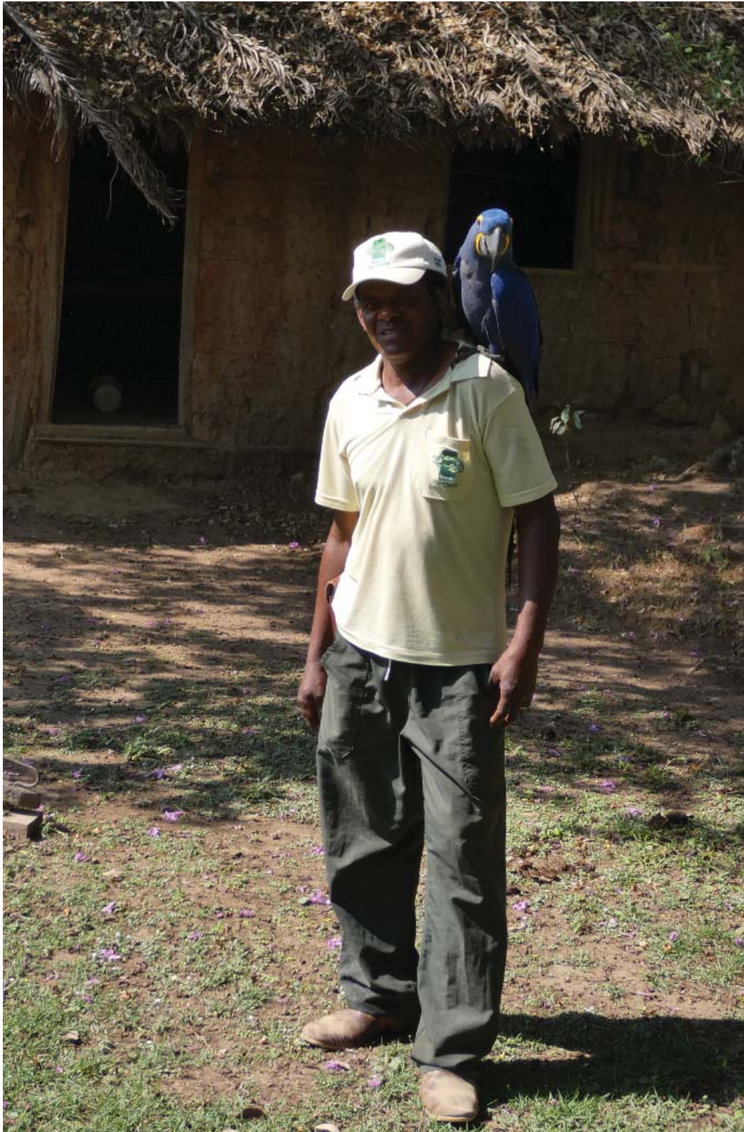
Figura 6 – Pantaneiro “raiz” ostentando a maior espécie de arara do mundo, tendo ao fundo modelo de casa tradicional Pantaneira