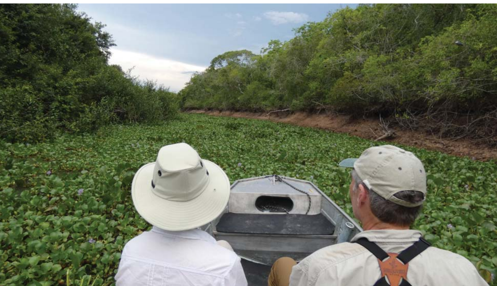
Figura 9 – Rio de flores - Será que o barco passa?