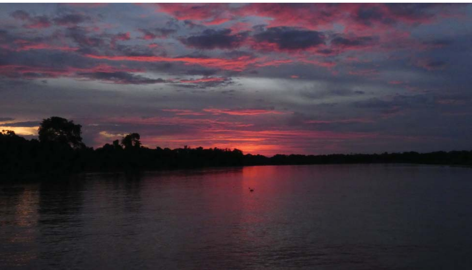
Figura 5 – Pôr do Sol - Cada dia um encanto diferente