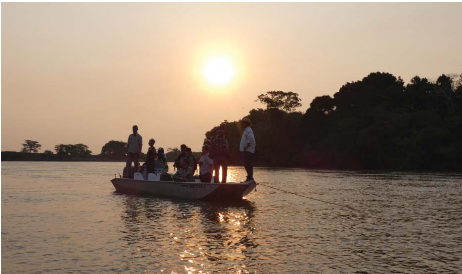
Figura 8 – Contemplação