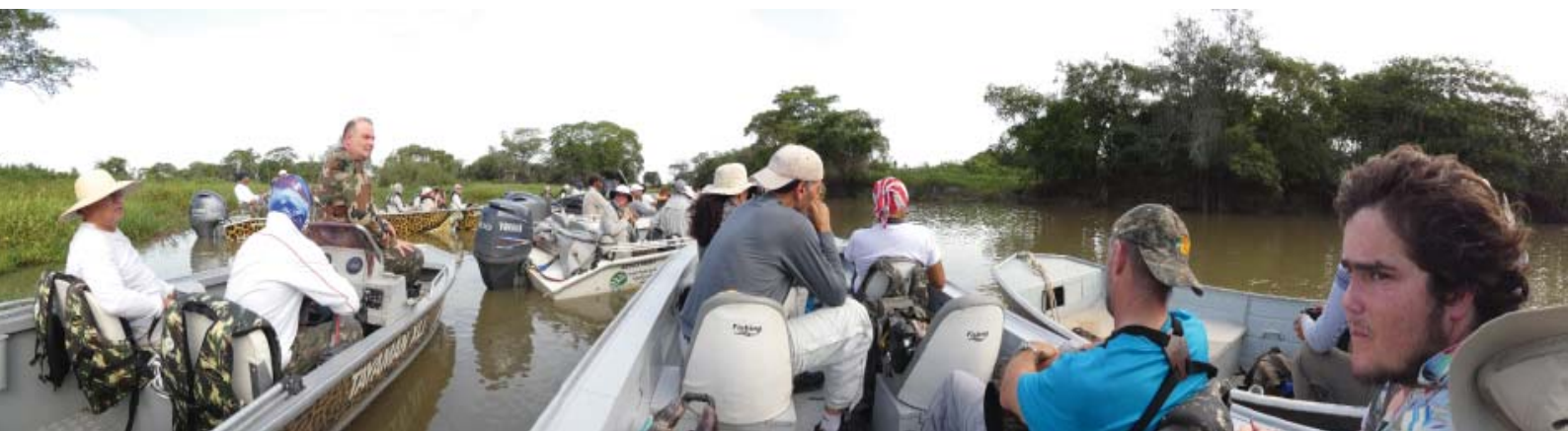
Figura 1 – Ansiedade - No rastro do grande felino das américas