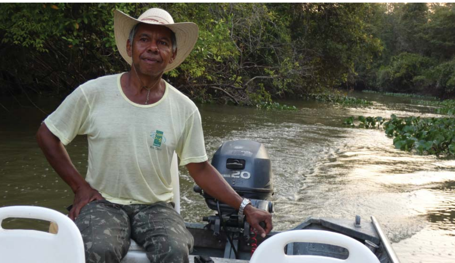
Figura 7 – Piloteiro concentrado explorando o rio Claro em busca de vida selvagem