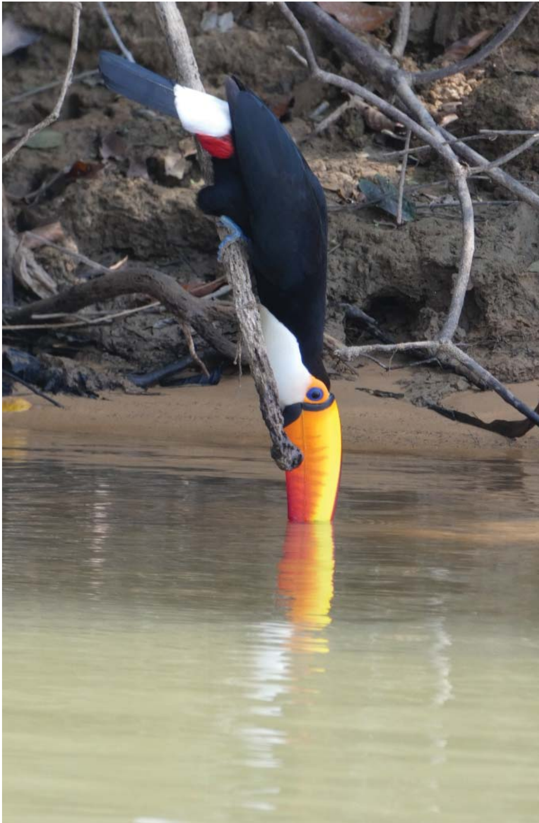
Figura 14 – Um Tucanuçu com sede desce devagarinho e silencioso, pois todo cuidado é pouco