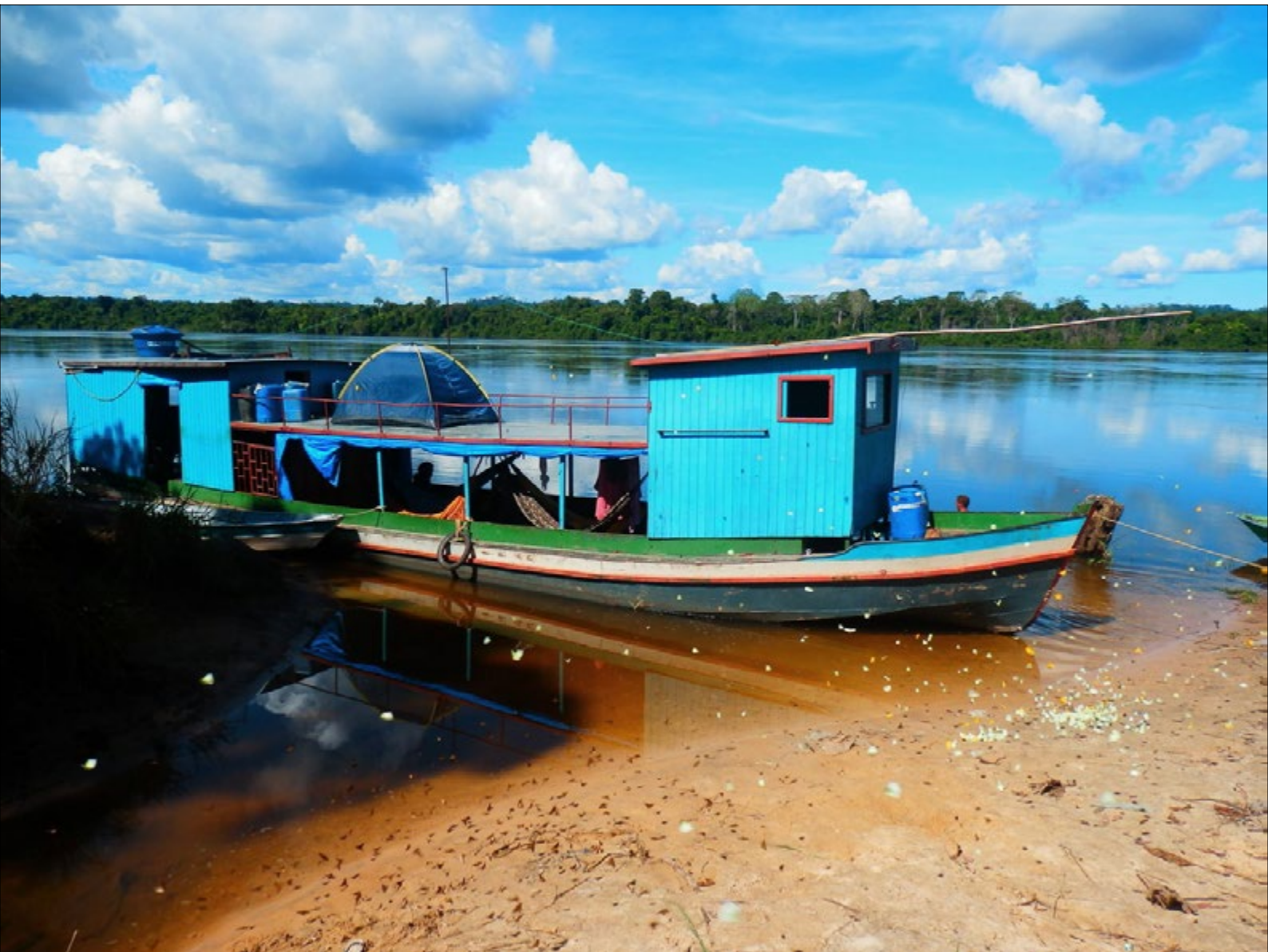
Figura 15 - Chegando ao final da trajetória, um lindo revoar de borboletas, contemplado no médio Xingu.