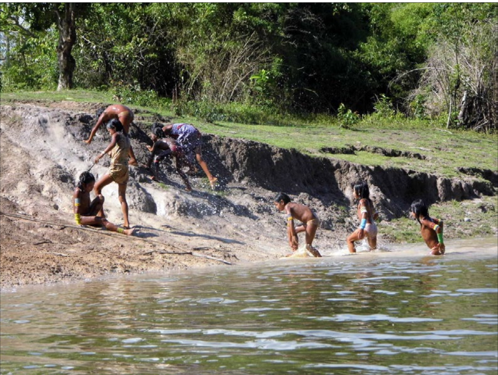
Figura 13 - Um pouco mais do cotidiano das crianças Mëbêngôkre, brincando no porto da aldeia Pykararãkre.