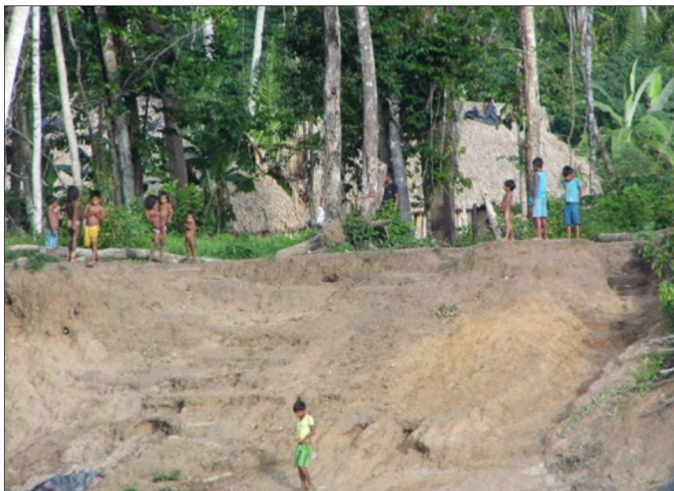
Figura 7 - O cotidiano de crianças indígenas Mëbêngôkre, ao amanhecer, às margens do rio Xingu.