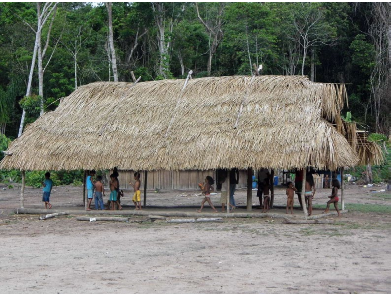
Figura 9 - Ngà ou “casa do guerreiro”, como denominam atualmente, também nomeada por alguns pesquisadores de “casa dos homens”. Foto: Dilma Ferreira (2013).