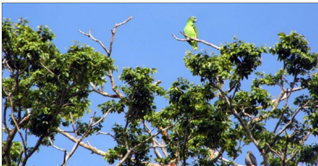
Figura 3 - Um espetáculo de flora e fauna às margens do rio Xingu, que alimenta o corpo e a alma dos povos que vivenciam essa beleza natural.