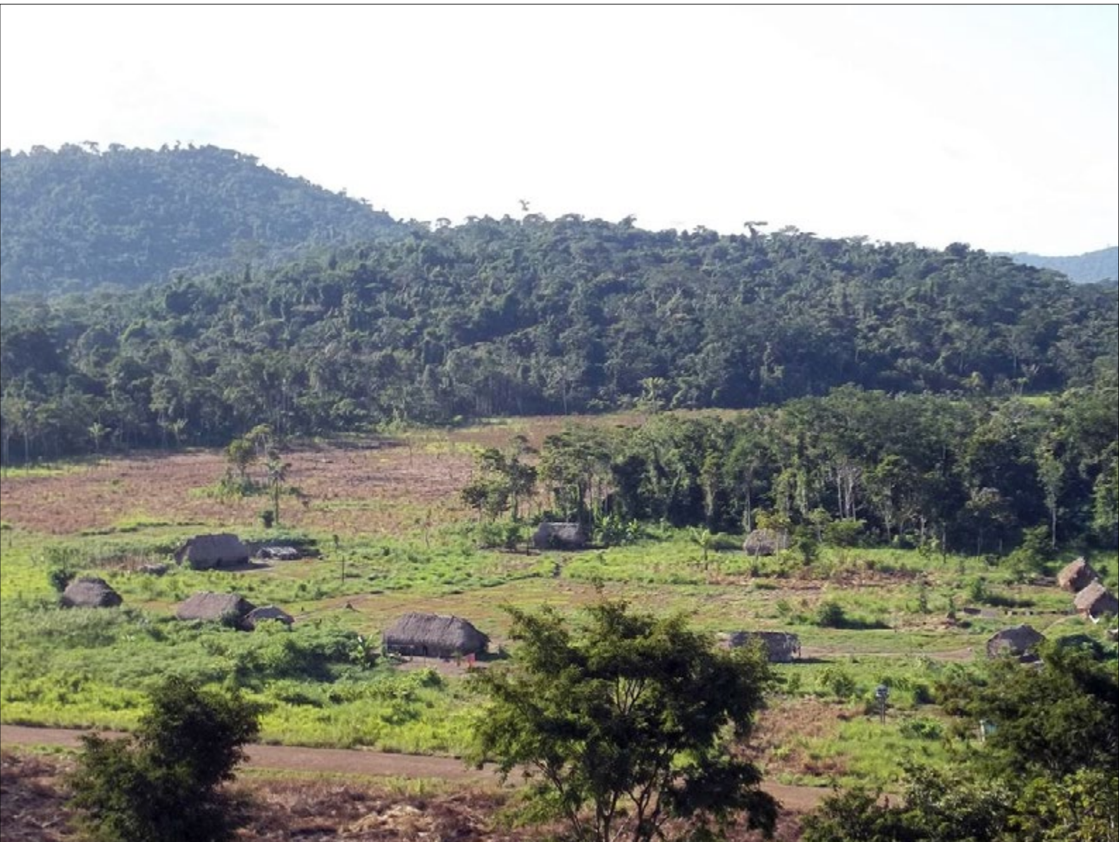
Figura 14 - Aldeia Kawatire, vista do alto de uma montanha. Ilustra o formato das aldeias Mëbêngôkre e de outros povos Jê setentrional.