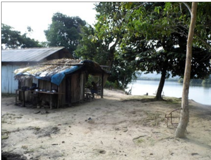
Figura 4 - Casa de ribeirinho às margens do rio Xingu, no médio Xingu. Foto: Dilma Ferreira (2013).