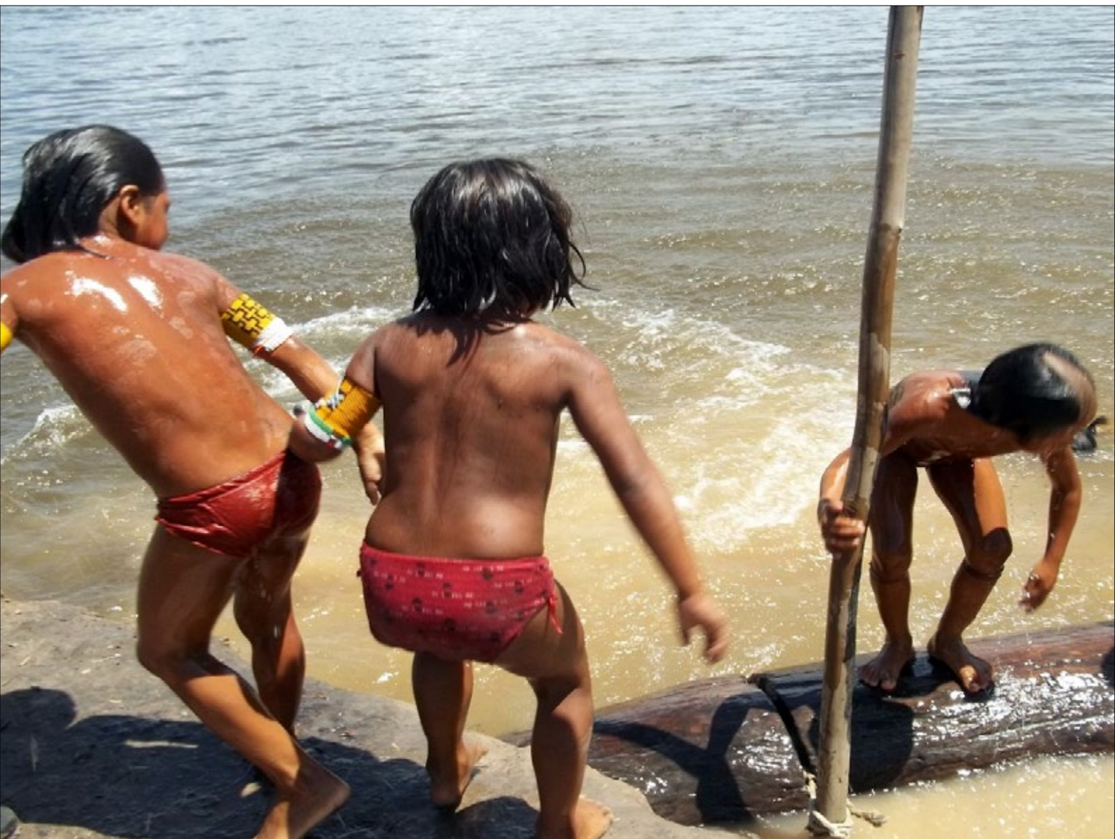
Figura 12 - Crianças Mëbêngôkre brincando à margem do rio Xingu, porto da aldeia Rikaro.