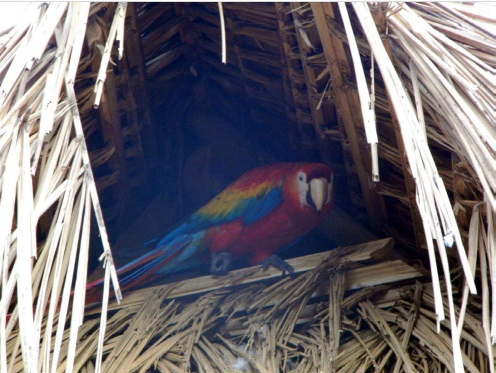
Figura 10 - Arara vermelha, um animal de estimação pertencente a uma casa Mëbêngôkre. Foto: Dilma Ferreira (2013).