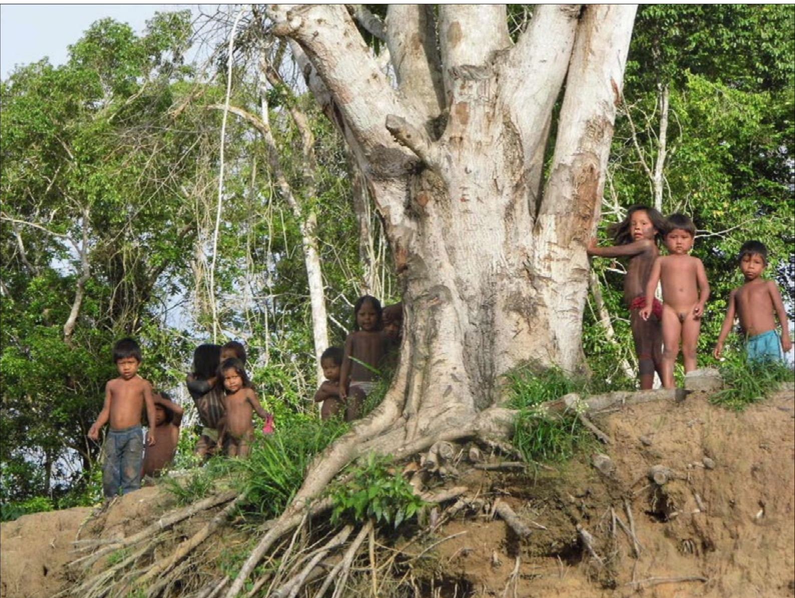
Figura 8 - O olhar curioso das crianças e a recepção rotineira dos Mëbêngôkre. Foto: Dilma Ferreira (2013).