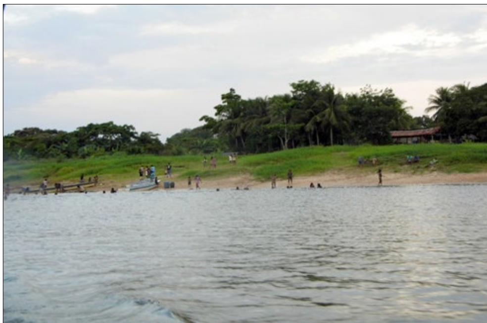
Figura 5 - Aldeia Kokrajmoro, uma das mais antigas do povo Mêbêngôkre, às margens do rio Xingu, localizada no município de São Félix do Xingu, estado do Pará, com aproximadamente 800 habitantes. Desde 1980, este espaço vem sendo palco de diversas cisões, prática comum entre os povos Jê, as quais possibilitaram a criação de várias aldeias nos arredores do rio Xingu e região, entre elas Pykararankre, Rikaro e Tepdjãti.