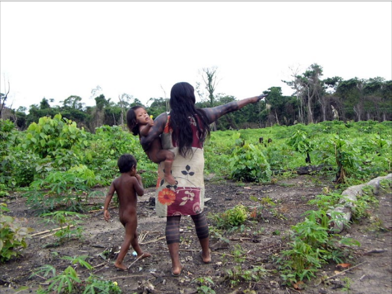
Figura 11 - Mulher Mëbêngôkre mostrando a beleza das roças, ao lado de seus netos ( tàbdjw ). Foto: Dilma Ferreira (2013).