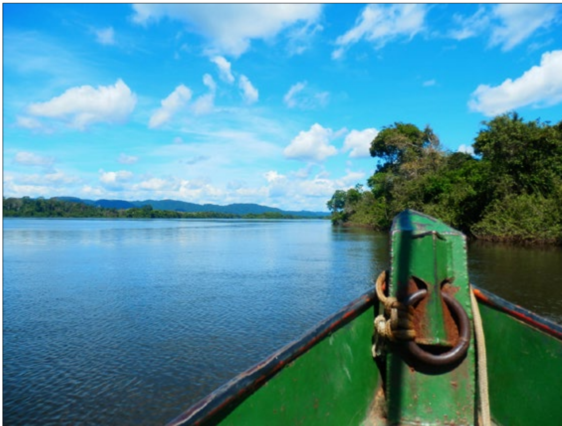
Figura 2 - Beleza em águas do rio Xingu.