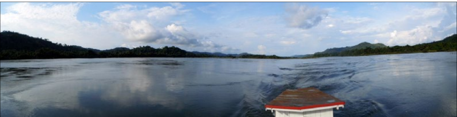
Figura 1 - Imagem registrada no médio Xingu, no município de São Félix do Xingu, estado do Pará, em cujas margens habitam ribeirinhos, pequenos proprietários de terra e o povo indígena Kayapó/Mëbêngôkre.

Este ensaio visa evidenciar paisagens, experiências e vivências dos povos tradicionais que habitam o médio Xingu, demonstrando a riqueza do rio que alimenta e encanta, sendo, ainda, palco de práticas xamânicas e fonte de conhecimentos tradicionais.