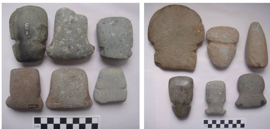
Figura 3 – Lâminas pequenas e lâminas de morfologia variada

tem sido contestada por alguns estudiosos (Denevan 1992, 1996; Erickson 2010; Mathieu & Meyer 1997) que sublinham a maior demanda de esforço físico e tempo para a realização de tarefas com os instrumentos líticos. Não obstante, apesar da importância das experimentações realizadas com os machados líticos para a comparação das marcas de fabricação e estigmas de uso, Kornbacher (2001: 34) nos lembra que esses tipos de estudos geram pouca informação que auxilie na compreensão do registro arqueológico e que é necessário maior controle sobre as variáveis que interagem na relação