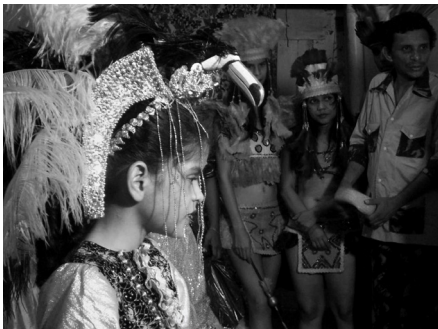
Figura 1 – Pássaro Tucano 2009.

De tal modo, em contraponto às propostas de “desencantamento” ou “homogeneização” das práticas sociais em urbes modernas, a pesquisa demonstra que a cidade belemense é “palco” e espaço de interações e práticas relacionadas a formas sensíveis da vida social (Sansot 1979). A etnografia junto ao Pássaro Tucano tem demonstrado que suas sociabilidades, seus modos de fazer e suas performances, afinal, revelam expressões e maneiras peculiares de viver no mundo urbano e amazônico belemense.