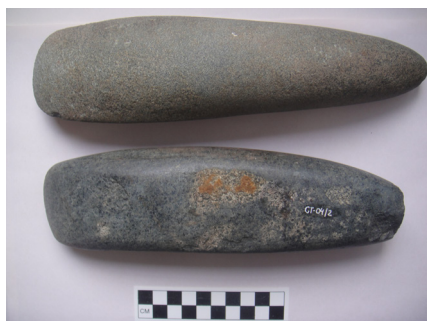
Figura 2 – Lâminas retangulares alongadas

amostragem analisada foi observado no município de Novo Progresso e Castelo de Sonhos: um fragmento de lâmina com duas chanfraduras em um