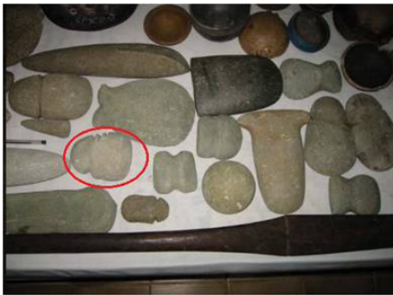
Figura 5 – Lâmina com três chanfraduras

Auxiliomar Ugarte (2009) baseando-se nos relatos de diversos cronistas, afirma sobre as habilidades artesanais das populações indígenas que foram, inclusive, elogiadas por alguns desses viajantes. Para além do aspecto estético dos artefatos fabricados relacionados com o design produzido pelo artesão, os diversos utensílios produzidos demonstram a variedade de conhecimentos técnicos que as diferentes populações indígenas possuíam. Por mais que, comparativamente a outras matérias-primas como o ferro e aço, os utensílios de pedra tenham uma