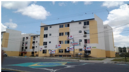
Figura 3 - RVM, usado como propaganda política em 2014.

O Residencial Viver Melhor, no sentido político, já cumpriu seu objetivo, os protagonistas que idealizaram, construíram e assentaram os indivíduos no conjunto residencial, se reelegeram ou elegeram seus correligionários políticos. Souberam usar bem o residencial como “ outdoor político ”, como instrumento de jogo político com a promessa realização do sonho da casa própria. A figura 3, mostra como o projeto foi usado como símbolo político. O governado do mandato passado, o senador atual, deputados federais, estaduais e muitos outros políticos foram eleitos usando o Residencial Viver Melhor como bandeira política nos seus discursos de campanha.