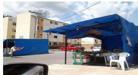
Figura 8 - Comércio irregular no Residencial Viver Melhor I.

O comércio irregular estão por todos o entorno do residencial, uma moradora disse: “Já existe um banheiro em cima da calçada”. Durante a minha pesquisa este fenômeno foi constatado e as invasões de comércio irregular estava apenas no início na etapa I entrada do conjunto. Agora a situação piorou as ocupações estão tomando todos os espaços. A figura 8, mostra as barracas improvisadas no início da I etapa.