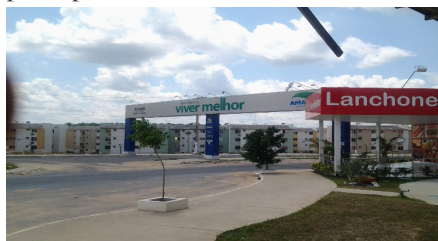
Figura 1 - Entrada de acesso ao Residencial Viver Melhor I e II.

O acesso ao Residencial Viver Melhor, serve também, aos conjuntos residenciais Harmonia, Paraíso, Vida Nova, Felicidade e Liberdade, ambos construídos pela iniciativa privada. Para quem vai no sentido a Itacoatiara, a entrada do conjunto Residencial Viver Melhor situa-se no lado direito, no fim do Bairro Santa Etelvina, antes da bifurcação da estrada de acesso ao município de Presidente Figueiredo. Não existe placa indicativa informando a entrada do complexo habitacional Residencial Viver Melhor e, pela falta de manutenção a rua principal estar cheia de buracos no asfalto, acesso está bastante prejudicado. A figura 1, mostra a entrada principal do Residencial Viver Melhor.