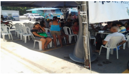
Figura 5 - Moradores do RVM I e II reunidos em assembleia.

A solução da problemática das altas taxas de água e luz foi resolvida na justiça com decisão favorável aos moradores. Agora existe outra preocupação dos moradores, a segurança pública. A violência está deixando os moradores em pânico. A figura 5, moradores reunidos para tratar assuntos de interesses coletivos.