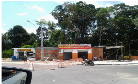
Figura 7 - Ocupações irregulares da reserva Adolfo Duke.

A polícia militar realizou uma reintegração de posse e derrubou muitos baracos, mas quando os policiais foram embora os invasores retornam as áreas. O comércio e as ocupações irregulares aumentam a insegurança, pois muitos dos proprietários de estabelecimentos precários não moram no residencial. A figura 7, mostra o início das ocupações da reserva ambiental Adolfo Duke, a reserva fica ao fundo do residencial, hoje devastada por ocupantes.