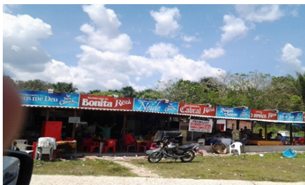
Figura 9 - Feira com instalações precárias na área no RVM.

Ambulantes e comerciantes irregulares vêm de outros bairros, aproveitam o descaso do poder público, são pessoas de grupos sociais diferentes, com visões e significados distorcidos de seus próprios contextos ambiental e social, formam a sua socialização sem nenhuma regra de conduta ou postura social urbana. A feira improvisada, entre a I e II etapa, é o exemplo da problemática de ocupações das áreas institucionais e de preservação da Reserva Adolfo Duke. A figura 9, mostra a feira entre a I e II etapa, construída na área verde de preservação.