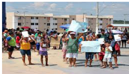
Figura 6 - Protesto dos moradores no Residencial Viver Melhor.

A figura 6 mostra os moradores protestando e cobrando das autoridades competentes as providências quanto a carência dos serviços básicos, reivindicando mais escolas, creches, estrutura de comércio e providências quanto a falta de segurança para os alunos e trabalhadores quando retornam à noite para casa e muitas vezes são assaltados no interior dos ônibus e no próprio residencial.