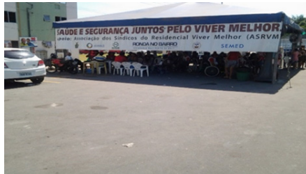
Figura 2 - Moradores realizando as assembleias no RVM. Fonte: Foto jpeg: Edilson do Carmo, 2014.

moradores. A atitude conjunta foi uma demonstração de socialização coletiva para resolver os problemas de interesses comuns. O evento era promovido pela Associação dos Moradores do Residencial Viver Melhor.