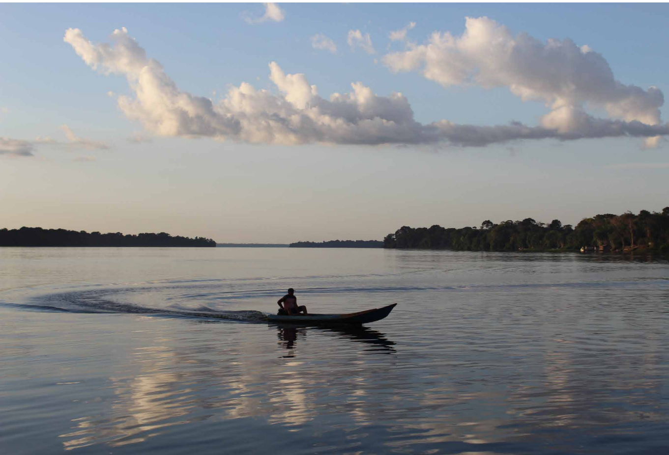
Figura 2