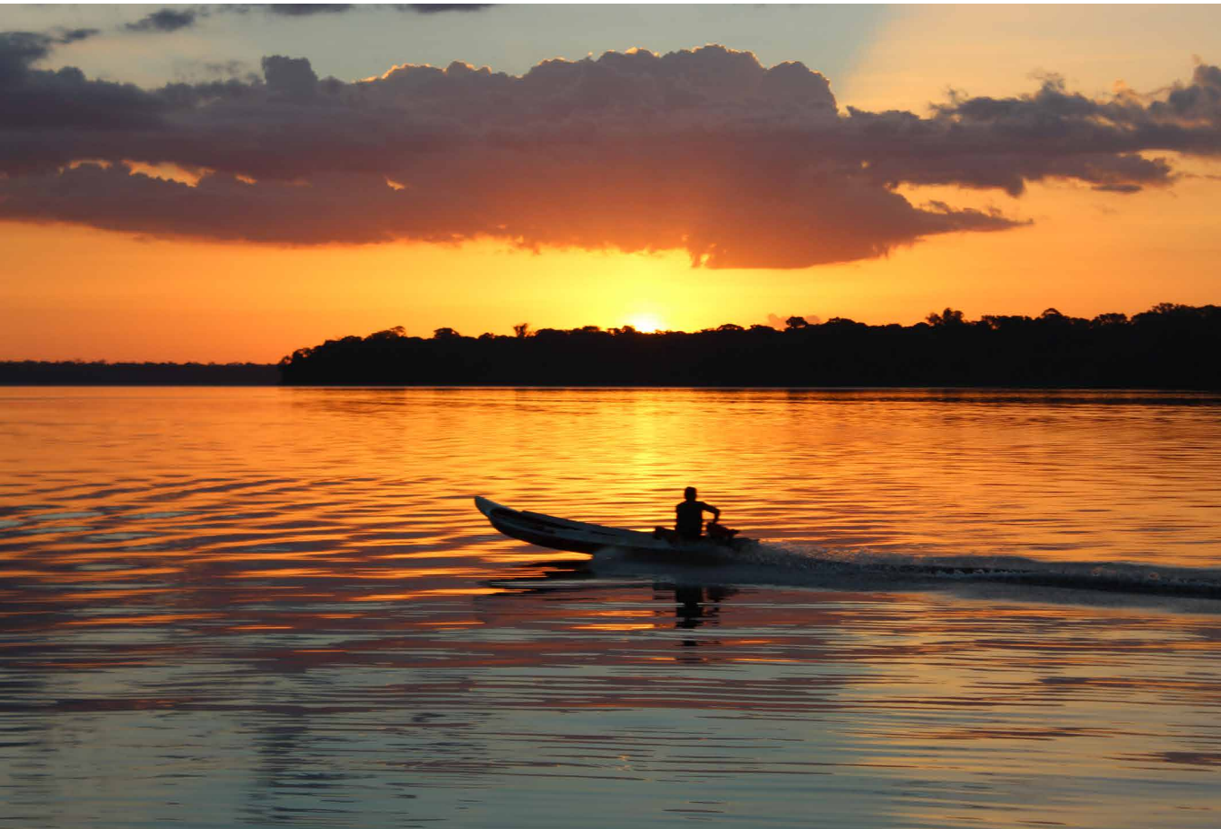
Figura 4