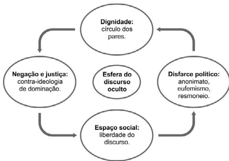
Figura 1 - Discurso oculto: dignidade, negação e justiça: produção de uma subcultura de resistência. Fonte: Scott (2013). Adaptação dos autores.

O discurso oculto é específico de um determinado grupo social, de um grupo particular de atores, e não abrange somente atos discursivos, mas compreende um conjunto de práticas diversas. “O discurso oculto representa, por definição, a linguagem – os gestos, discursos, práticas – que é normalmente excluída do discurso público dos subordinados pelo exercício de poder” (Scott 2013:60).