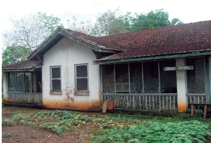
Figura 5 - Zebu Hotel