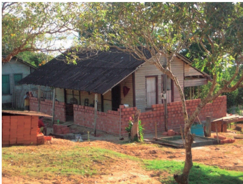
Figura 2 - Casa de operário