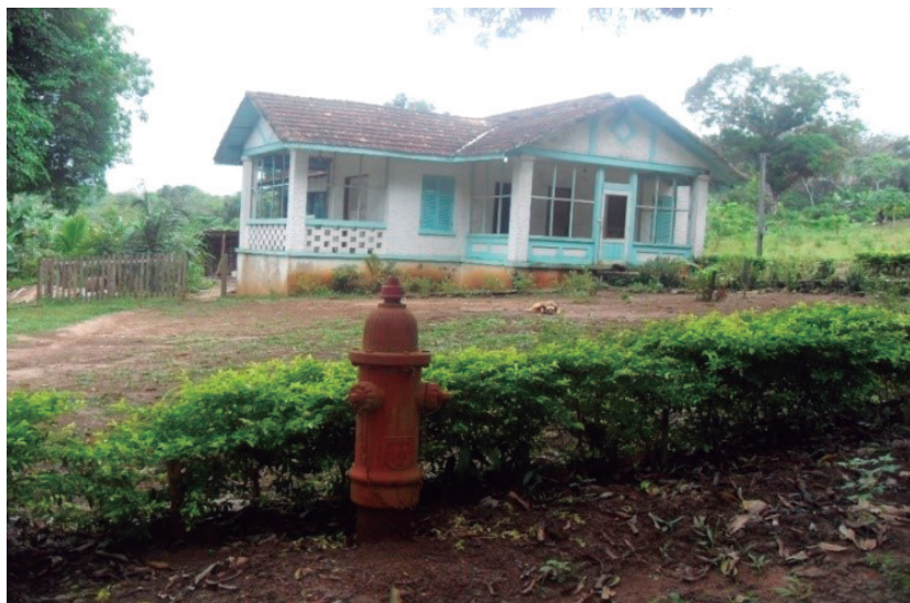
Figura 4 - Casa Vila Americana