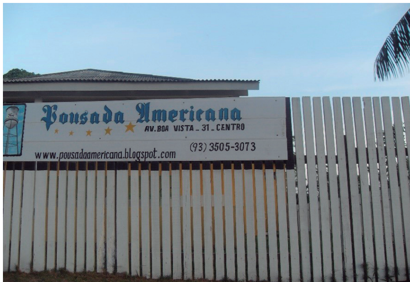
Figura 6 - Pousada Americana