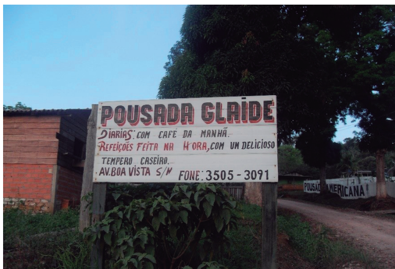
Figura 7 - Pousada Glaide

Fonte: Sahyra Figueira, 2013. Pesquisa de campo.