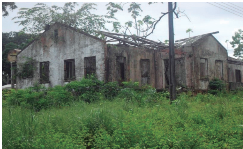
Figura 3 - Casa na Vila Americana