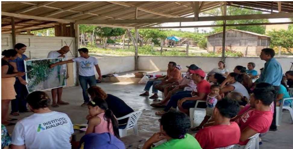
Figura 2: Oficina de Planejamento Participativo