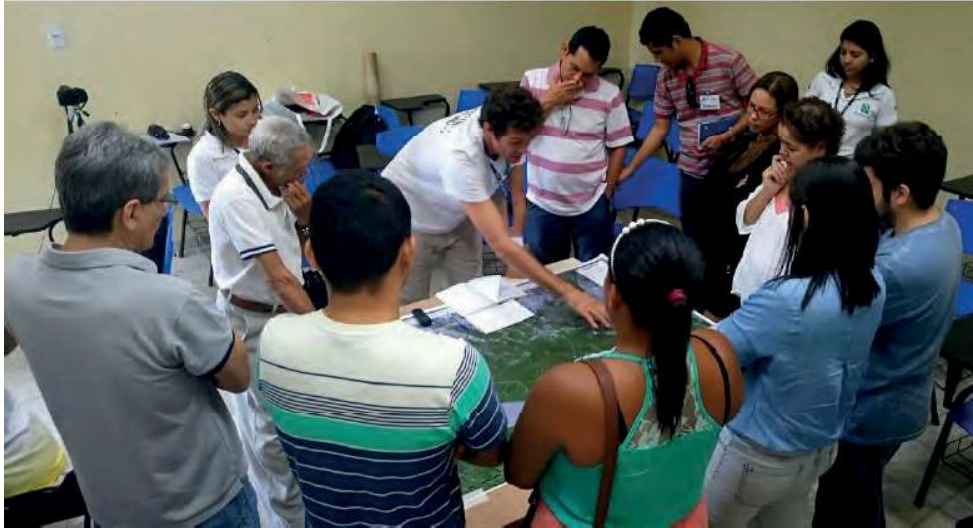
Figura 6: Aplicac o do Mapa Falado do REVIS Metr pole da Amaz nia.