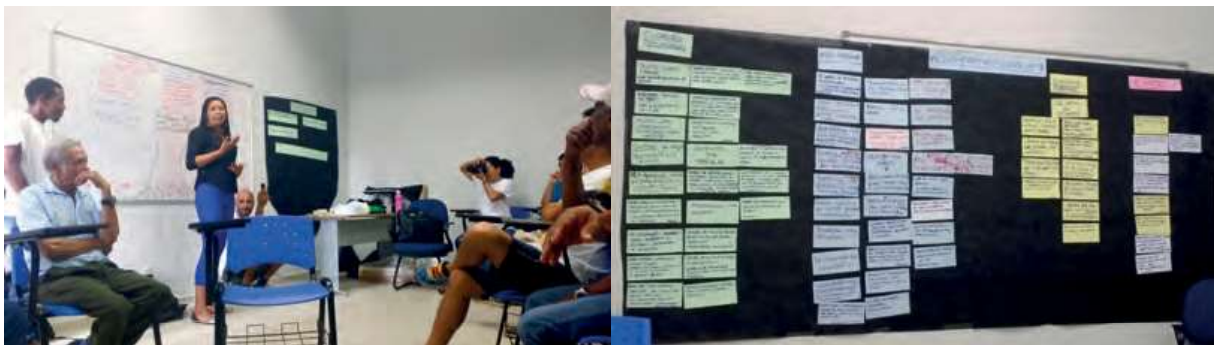
Figura 5: A árvore dos problemas