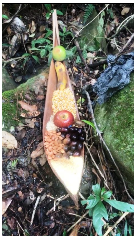
Figura 5. Oferenda aos donos do mato na Serra da Jiboia, Bahia, realização por membros da oficina de construção de tambores xamânicos. (março de 2020).

Um estudo realizado com comunidade de pescadores artesanais no interior do Estado do Piauí, Brasil, mostrou que esses pescadores convivem com diferentes representantes míticos que habitam os ambientes aquáticos, como Mãe d’água, Cabeça de cuia, Muleque d’água, Visage, Piratinga, Sucuiuiu, Luz e Arco-íris (SILVA et al., 2019). No litoral norte da Bahia, as comunidades pesqueiras compartilham os manguezais com a Vó da Lua, a Caipora e o Zumbi (MAGALHÃES et al., 2014).