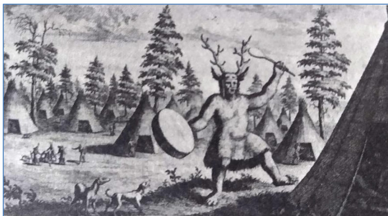
Figura 3. Xamã Tungus, registrado no livro North and East Tartary por Nicholas Witsen, 1785.

O termo xamã foi utilizado pela primeira vez pelo embaixador do Grão-Duque de Moscou, Evert Ysbrants Ydes, em 1692, para designar os extáticos da Sibéria que os exploradores russos tinham aventurado visitar (LASCARIZ, 2011). De acordo com Lascariz (op. cit.), o primeiro relato publicado sobre um xamã foi feito pelo explorador alemão Nicholas Witsen, em North and East Tartary (1692), que apresentou o primeiro registro desenhado do xamã siberiano com gorro cervídeo, a quem chamou “O Sacerdote do Diabo” (Figura 3). No entanto, o termo xamanismo aparece no chinês escrito desde pelo menos o século XII, referindo-se às práticas religiosas dos “povos bárbaros” que fizeram a corte chinesa recuar durante a Dinastia Jin (KÓSA, 2008 apud STERN, 2019).