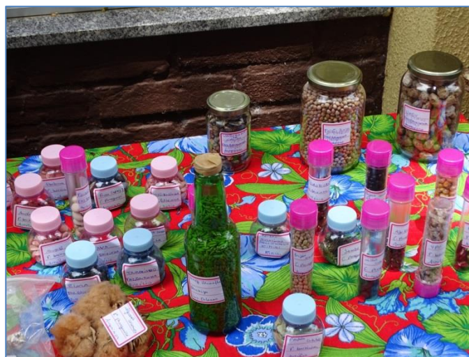
Figura 1. Celebrando a diversidade de sementes, que são um símbolo da vida e representam a divindade em vida. (novembro de 2016) durante o festival de sementes crioulas realizado em Feira de Santana, Bahia.

Toda comunidade humana inicia suas atividades e modos de cultura, hábitos, comportamentos e relacionamentos a partir dos ecossistemas onde ela se origina. Por isso não existe nenhuma sociedade humana, por mais complexa e tecnológica que se apresente, que não dependa de uma relação com o que os antigos povos chamavam de Mãe Terra, seja por uma questão de dependência de recursos materiais ou devido às conexões arquetípicas (METZNER, 2002). A espécie humana é “a Terra em seu momento de consciência, de responsabilidade e de amor” (BOFF, 2006, p. 55); daí a estreita relação do ser humano para com a Terra e através da Terra para com todo o Universo. É nesta conexão que devemos buscar a identificação de sua natureza e de sua missão (BOFF, op. cit.).