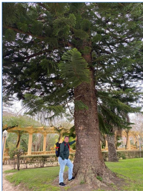
Figura 7. Saudando a uma conífera na cidade de Aveiro, Portugal. (janeiro de 2020).

Deus nos fala em nossa mente. Principalmente se estamos na Natureza. Deus está presente em cada flor e em cada árvore, em cada animal ou pássaro, cristal ou nuvem, oceano e onda. Aproxime-se da natureza – árvore ou colina, rio ou flor – e fale intensamente com o ser Elemental que existe dentro da forma. Depois, observe a reação em sua mente e em seu coração e retribua com amor. (GRZICH, 2011, p. 94).