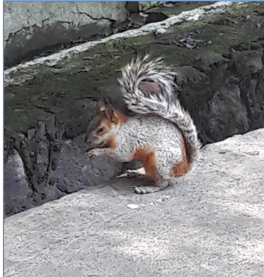
Figura 9. Esquilo, cujo poder simbólico remete à precaução, planejamento e previdência, equilíbrio do dar e receber. Foto do autor (setembro de 2017).

espécies e o espírito guardião de uma pessoa é uno com todos os representantes do grupo a que pertence, por exemplo, se alguém tem como guardião o urso significa que ela se alia à energia mágico-espiritual de todos os ursos (GRAMACHO e GRAMACHO, 2002). Estes espíritos guardiões trazem a sua medicina, poder, força e capacidade de cura (SAMS e CARSON, 2000). Assim, lobo e cobra devoram as doenças durante as sessões de cura; urubu é o faxineiro que limpa os resíduos tóxicos – emocionais e físicos – de feridas profundas, desta e de outras vidas (ARTÊSE, 2001; JANSSON, 2012). Observando os animais, podemos trazer para nosso íntimo a força deles, imitando sua estratégia para superar as dificuldades em nossas próprias relações pessoais. Por exemplo: em tempos difíceis, eu hibernaria numa caverna como se fosse um urso ou agiria como o castor e construiria novos atalhos e saídas para superar a crise? (WAGNER, 2000).