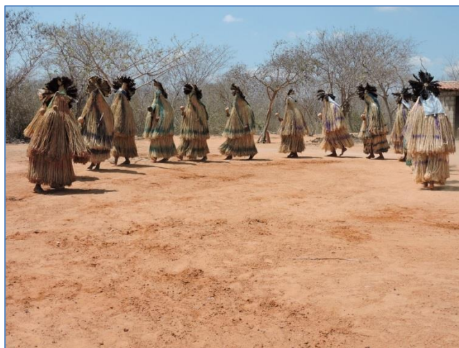
Figura 6. Dança dos Praiás, povo indígena Pankararé. Foto de Alzení de Freitas Tomáz (2017), extraída de Tomáz e Marques (2019).

Nos manguezais de Taperaçu-Porto, em Bragança/PA, os moradores convivem com o antropomorfo conhecido como Ataíde (COSTA, 2019). De acordo com esses autores, essas entidades espirituais possuem distinções quanto à forma e atribuições e podem estar associadas à sazonalidade (marcadores temporais) e habitats específicos (marcadores espaciais). O temor em relação a esses seres míticos poderia ser traduzido como uma relação de respeito e reverência ao próprio ecossistema manguezal. Percebe-se, assim, que o sistema de crenças associado à cosmovisão das comunidades pesqueiras desempenha papel regulador na dinâmica do ecossistema, devendo, pois, ser utilizado na elaboração de sistemas de manejo tradicionais. Porém, o avanço da urbanização e a introdução de novas religiões que negam a existência de espíritos da natureza são fatores que podem gerar o processo de aculturação entre os pescadores.