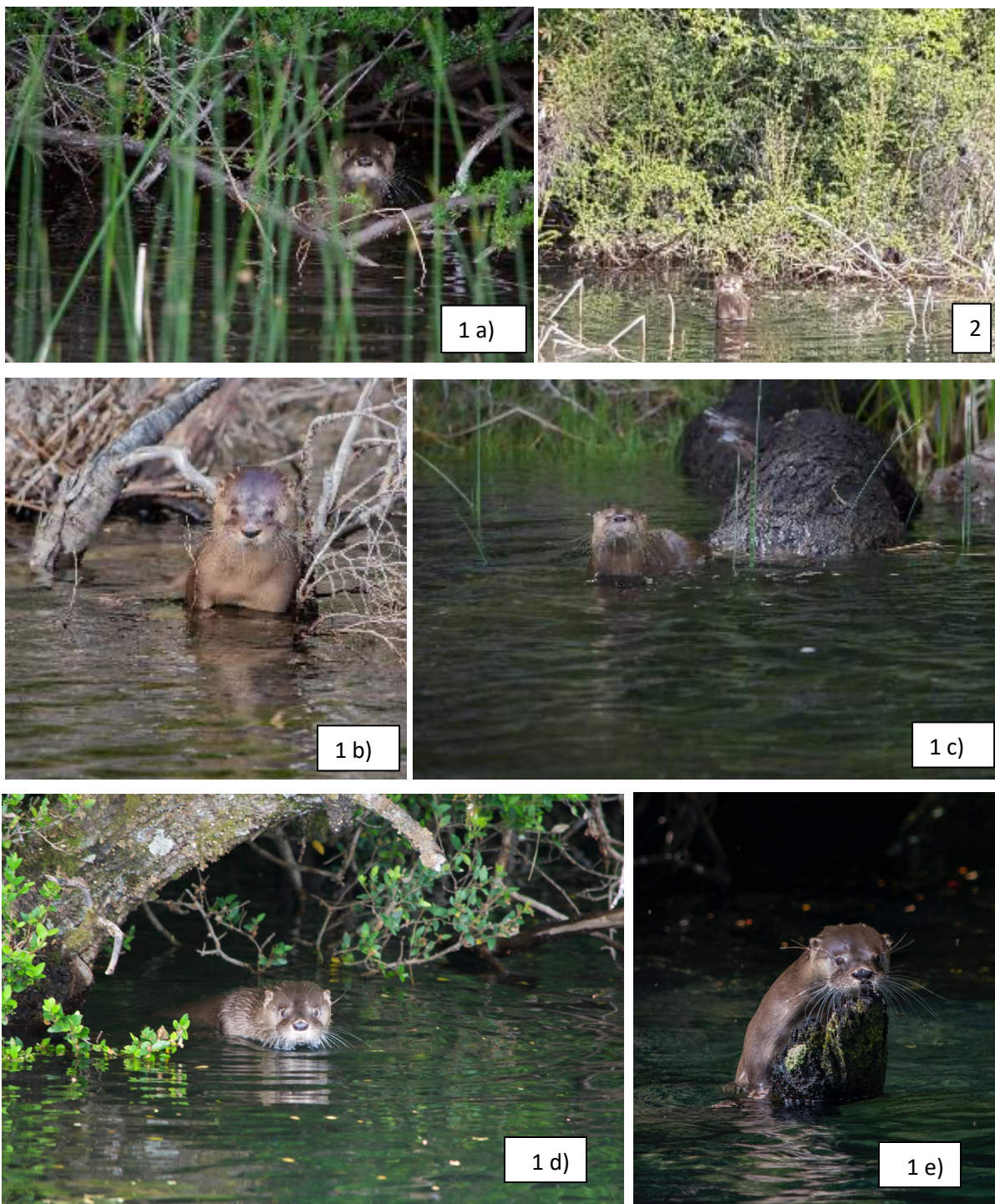
Figura 2: Fotografías de huillín en el lago Fonck (subcuenca del río Manso – cuenca de los ríos Manso y Puelo, Parque Nacional Nahuel Huapi).