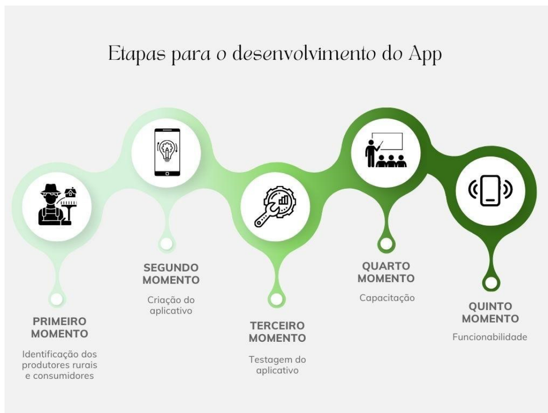
Figura 1: Etapas para o desenvolvimento do Aplicativo.

Na Figura 1 pode ser observado o caminho percorrido para o desenvolvimento do aplicativo “Feira na Palma da mão”, que incluiu o momento da identificação de produtores rurais e estabelecimentos comerciais; a criação de redes sociais e identidade visual; o desenvolvimento do aplicativo e site; os testes de funcionalidade; a capacitação aos produtores e consumidores e por fim, o lançamento da Plataforma digital.