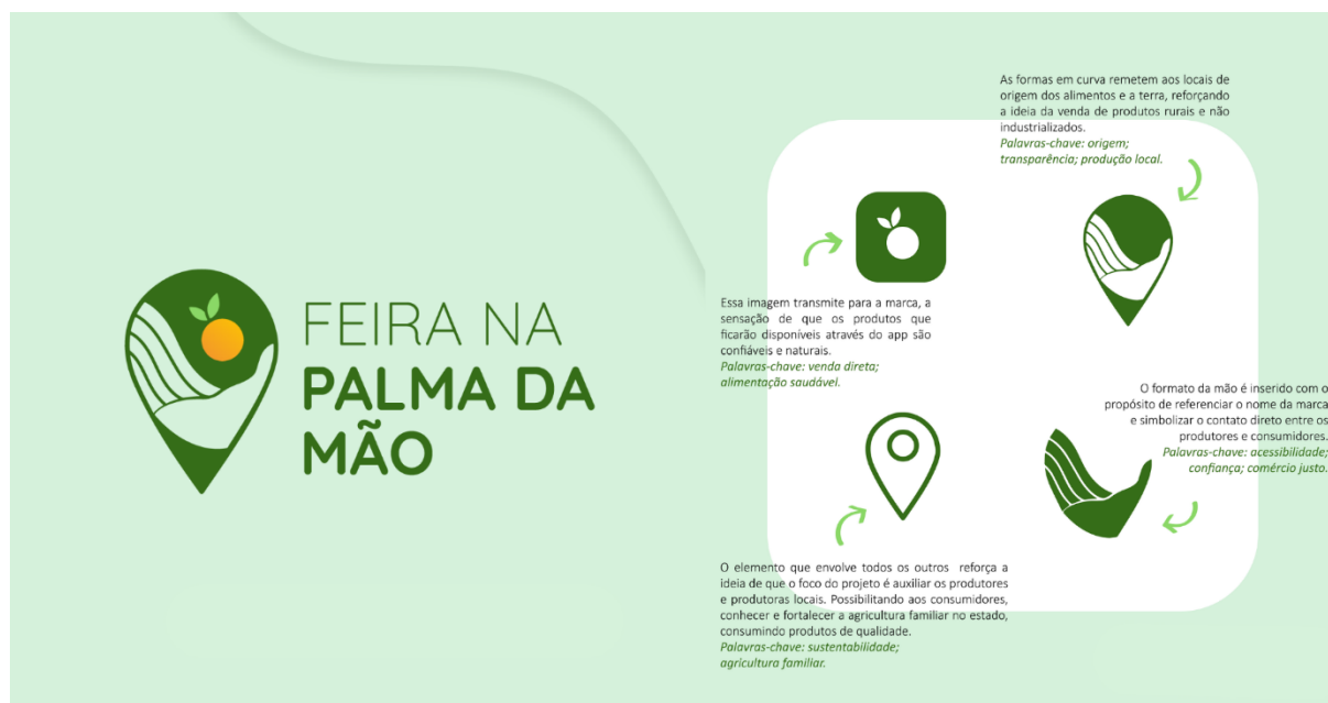
Figura 3: Identidade visual do aplicativo "Feira na Palma da Mão": logotipo e elementos (Fonte: BIMBATTO, 2021).

Para dar visibilidade e estimular os primeiros usuários a se familiarizarem com o aplicativo, foi criado um perfil nas redes sociais, com a intenção de promover a informação e divulgação dos envolvidos. Nessa etapa foi desenvolvida a identificação visual elaborada com elementos que caracterizassem o projeto conforme a figura 3.