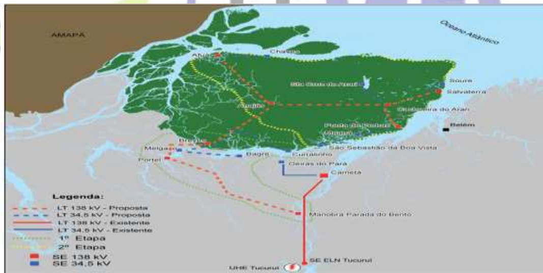
Figura 2: Sistema Elétrico Proposto ao Marajó.

No setor de energia elétrica, a oferta da mesma na região é bastante precária sendo fornecida por usinas termo elétricas que abastecem praticamente somente as sedes dos municípios. A falta de energia firme é hoje um dos principais problemas para o arquipélago, pois isto impede a dinamização da produção da região, fazendas, frigoríficos que demandam por este serviço para suas atividades não consegue manter uma produtividade, pois falta energia que seria essencial para a conservação animal. Em 2007, com a visita do primeiro Presidente da República, a visitar o Marajó, Lula anunciou em Breves termo de compromisso para a interligação do linha de Tucuruí que será ligado ao Marajó a partir de Cametá- Oeiras do Pará levando energia firme para toda a região.