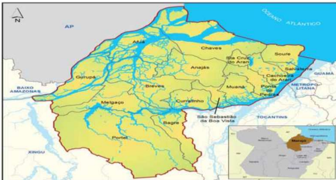
Figura 1: Mesorregião do Marajó - Área de abrangência territorial do plano.