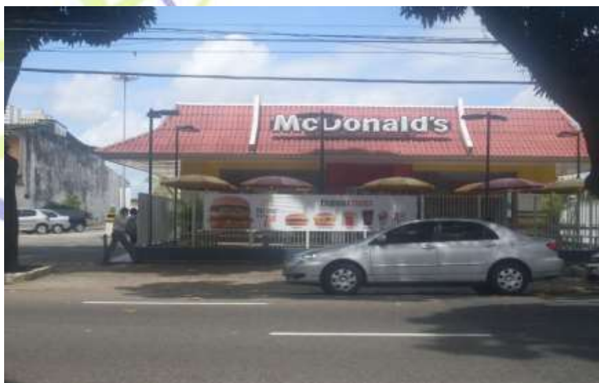
Figura 1: A loja da McDonald's na Avenida Nazaré, bairro de Nazaré, em Belém-PA.

As referidas empresas transnacionais se inseriram recentemente na cidade de Belém, contudo, grande parte de suas lojas, concentram-se nos bairros centrais, pela inerente centralidade que estes particularmente delineiam potencializado pela infraestrutura mais preparada e por um mercado consumidor potencial residente nestes espaços, fatores que explicam o seu poder de atração. Fatores que contribuem para a conformação de uma cidade “universal” na Amazônia oriental.