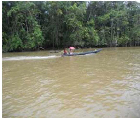
Figura 4: Ribeirinhos em rabetá.

Atualmente são poucos os ribeirinhos que ainda vivem de seu próprio sustento, por meio da pesca artesanal do peixe e camarão, da agricultura familiar de subsistência, da pecuária (em pequena proporção), do comércio e da extração e beneficiamento de madeira, que é extraída de forma rudimentar pelas populações nativas (SILVA, 2008), nas pequenas fábricas que resistiram as proibições feitas pelo Instituto Brasileiro do Meio Ambiente e dos Recursos Naturais (IBAMA), devido ao grande devastamento de áreas verdes da região.