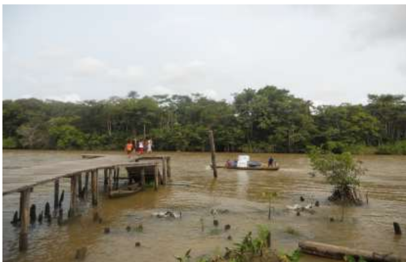
Figura 5: Família de ribeirinhos em sua rabeta.

A figura 5 abaixo representa o que foi enfatizado, demonstrando uma família de ribeirinhos que se desloca nos rios da região com sua rabeta contendo eletrodomésticos, como freezer, fogão e uma caixa d’água que receberam naquele dia do Governo Federal.