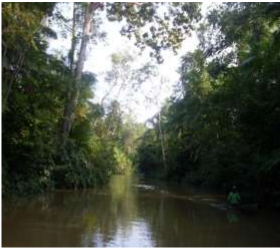
Figura 3: Ribeirinho em canoa nos furos de Breves.

Em vista disso, podemos encontrar nos rios, furos e igarapés da região de Breves vários modelos de transporte como: lanchas, rabetas, jet-skis, barcos de todos os tamanhos, balsas, e a também sempre presente canoa a remo, como podemos verificar nas figuras 3 e 4 a seguir: