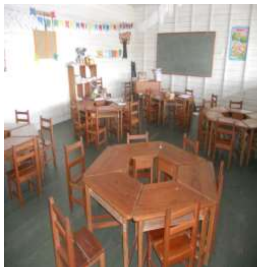
Figura 7: Sala de aula na Escola José de Matos.

No entanto, essa realidade acima apresentada não se encontra presente na maioria das escolas do meio rural no Município, pois ainda nos deparamos com situações desfavoráveis em algumas escolas rural-ribeirinhas que acabam por se sobressair, como: caminhos de difícil acesso, por meio de canoas ou barcos pequenos; algumas escolas com ausência de merenda escolar; alunos de diferentes idades e séries em uma mesma sala de aula com apenas um professor sem formação apropriada para lecionar nesses ambientes; materiais algumas vezes cedidos por escolas urbanas tornando o ensino urbanocêntrico e descontextualizado.