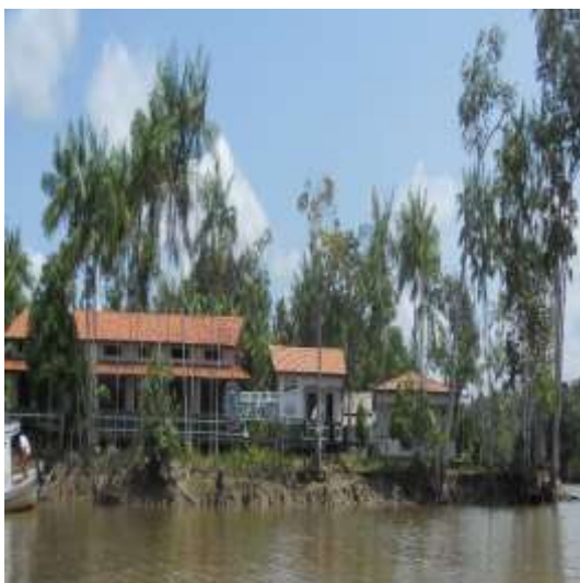
Figura 6: Escola Padrão José de Matos.

Podemos observar nas figuras 6 e 7 a Escola Padrão 8 José de Matos, no Rio Oleria, reinaugurada em abril de 2011, e que apresenta uma infraestrutura diferenciada de algumas escolas do campo no Município de Breves, funcionando em três turnos (manhã, tarde e noite) com 07 salas de aula, secretaria, biblioteca, copa, laboratório de informática, sala multifuncional e toda estrutura de uma escola urbana, ou até melhor que algumas escolas urbanas. Ao lado da escola há ainda uma casa que funciona como alojamento dos professores, essa escola assim como outras surgem a margens dos rios marajoaras modificando o cenário da educação do campo da região.