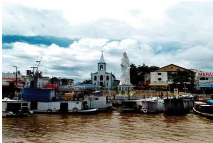
Figura 2: Frente da cidade de Breves.