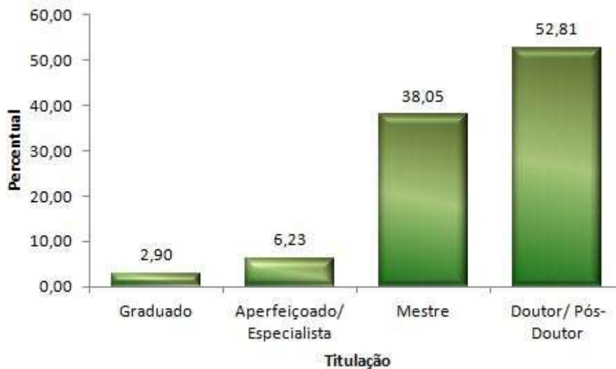
Gráfico 1 - Percentual de docentes efetivos da Educação Superior por titulação em 2012