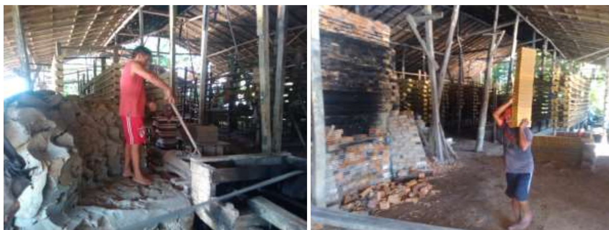
Figura 4 – Homens trabalhando na produção de tijolos, que na verdade, incia-se desde a ida à densa floresta para extração do barro. Num primeiro momento, temos o barro sendo pressionado para que possa ganhar a forma de tijolo, onde utiliza-se a força braçal. Num segundo momento, tem-se o tijolo já “seco” sendo levado para o forno.