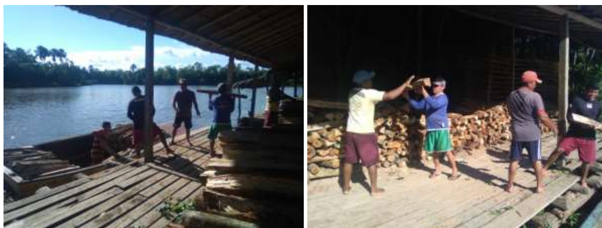
Figura 3 – Homens trabalhando na olaria, no descarregamento da lenha.

São as “experiências geográficas”, segundo Dardel (2015), que sustentam as relações humanas com a Terra, fazendo do Lugar um mundo-possível e a Paisagem como totalidade existencial do ser; uma mensagem que ecoa da emergência do ser-no-mundo; devaneios da pre-sença constitutiva de uma linguagem autêntica à beira rio. No anunciar de um mundo possível, o ser ribeirinho se realiza, presentificando-se enquanto tal em sua linguagem geográfica própria. A linguagem, no entanto, não está subordinada ao homem nem a mulher, pois é ela quem movimenta a vida ao sentindo essencial das coisas, anunciando o habitar poético, conforme Heidegger (1954). Ao mesmo tempo em que percebo o mundo, ele me percebe; nos “entrelugares” (BHABHA, 1998) tomo consciência daquilo que é no resguardo (a memória). A consciência torna-se então um meio, um “instrumento”, não um fim, como afirma Nietzsche (2010), sendo, inclusive, àquilo que utilizamos como base a uma determinada ação (SARTRE, 2008), como nos revelam os próprios habitantes da comunidade (Figura 3).