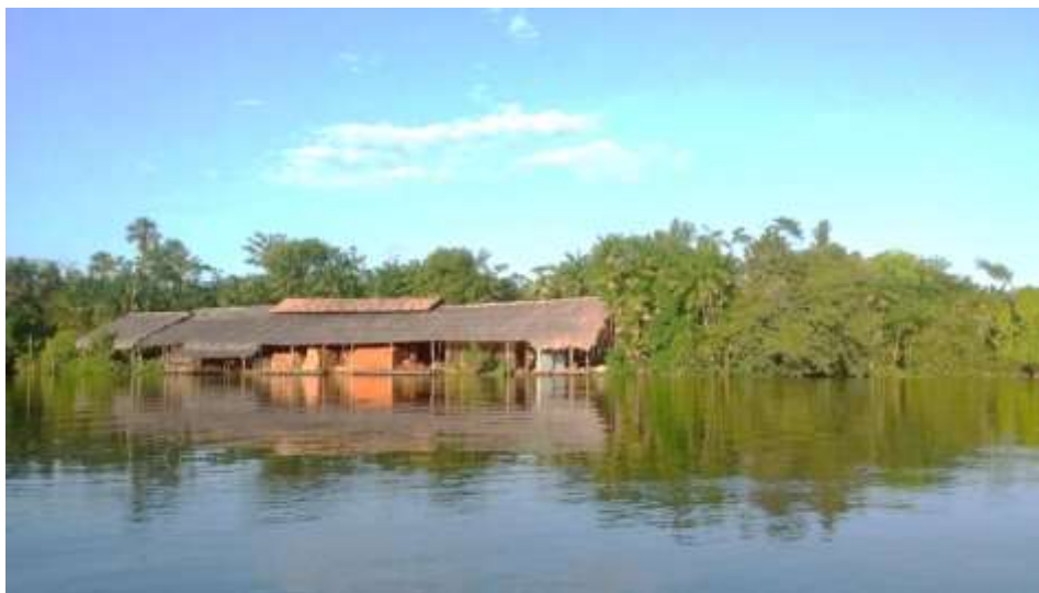
Figura 9 – Olaria, um lugar onde se fabrica os tijolos, uma parte do sustento familiar, um lugar de encontros.

na medida de suas necessidades materiais e imateriais, sempre mergulhados em sua própria densidade espaço-temporal, uma temporalidade que é diferente da frieza do relógio e sua mecanização da realidade. A olaria, as casas, os barracos, as pontes, as sedes onde se realizam as festas, são todas essas manifestações da geograficidade ribeirinha (Figura 9).