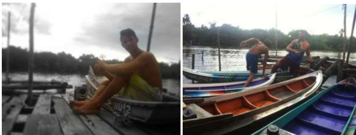
Figura 5 – Jovens e suas pequenas embarcações. Num primeiro momento, temos um Jovem sentado em sua “popota”. Num segundo momento, irmãos organizando o “estacionamento” dos cascos. Um modo de ser emana do ato reflexivo e orgânico.

Conforme nos ensina Nunes (2015), a linguagem exige-se enquanto espaço para as relações intersubjetivas. A linguagem ou a forma como se pensa e estrutura o espaço, reclama a filiação da existência por meio de uma interpretação que nasce do próprio ato interpretativo do enunciado, exigente, por sua vez, da “habilidade espacial” (TUAN, 2013). O ribeirinho, nesse sentido, hermeneuticamente arquiteta sua existência no espaço geográfico em mediação as suas necessidades e habilidades espaciais à luz de sua cultura. Se há luz, há produção de sombra, algo a sempre se desvelar ao homem e a mulher da várzea; a linguagem que nasce como semblante perceptivo do ribeirinho; performance artística de ação em caminho ao sentido latente de mundo, ato remanescente de uma poética criativa própria, campo iluminado pelas possíveis possibilidades de ser, no mundo (Figura 5).