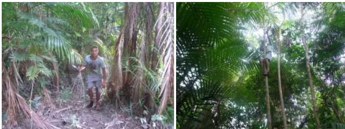
Figura 7 – Jovem apanhando o açáí. A paisagem o envolve, como se fosse um só num projeto total de ser.

O jovem confunde-se com a paisagem, demora-se nela. A paisagem confunde-se no jovem, demora-se nele. O jovem saboreia a paisagem, anunciando sua experiência como fenômeno . “O sabor, assim como outros elementos culturais e naturais, é uma das formas de estabelecer esta ligação homem-terra por meio da experiência da paisagem” (GRATÃO; MARANDOLA JR., 2011, p. 70). O sabor revela-se enquanto degustação devaneante na paisagem, anunciando uma poética do imaginário que se já filiada a Terra, reclama o lugar enquanto dimensão da cultura. Nesse sentido, “o sabor que guarda (e desvela) experiência e memória da paisagem e do lugar, como as imagens, os símbolos, os mitos não é uma invenção psíquica do ser humano, mas uma função de revelar essências do ser” (GRATÃO; MARANDOLA JR., 2011, p. 70).