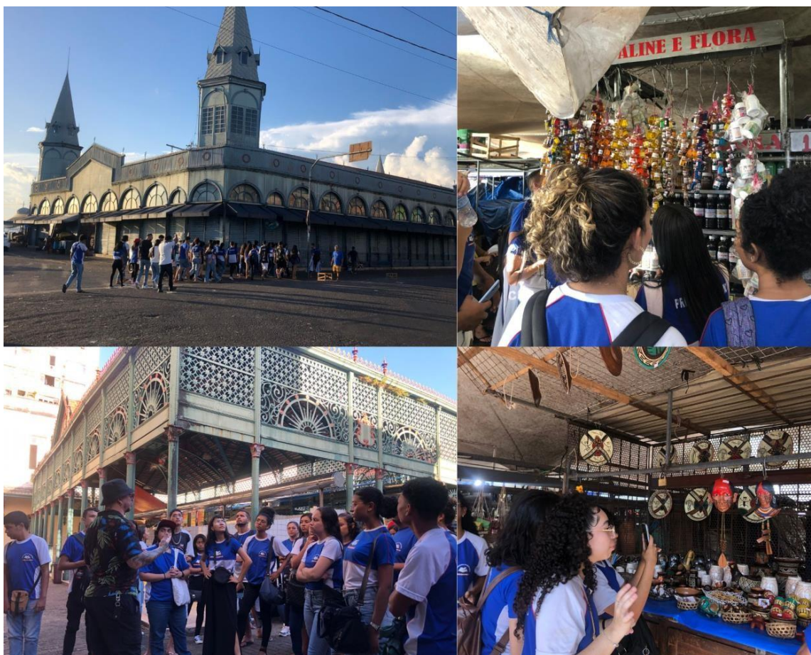
Figura 2 - visita técnica ao complexo do Ver-o-Peso

formação histórico-geográfica do lugar, destacando as diferenciações que existem dentro da feira, tanto do ponto de vista estrutural, quanto sob a ótica social, considerando as diversas relações estabelecidas e vividas nesse espaço.