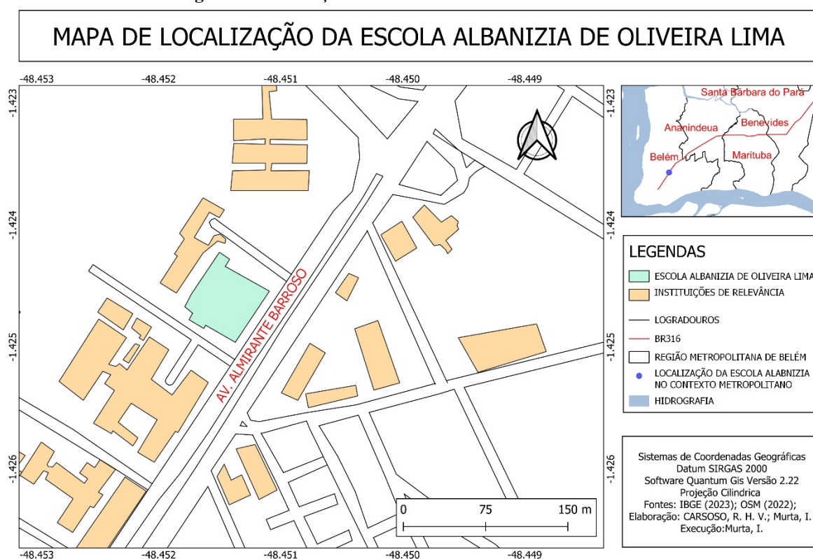
Figura 1- Localização da Escola Albanízia de Oliveira Lima

A Escola Estadual de Ensino Médio Albanízia de Oliveira Lima é uma instituição de referência educacional situada em Belém-PA. Fundada em 20 de fevereiro de 1999, a escola atende, em média, 1.080 alunos do 1º ao 3º ano do Ensino Médio, distribuídos nos turnos matutino e vespertino, com 14 turmas em cada período. Em visita em lócus, segundo o Projeto Político Pedagógico (PPP) da instituição e histórico escolar dos alunos, notou-se que a escola recebe estudantes de diversos bairros e Ananindeua, com Destaque ao Bairro Curió-Utinga e Sacramento e Souza sendo este último o bairro que a escola está localizada (figura 1). Quanto ao perfil socioeconômico, predominam alunos oriundos de famílias de classes baixa e média, cujos responsáveis desenvolvem atividades laborais diversas para garantir o sustento familiar.