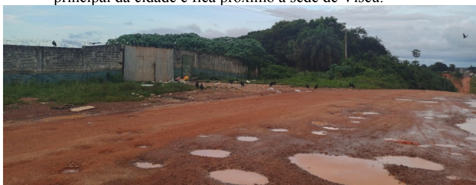
Figura 3: Lixão da sede Viseu-PA, fica localizado na estrada de chão, Br 308, estrada principal da cidade e fica próximo à sede de Viseu.

O plano diretor tem que estabelecer diretrizes para as políticas setoriais do meio ambiente, cultura, educação, saúde e habitação. Em Viseu o meio ambiente junto com a saúde mostra um índice de desenvolvimento muito baixo, pois a coleta de lixo na cidade por domicílio, de acordo com os dados do IBGE de 2010, são coletados 2.336; enterrado em sua propriedade 632; jogados em rio/mar/lago 38; jogado em terreno baldio 1.358; queimado 7.933. Percebe-se que a população no ano de 2010 era de 56.114 habitantes, atualmente é de 58.692 habitantes, isso nos mostra o aumento de produção de lixo pela população. Na sede de Viseu há um lixão (Figura 3), o qual não tem nenhum tratamento, os lixos são queimados ali mesmo. Além disso, a sua localização é próxima a cidade. Isso mostra e agrava os riscos à saúde da população viseuense, pois polui o ar, a terra e a água que abastece a população. De acordo com o Sistema Nacional de Informações sobre Saneamento-SNIS (2021) Viseu não possui coleta seletiva de resíduos sólidos e 44,8% da população total é atendida com a coleta de Resíduos Domiciliares. O responsável pelo serviço de coleta de resíduos urbanos é a Prefeitura Municipal de Viseu (PA)