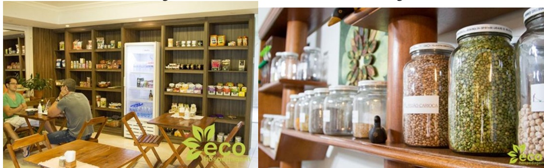
Figura 5. Fotos de restaurante de alimentos orgânicos

Disponível em: < http://ecohospedagem.com > Disponível em: