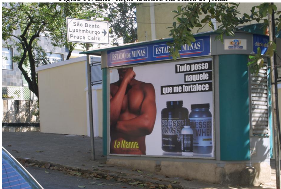
Figura 10. Intervenção artística em banca de jornal

Disponível em: < http://www.lamounierlucas.com/#!portfolio/vstc1=blessed >. Acesso em: 03 jun. 2015.