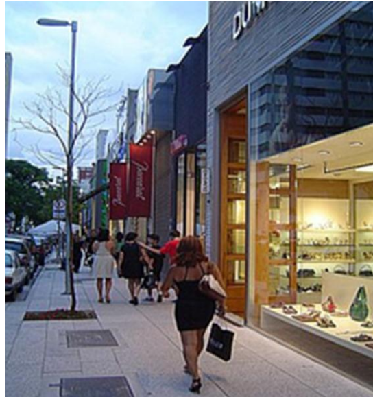
Figura 7. Foto de rua de comércio de luxo.