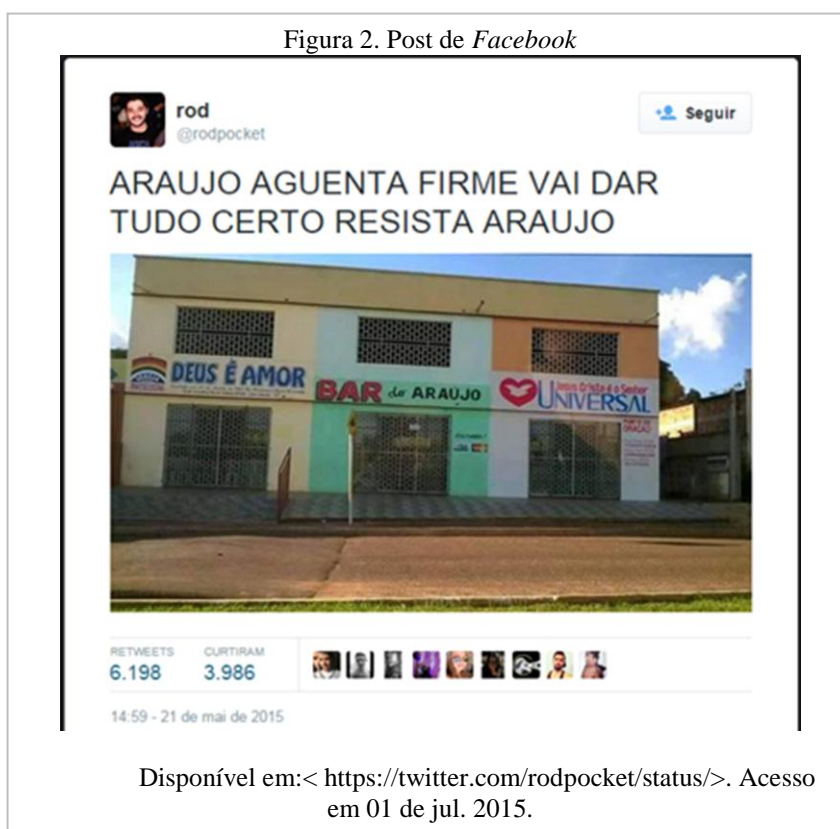
Figura 2. Post de Facebook

mais durável e salvacionista. O poder aparece conduzindo os sujeitos num espaço em que eles precisam se sentir livres, onde as práticas possam capturá-los ou os levarem à resistência, mas uma resistência não maior do que a constância das práticas do dispositivo. Assim, o espaço delimitado da cidade entra numa rede enunciativa, não como um documento da localização dos prédios, mas como monumento a integrar outros dispositivos. Como monumento passa a compor diferentes cenários e enunciados que respondem a algo antes e que suscitam outros enunciados como o do post (figura 2) publicado no Facebook : “Resista, Araújo!”. Araújo é o corpo que não aceita se moldar conforme as normas que asseguram a saúde, a longevidade, os bons costumes da moral cristã, a vida eterna. Mas é um corpo que se encontra acuado, cercado, sozinho, sem espaço para a luta diante do contingente da população que assina o contrato com o dispositivo.