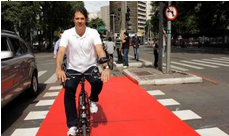
Figura 8. Foto de ciclovia na cidade de São Paulo (SP)

Disponível em: < http://noticias.terra.com.br/brasil/cidades/viver-sp/blog/2015/01/21/ciclovias-de-haddad-sao-premiadas-nos-estados-unidos/ > Acesso em 09/07/2015.