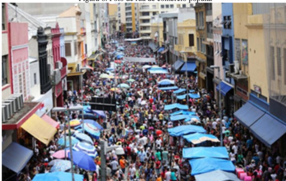
Figura 6. Foto de rua de comércio popular