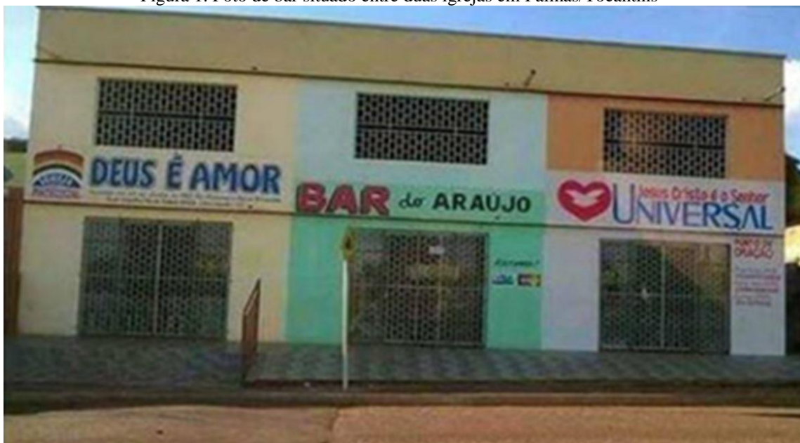
Figura 1. Foto de bar situado entre duas igrejas em Palmas/Tocantins

Disponível em: < http://www.e-farsas.com/bar-resiste-entre-duas-igrejas-o-bar-do-araujo-existe-mesmo.htm >. Acesso em: 01 jul. 2015.