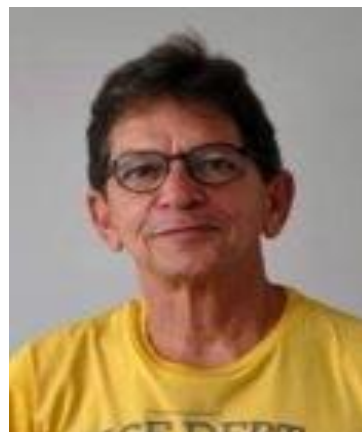
Figura 5.2 – Um homem comum

O ator Robert Pattinson (Figura 5), o papa João Paulo II (Figura 5.1) e o homem comum 6 (Figura 5.2) apresentam algum limiar de aproximação com as definições de criminoso propostas por Lombroso, no entanto, até onde sabemos, não ocupam essa posição em suas vidas. Vale considerar que, nas redes e trajetos de memórias que constituem os sujeitos, para além do fato de as ciências fisiognômicas se valerem de subsídios sistemáticos de avaliação para uma constituição do rosto, é comum a atividade mental de visualizar corpos, vestimentas e posturas e produzir associações, por um mecanismo de repetição, que identificam quem são esses sujeitos que vemos. Assim, se alguém, no nosso contexto sócio-histórico brasileiro, por exemplo, usa roupas largas e gorro na cabeça, e se a isso se associa a cor negra de pele, possivelmente entenderemos que esse sujeito é suspeito de irregularidade, seja econômica, social ou jurídica.