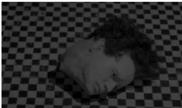
Figura 4 – Eraserhead (LYNCH, 1977).

Em 1977, David Lynch, diretor, roteirista, produtor e artista visual norte-americano, conhecido por seus filmes surrealistas, produziu sua primeira obra cinematográfica intitulada Eraserhead . Neste filme, como em alguns outros sequentes de Lynch, o efeito especial da cabeça degolada também aparece. Para além de ter sido categorizado como sendo do gênero de horror, Eraserhead produz efeitos dessa ordem horrífica, mas ao passo que se mostram tão perturbadores, evidenciam também uma composição redentora no discurso audiovisual: a cabeça de Henry - personagem central do filme - cai e seu cérebro é utilizado para fabricar borrachas escolares.