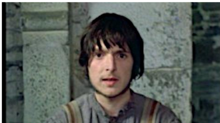
Figura 2 – Eu, Pierre Rivière, que degolei minha mãe, minha irmã e meu irmão (ALLIO, 1976).

É também o rosto de Rivière um que não se pode ver ou um que se deseja ocultar, podendo ser remetido a um rosto mascarado. O rosto de Rivière, cujo adiantamento se faz em relação ao tronco, também nos leva associar um possível uso de máscara que impede que sua identidade real seja conhecida. Ao nos darmos conta de que podemos estar diante de um homem sem rosto, o efeito do desconhecido é também fomentador de um efeito monstruoso. Mais uma vez, por meio das técnicas do dispositivo audiovisual, estamos diante de um monstro moral (FOUCAULT, 2001). Observemos, mais uma vez utilizando um outro fotograma capturado (Figura 2) da mesma sequência de cenas apresentada anteriormente, como há uma aproximação da imagem do rosto de Rivière com o uso de máscaras, tomando como disparador principal dessa comparação o sombreamento que o queixo provoca em relação ao restante do corpo: