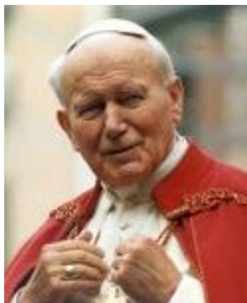
Figura 5.1 – Papa João Paulo II