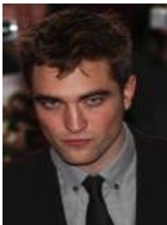
Figura 5 – Robert Pattinson Eraserhead