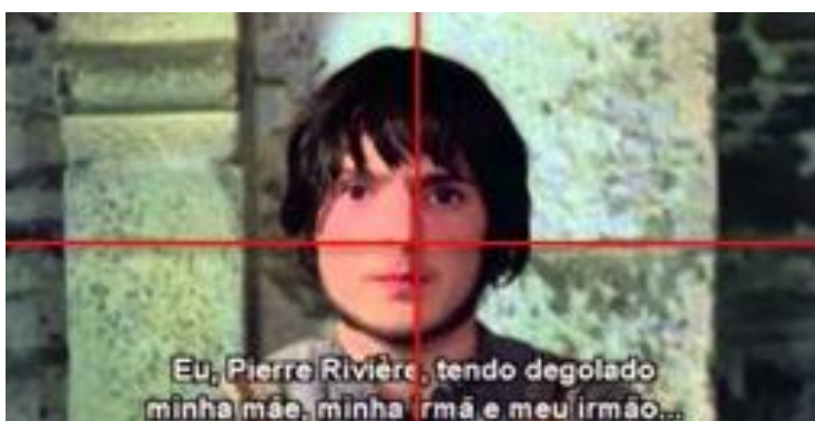
Figura 1.1 – Eu, Pierre Rivière, que degolei minha mãe, minha irmã e meu irmão (ALLIO, 1976).