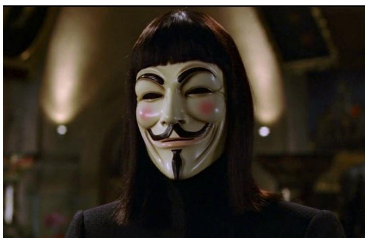
Figura 3 – V for Vendetta (James McTeigue, 2005).