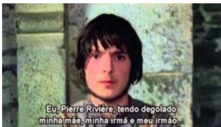
Figura 1 – Eu, Pierre Rivière, que degolei minha mãe, minha irmã e meu irmão (ALLIO, 1976).

No filme de Allio, os sinais fisiognomônicos de Rivière relatados nos registros e descritos no dossiê coordenado por Foucault são materializados por meio do dispositivo audiovisual de maneira a tornar irregular o rosto do criminoso em foco. Através do fotograma capturado de uma cena central do filme, em que Rivière, já detido pela polícia, confessa seus crimes, convidamos à análise do rosto de criminoso nos modos como foi produzido pelo dispositivo audiovisual (Figuras 1 e 1.1):