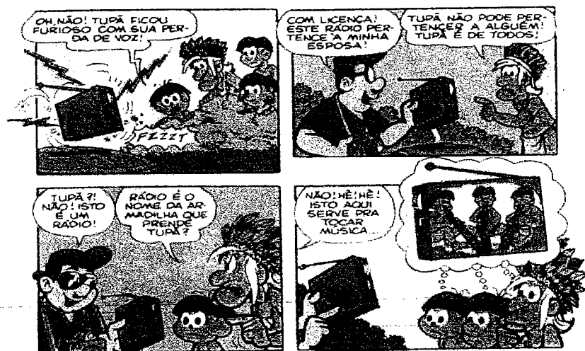
Exemplo do contato entre índio e caraíba.