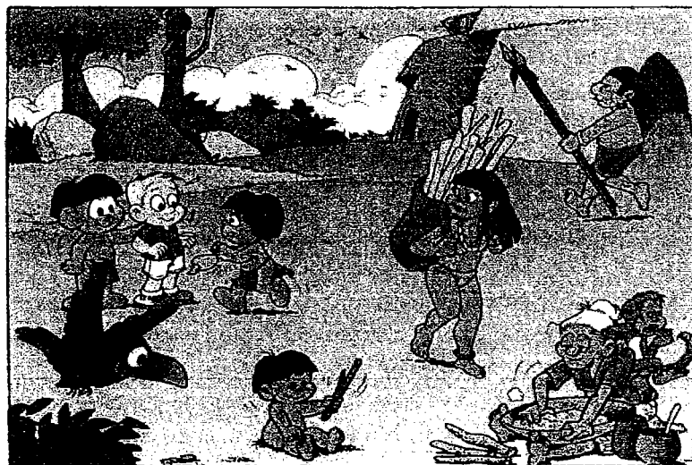
Representação de aldeia indígena difundida pela revista.