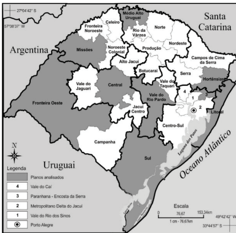
Figura 2 – Regiões Funcionais do Rio Grande do Sul e Conselhos Regionais de Desenvolvimento (COREDEs). COREDEs analisados.