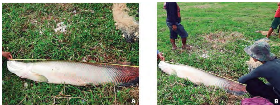
Figura 3 – Medição da espécie em comunidade com manejo

Quanto ao tamanho médio dos pirarucus capturados nas CCMP, fica por volta de 1,54m ( \pm 0,67 ), enquanto que, nas CSMP, o tamanho médio de captura da espécie gira em torno de 1,40m ( \pm 0,30 ) (Figura 3). A média do tamanho de captura da espécie, mencionada pelos pescadores das comunidades que têm manejo do pirarucu, está dentro do permitido pela instrução normativa número 34/04 do IBAMA ( > 1,50 m), demonstrando que está importante ferramenta do sistema de manejo está sendo cumprida.