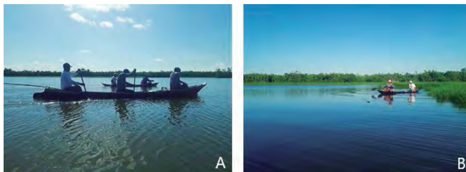
Figura 1 – Captura diurna do pirarucu durante a vazante na comunidade Santa Maria (CCMP)

No que condiz a preferência do período do dia para a realização da atividade pesqueira, nas CCMP, 53% preferem pescar no horário da manhã e afirmam que o período do ano mais apropriado é a vazante (59%) (Figura 1). Enquanto que 42% das CSMP preferem o horário da tarde e citam a enchente (58%) como período mais apropriado para a pesca.