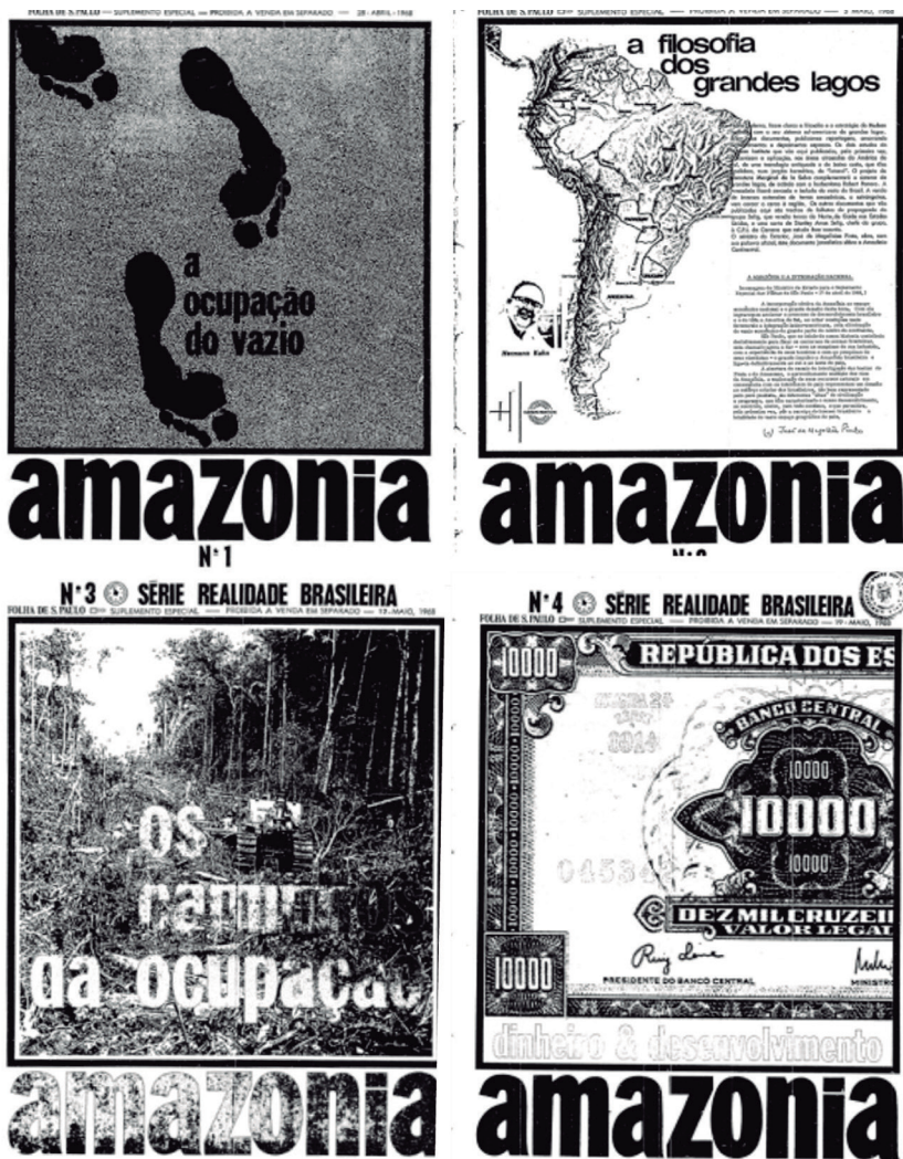
Figura 3 - Reprodução das capas do suplemento especial do jornal Folha de São Paulo: Série Realidade Brasileira.

De todo modo, o fato é que tanto o editorial anteriormente mencionado bem como a propaganda veiculada indicam o que seriam as publicações da Série Realidade Brasileira, que visava a apresentar, para a Amazônia, projetos que vislumbraassem alcançar o status de região desenvolvida, sob o impulso do progresso que urgia na época. Vejamos, a seguir, como foram pensadas as capas de cada uma das edições dedicadas à região e, somadas aos títulos dados a elas, conseguiremos – com toda certeza – compreender tais representações, forjadas nas páginas do periódico analisado.