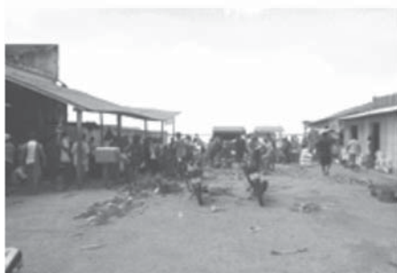
c) Porto do Açai.