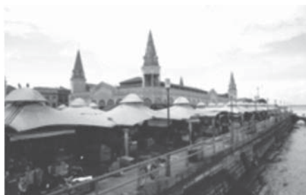
a) Complexo do Ver-o-Peso.