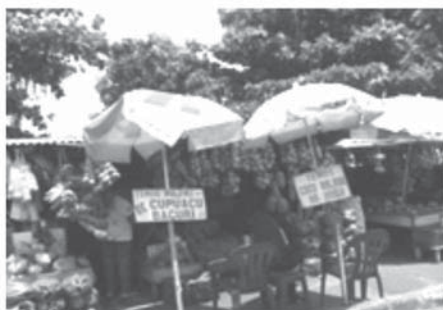
d) Feira da Orla de Icoaraci.