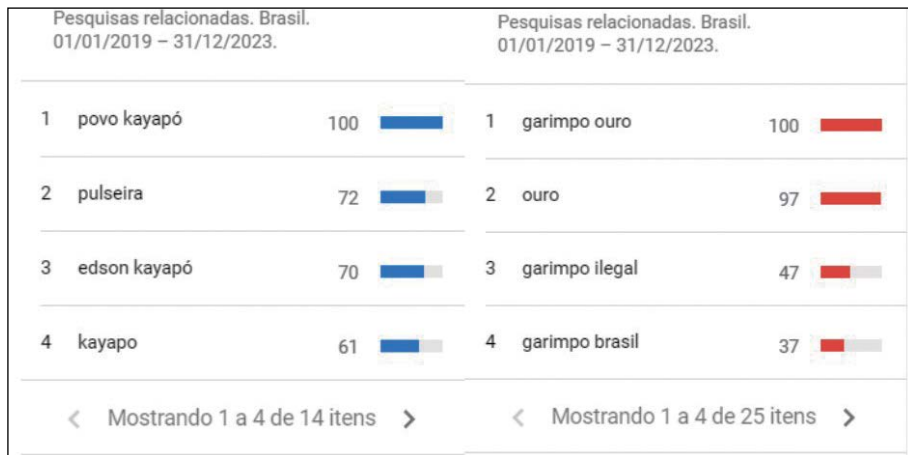
Figura 2 – Pesquisas relacionadas aos termos “Kayapó” e “Garimpo”