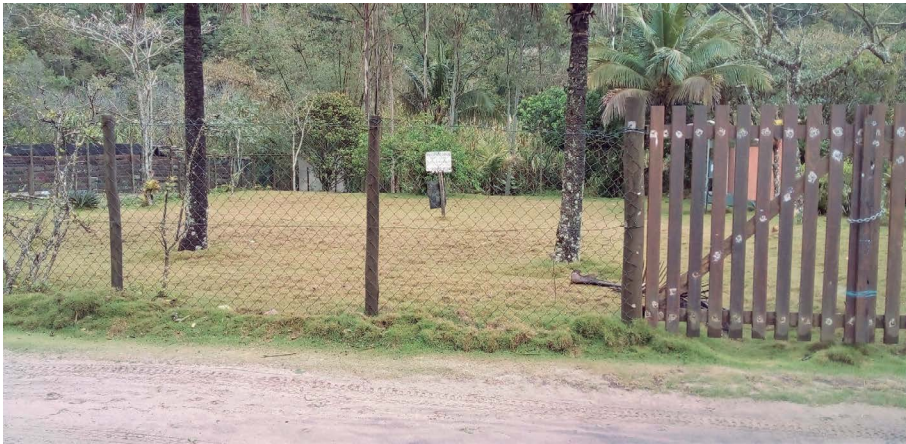
Figura 1 – Área cercada na Praia de Castelhanos. Na placa, lê-se: “Propriedade particular, proibida a entrada”.

A materialização de propriedades privadas - áreas cercadas às quais os comunitários têm acesso restrito - impacta no uso coletivo daquele território. Além da restrição no uso e na circulação do espaço, as casas de veraneio construídas são também alugadas por meio de plataformas digitais, promovendo a circulação e permanência de pessoas não locais nas comunidades e modificando a dinâmica da vida dos comunitários 9 .