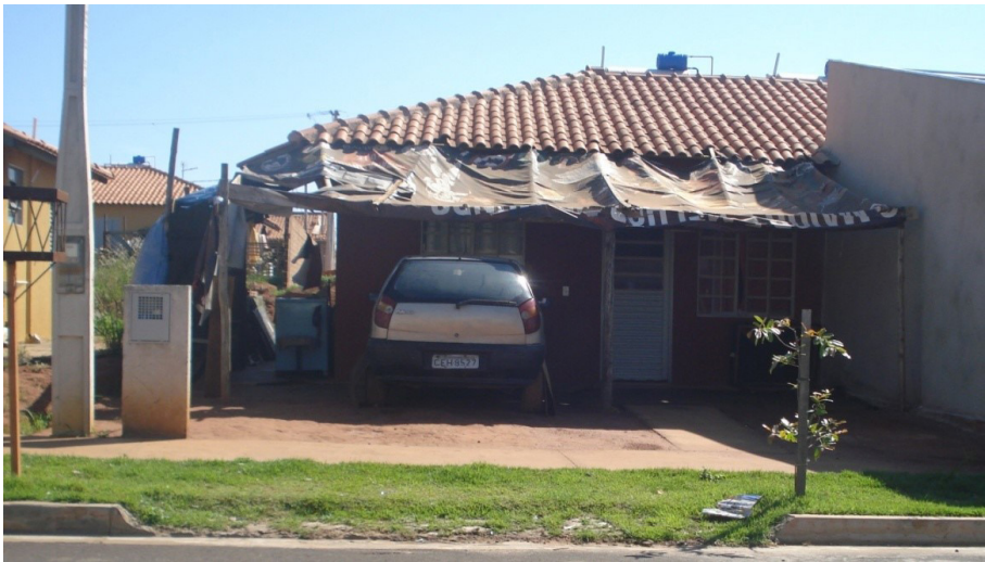
Figura 6 - Lona utilizada como cobertura para garagem, extensão e isolamento da área de serviço

Assim como as atividades comerciais, as transformações das casas, de uma forma geral, marcam de maneira profunda as mudanças na paisagem do bairro. Refletindo as condições financeiras e os gostos pessoais de seus moradores, a paisagem ganha novas tonalidades que a afastam de seu aspecto anterior de produção em série. Neste caso, ao refletir a dinâmica da sociedade e suas condições materiais, a paisagem pode ganhar tons dramáticos, como a garagem de lona, falta de muros separadores das casas – comprometendo a privacidade e a segurança –, roupas estendida voltadas para a rua, móveis que não couberam na casa acomodados pelo lado de fora etc. A Figura 6 evidencia bem a questão.