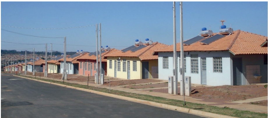
Figura 1 - Produção em série das unidades habitacionais – casas geminadas (2015)

Ainda como estratégia de barateamento da construção, empregam-se materiais de baixa qualidade, no limite do aceitável, a metragem de construção é sempre a mínima exigida pelas normas do programa, o projeto em inúmeras vezes é repetido, buscando economia de escala na produção, o número de casas contíguas é elevado ao limite, mesmo que para isso tenha que se utilizar como subterfúgio o “lançamento” de loteamentos e conjuntos habitacionais distintos um ao lado do outro. Essas características formam uma paisagem de produção industrial das moradias, da produção massificada em série e despersonalizada. Assim, é notória a produção funcional da moradia e da cidade. A Figura 1 representa tal característica da padronização e produção em série dos conjuntos habitacionais.