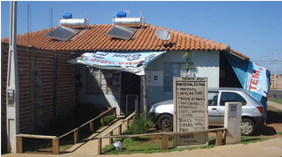
Figura 4 - Uso comercial no espaço da sala de estar