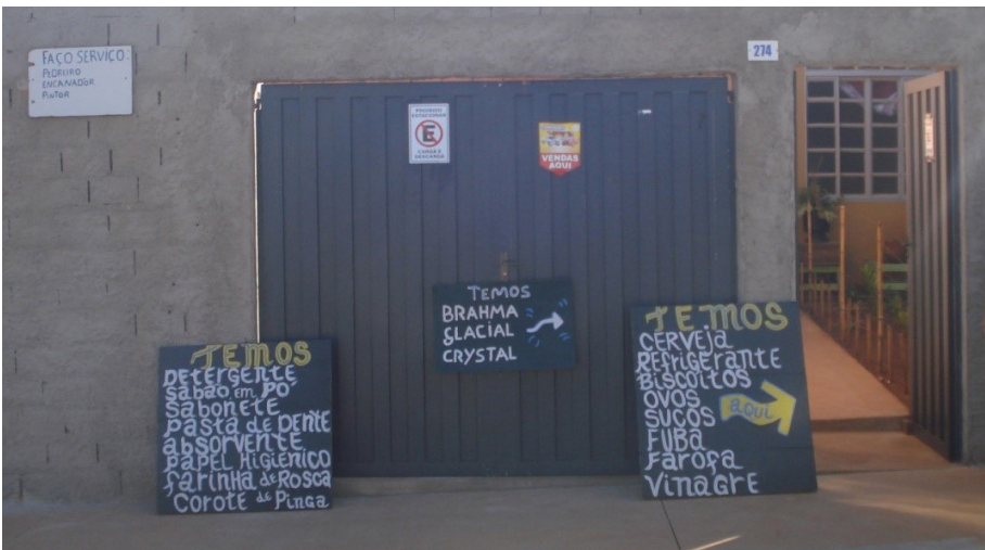
Figura 5 - Placas indicando produtos vendidos e serviços prestados