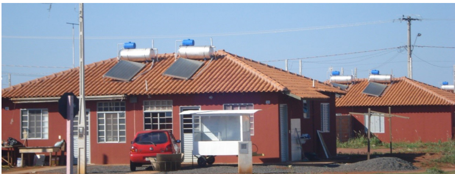
Figura 3 - Uso comercial no espaço da garagem

Todas estas transformações e usos marcam a paisagem de forma indelével e evidenciam as estruturas da produção desse espaço. É importante frisar que estes tipos de comércios denotam baixíssimos investimentos e uma velocidade muito lenta em sua reprodução (retorno do capital), porém, rápida o suficiente para auxiliar na subsistência cotidiana da família. As Figuras 3, 4 e 5 mostram algumas dessas características da paisagem.