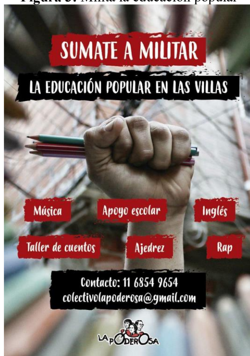
Figura 3: Militá la educación popular