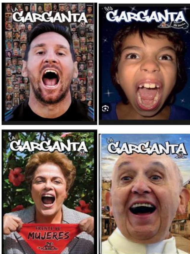
Figura 1: Diversas tapas de La Garganta