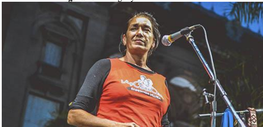
Figura 4: La Negra y el feminismo villero

Por último, destacamos la presencia de las casas de las mujeres y disidencias, que empezaron a ser abiertas en 2018, fruto del crecimiento del feminismo villero y del Frente de Géneros dentro de la organización: villa 21-24 y villa 31, ciudad de Buenos Aires; barrio Chalet, ciudad de Santa Fe; Casa de Los Pumitas, Rosario, provincia de Santa Fe; barrio de Yapeyú, ciudad de Córdoba; barrio Constitución, San Rafael, provincia de Mendoza.