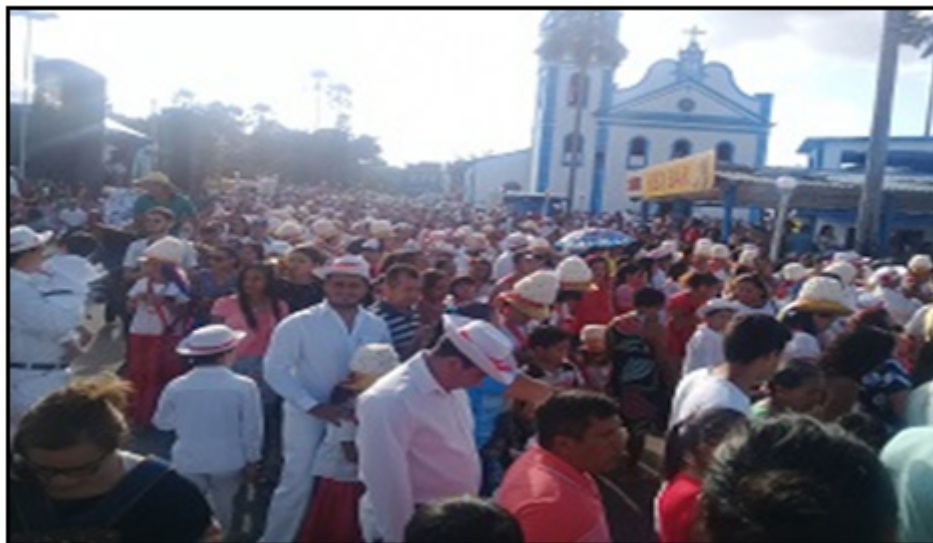
Figura 01- Largo de São Benedito. Saída da procissão em homenagem ao Glorioso São Benedito, Bragança, Pará, Brasil, realizada no dia 26 de dezembro de 2018. Ao fundo a Igreja de São Benedito, edificação do século XVIII, tombada pela Poder Público Municipal e Estadual