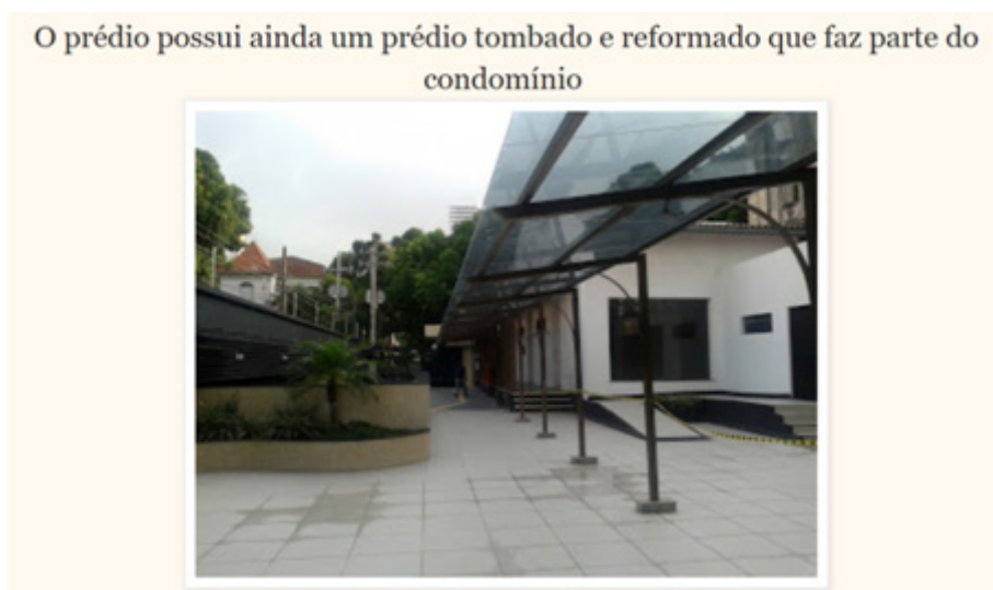
Figura 8: Divulgação do edifício Terrazos