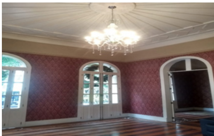
Figura 5: Parte interna do casarão do Edifício Terrazos

A aquisição e o processo de restauração do imóvel partiram do interesse da própria empresa responsável pela construção do edifício, momento em que a mesma restaurou o muro e as grades da parte externa do casarão 5 , bem como toda parte interna desse objeto espacial, como parede, piso, telhado e alguns móveis, além de restaurar toda parte externa do casarão juntamente com a escadaria ao lado (Figuras 5 e 6).