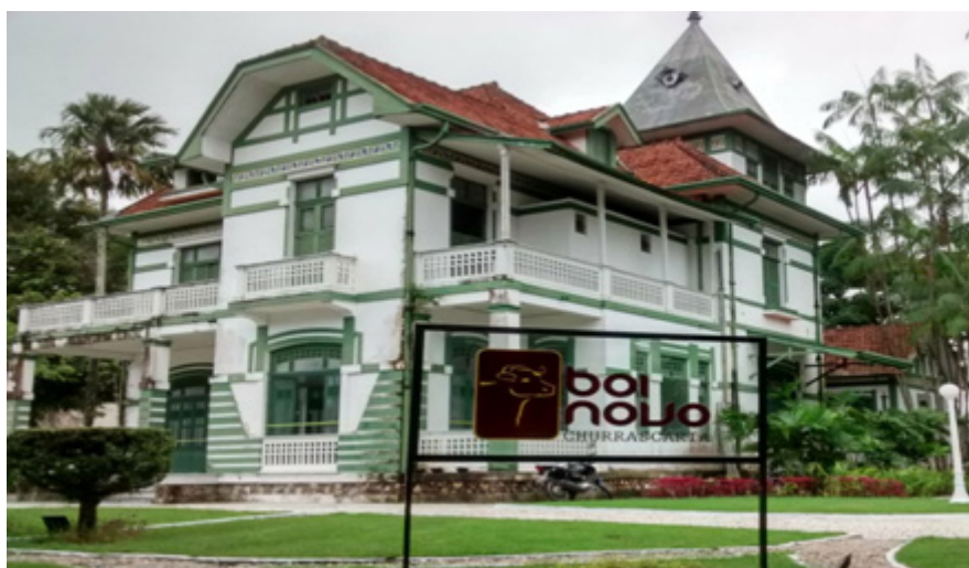
Figura 3: Palacete Passarinho

Percebe-se, então, que o Palacete Passarinho não é utilizado como um empecilho ao capital comercial, mas, sim, como atrativo para que o lugar receba mais consumidores. Paes-Luchiari (2005a, p. 97) destaca que o processo de refuncionalização é o que tem dado nova valorização ao patrimônio cultural e, neste caso, podemos identificar a valorização econômica de um bem patrimonial que é requisitado para atender a demanda de nova função, a qual, por sua vez, é destinada ao desenvolvimento econômico de uma empresa privada. Scifoni (2015, p. 211) afirma que a preservação do patrimônio contempla novos usos e possibilidades de implantação e projetos nos bens tombados; fato que pode ser observado no caso do Palacete Passarinho, que foi tombado no ano de 2004, pelo DPHAC, e possui uma função comercial.