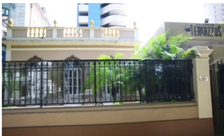
Figura 6: Parte externa do Edifício Terrazos