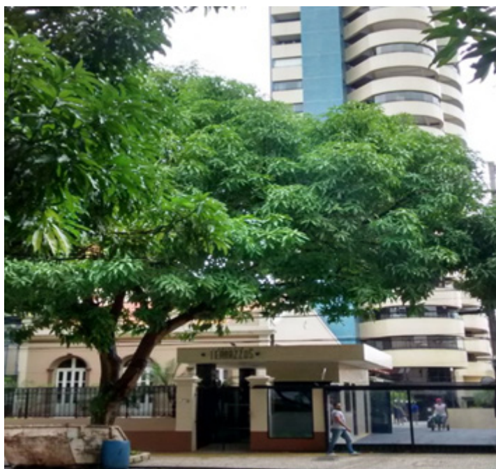
Figura 4: Edifício Terrazos

tendência dentro da política patrimonial. O caso do Edifício Terrazos é peculiar, haja vista que a construtora responsável pela obra adquiriu o casarão e incorporou ao edifício, sem haver a necessidade de destruí-lo ou derrubá-lo. Diferentemente do Palacete Passarinho, o edifício não é tombado pelo DPHAC, mas se encontra na área de tombamento do Parque da Residência. Para uma melhor compreensão da relação de negócio do Edifício Terrazos, será realizada uma abordagem acerca do agente do capital imobiliário, representado pela construtora e pelas corretoras de imóveis, bem como sobre os agentes consumidores desse espaço. Ademais, também será discutido o papel do Estado, representado pelo DPHAC.