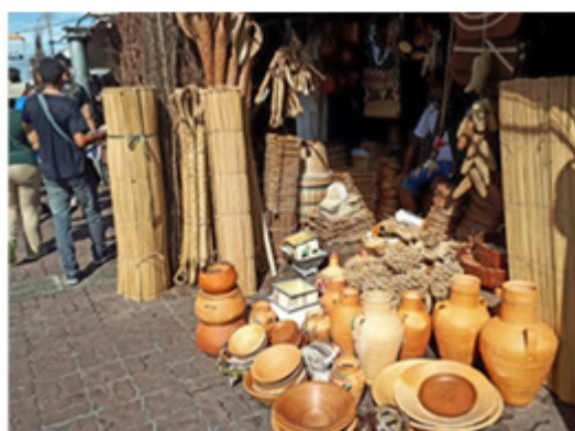
Figura 4: Barraca de produtos artesanais na feira do Ver-o-Peso