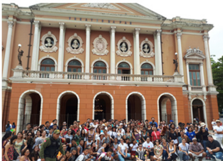
Figura 1: Participantes do Roteiro, em frente ao Teatro da Paz

O Roteiro da Belle Époque buscou contextualizar a formação socioespacial, em que, alguns bens patrimonializados estão inseridos e representam um período importante da expansão e modernização urbana da cidade. Com vistas a atrair investimentos econômicos e atender a elite local ascendente da época, o poder público, empreendeu um ambicioso projeto urbanístico em Belém, seguindo o modelo parisiense, construindo boulevards, cafés, lojas de importados franceses, cinemas e teatros, a exemplo, do Teatro da Paz (figura 01), ícone do período áureo da economia da borracha, construído há cento e quarenta e dois anos, no bairro da Campina, para atender aos interesses culturais da elite local, além, da construção de um crematório municipal, para fins de limpeza pública, localizado em uma área periférica, não urbanizada (TAVARES, 2008).