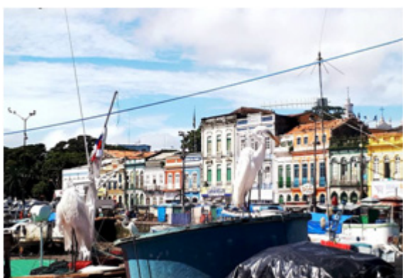
Figura 3: Visão do casario tombado no complexo do Ver-o-Peso

Nesse percurso, o Roteiro se desenvolveu de maneira interativa, onde foi possível dialogar com os sujeitos que há gerações, fazem e mantêm o Ver-o-Peso por mais de trezentos anos. Segundo esses sujeitos, o complexo movimenta aproximadamente cinco mil trabalhadores e trabalhadoras diariamente, dinamizando uma ampla rede de produtos tipicamente amazônicos, organizados em vinte e três setores, articulando centro e periferia, o urbano e o rural, do município de Belém e região do entorno.