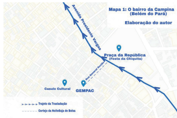
Mapa 01 – Bairro da Campina.