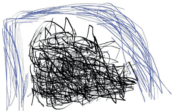
Figura 02 – O megazord segue pela Avenida Presidente Vargas, com seu corredor iluminado pelas luzes do Círio de Nazaré. Elaborada pelo autor (2020).

resistência meramente simbólica e momentânea? O ato final do evento, como anunciado, foi o cortejo rumo à Festa da Chiquita, na Praça da República, um trajeto de pouco menos de 500 metros. Com o fim das apresentações, porém, os presentes demoravam para se concentrar. Sarita tentou várias vezes convidá-los para se organizar, ao que poucos responderam. “Na hora de aplaudir todo mundo aplaude!”, ela reclamou.