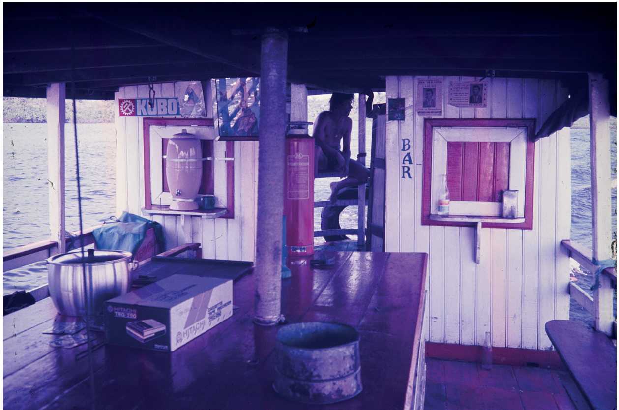
Belém Negativo Cor 1968