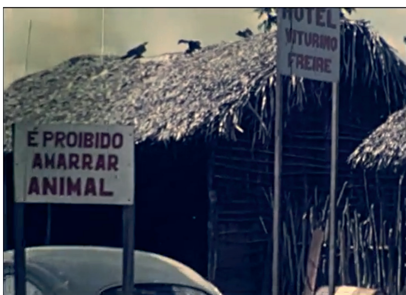
Belém Brasília Super 8 1973