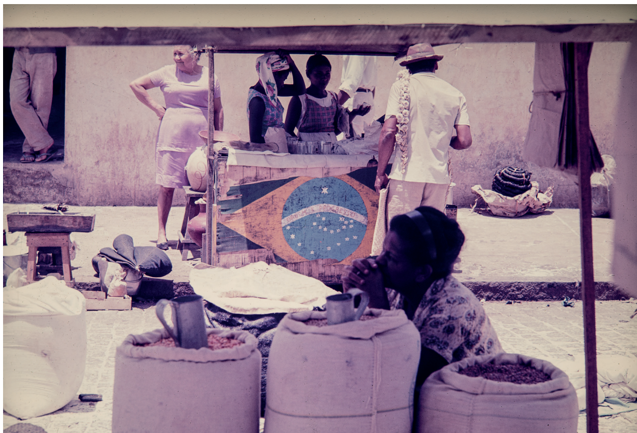
Bahia, feira Água de Meninos Slide Acervo Jorge Bodanzky IMS 1970