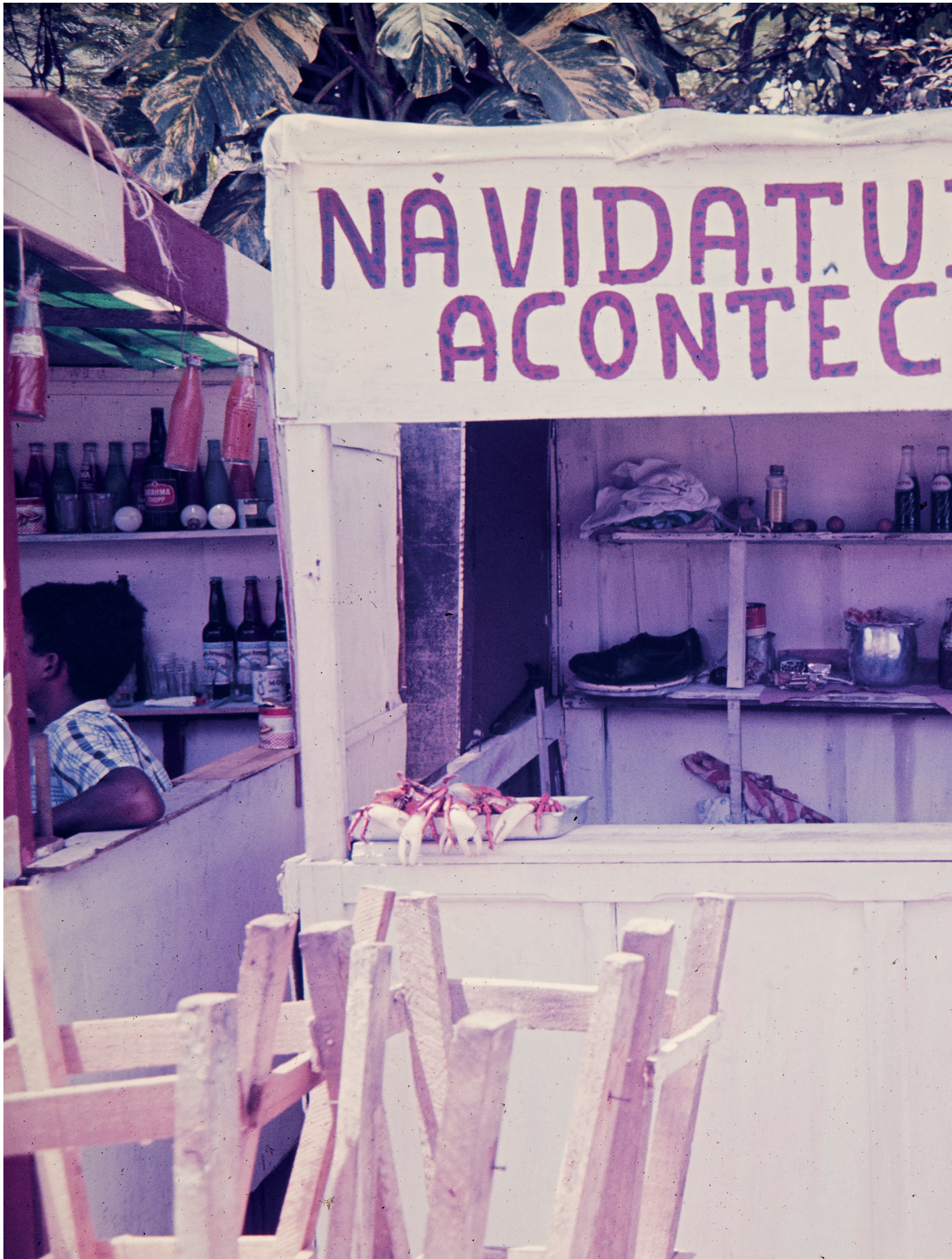
Bahia Negativo cor 1970