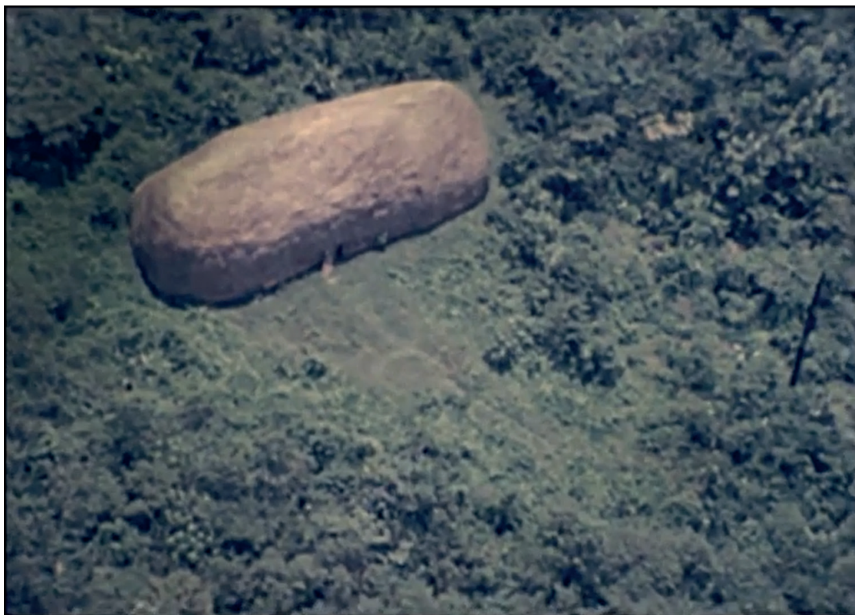
Aripuanã, Mato Grosso, maloca Cinta Larga ainda isolados Super 8 Acervo Jorge Bodanzky IMS 1973