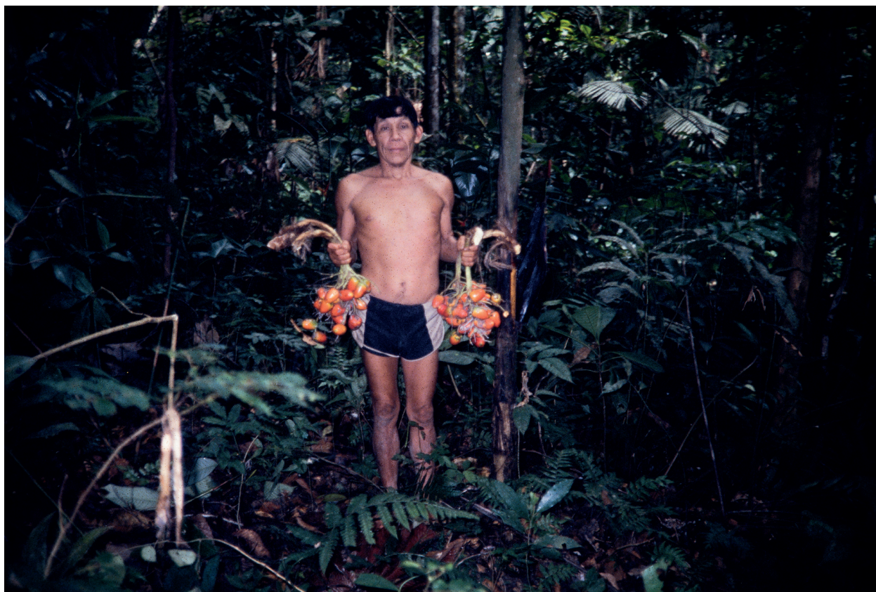
Yanomami, Pico da Neblina Slide 1984