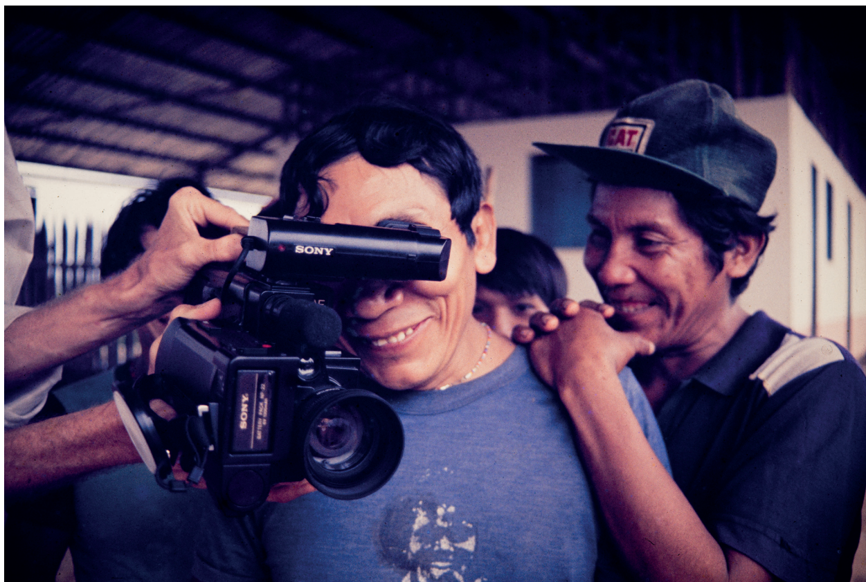
Indígenas Yanomami, Reserva Maturacá Video 8 Acervo Jorge Bodanzky IMS 1984