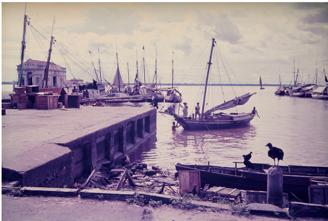
Mercado do Ver-o-Peso Negativo cor Acervo Jorge Bodanzky IMS 1973