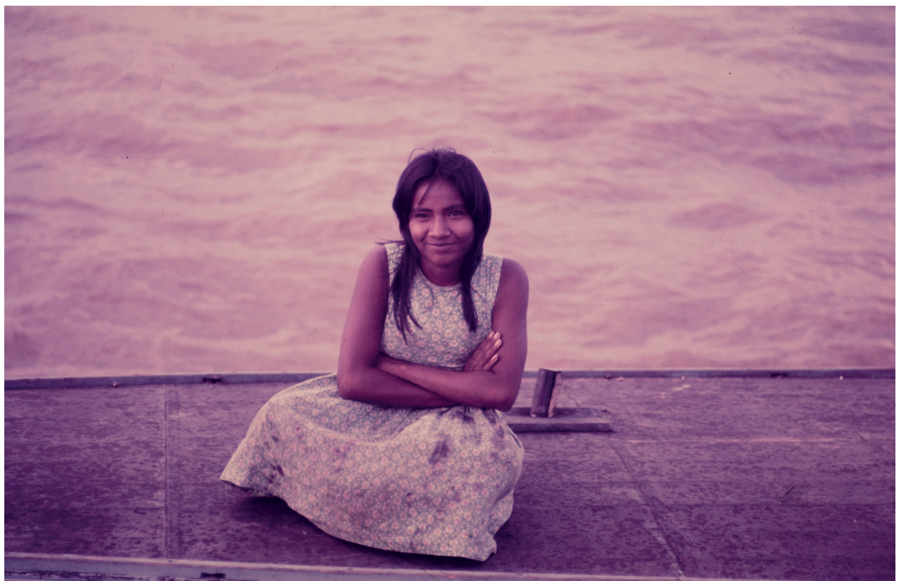
Edna Senna 1974