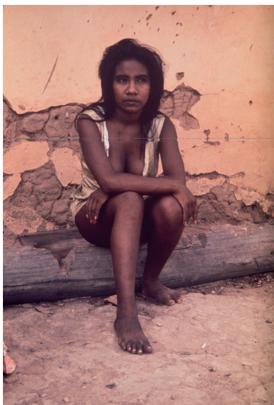
Transamazônica Negativo cor 1974