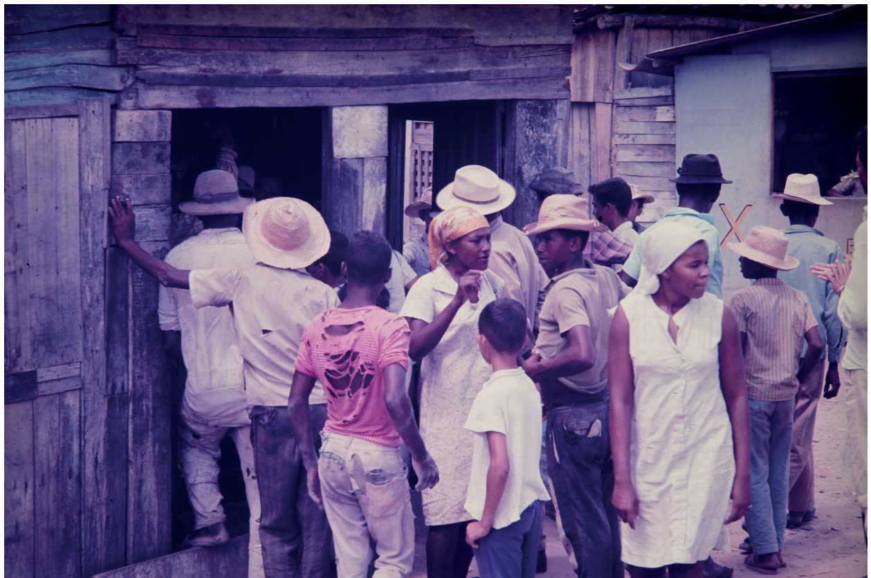
Bahia 1970