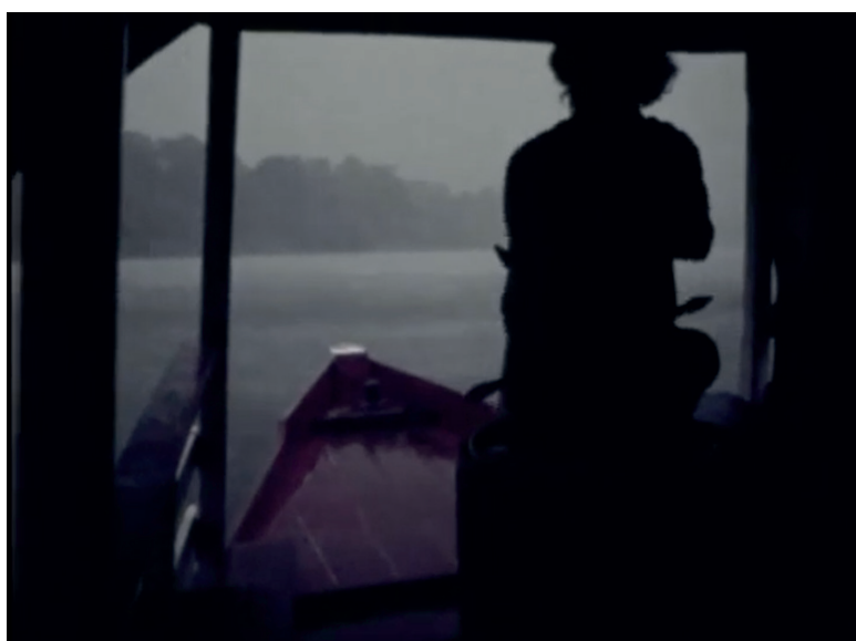
Rio Negro Super 8 1973