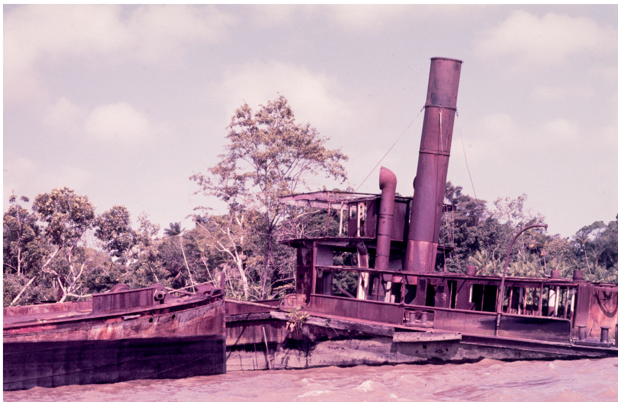
Edna na Transamazônica, cena final Iracema Negativo cor Acervo Jorge Bodanzky IMS 1974