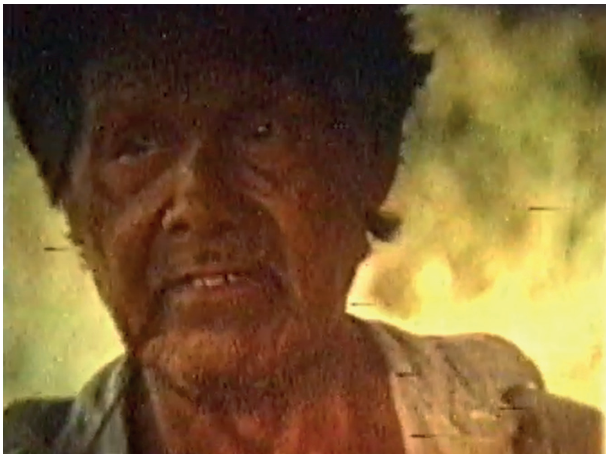
A Propósito de Tristes Trópicos, Caduveu Video 8 Acervo Jorge Bodanzky IMS 1990