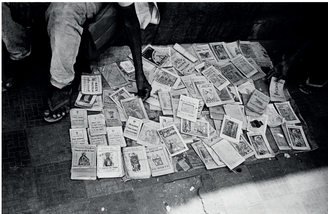
Bahia Negativo PB 1978