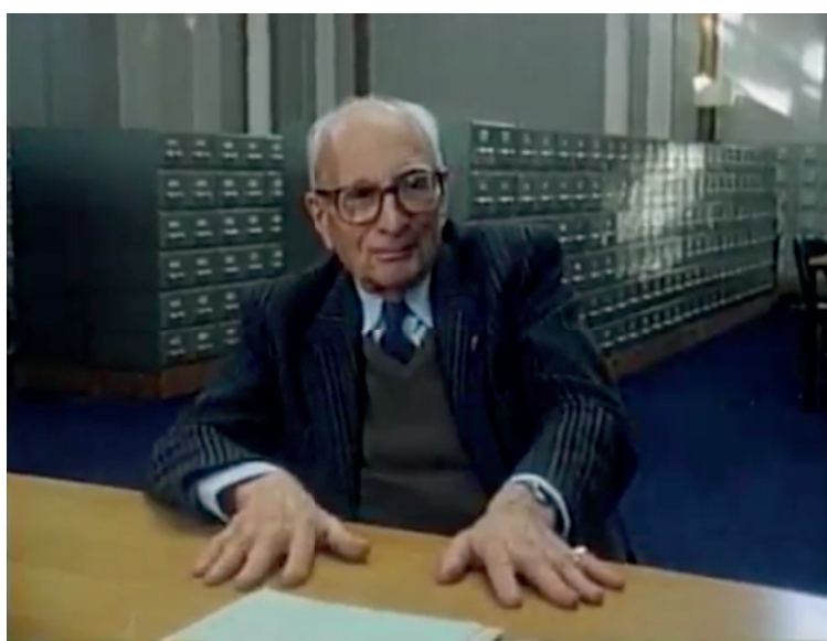
Levi Strauss e Caduveu Video 8 1990