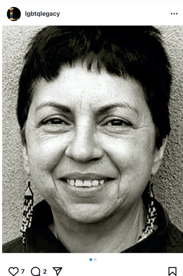
Figura 4 - Gloria Anzaldúa. Printscreen de post do Instagram.

4