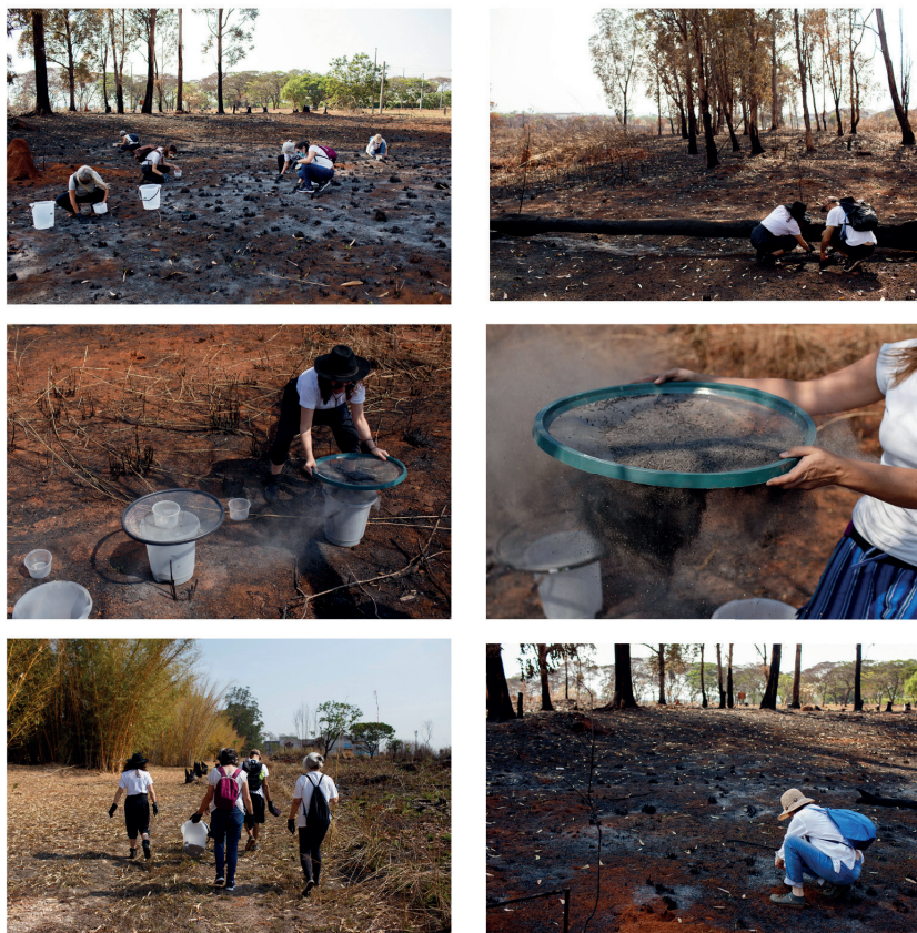
Figura 3 - Registros da ação Colheita Coletiva de Cinzas nos Jardins das Ruínas (2022).

Este é um texto aparentemente corriqueiro, que instrui sobre como agir diante de um incêndio em uma residência, mas que, ao ser transformado em poema, abriu nossos olhos para como podemos agir diante da destruição. Diante de um mundo em chamas, como devemos proceder? Rastejando, fechando portas, escapando, sem olhar para trás, sem retornar? Se o fogo procura espaço para queimar, como podemos ocupar esse espaço de forma a evitar que ele consuma tudo ao