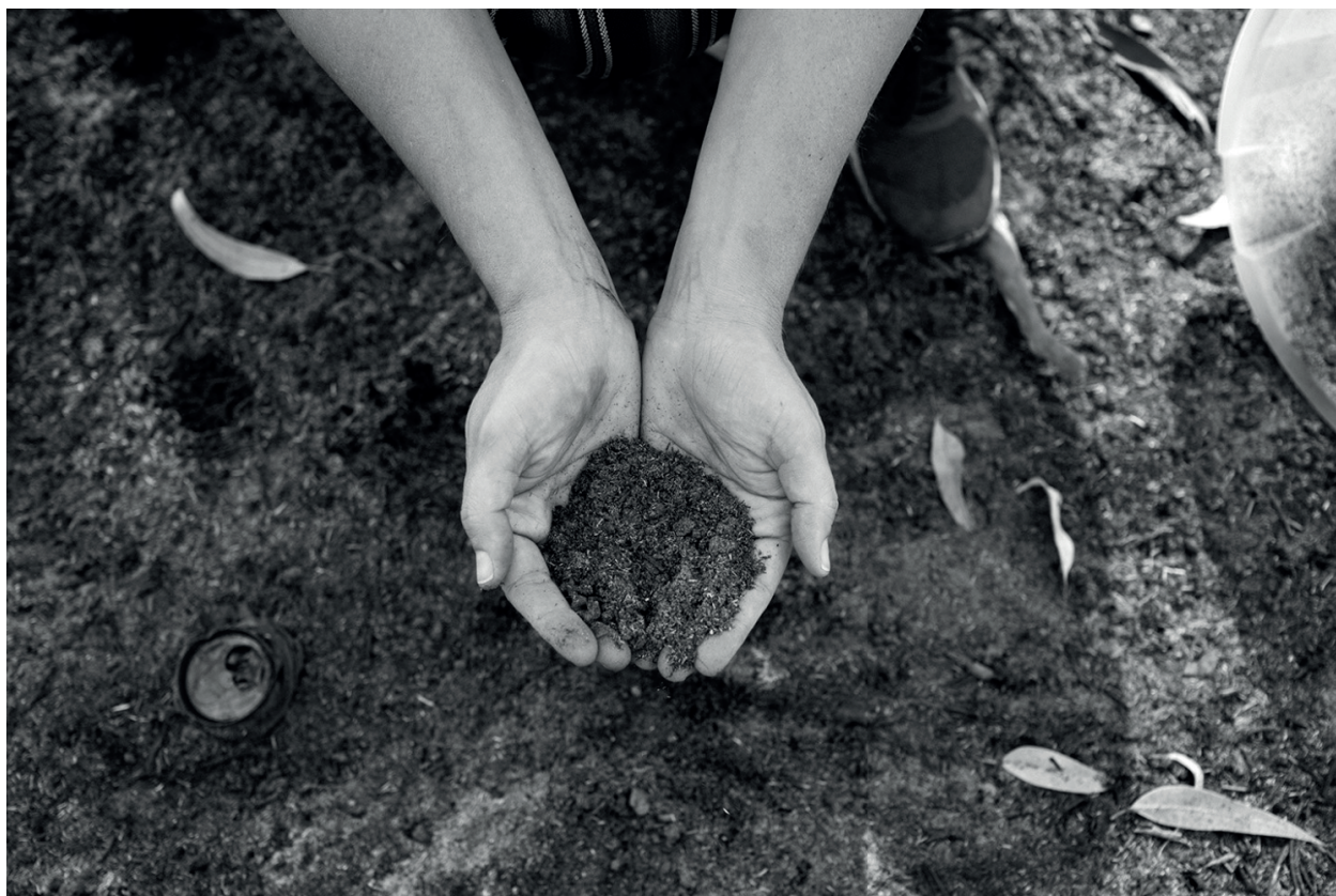
Figura 6 - Imagem de cinzas coletadas em áreas de queimadas da cidade (2022).

Yanomamis, onde as cinzas de um parente morto são ingeridas misturadas a um mingau de banana. Também são utilizadas em diversos rituais funerários no Oriente e no Ocidente. As cinzas são aplicadas como tempero na comida (conhecidas, por exemplo, como “sal do índio”), como adubo orgânico, em materiais industriais ou, no caso da cerâmica, como matéria-prima para compor massas e criar vidrados de cinzas, que decoram e impermeabilizam as peças.