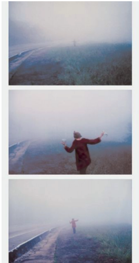
Figura 9 - A coleta da neblina , de Brígida Baltar (1996). 8