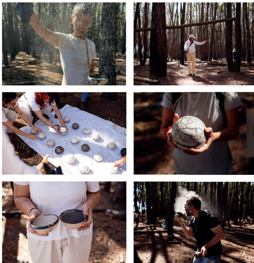
Figura 4 - Registros da ação Semente de Cinzas (2024).

Para essa ação, foram construídas vinte peças de cerâmica (Figura 5), que serviram como recipientes para as cinzas, que depois seriam dissipadas. As peças foram inspiradas no formato da flor sempre-viva, bastante comum no Cerrado. No entanto, para os participantes, o formato das peças lembrava urnas funerárias ou pequenos planetas. Para outros, a forma remetia à ideia de semente. Cada pessoa escolhia uma dessas peças (semente/urna/planeta) e caminhava pelo espaço de monocultura, semeando as cinzas à sua maneira – soprando, usando as pontas dos dedos para espalhá-las aos poucos ou jogando-as para o alto de uma vez.