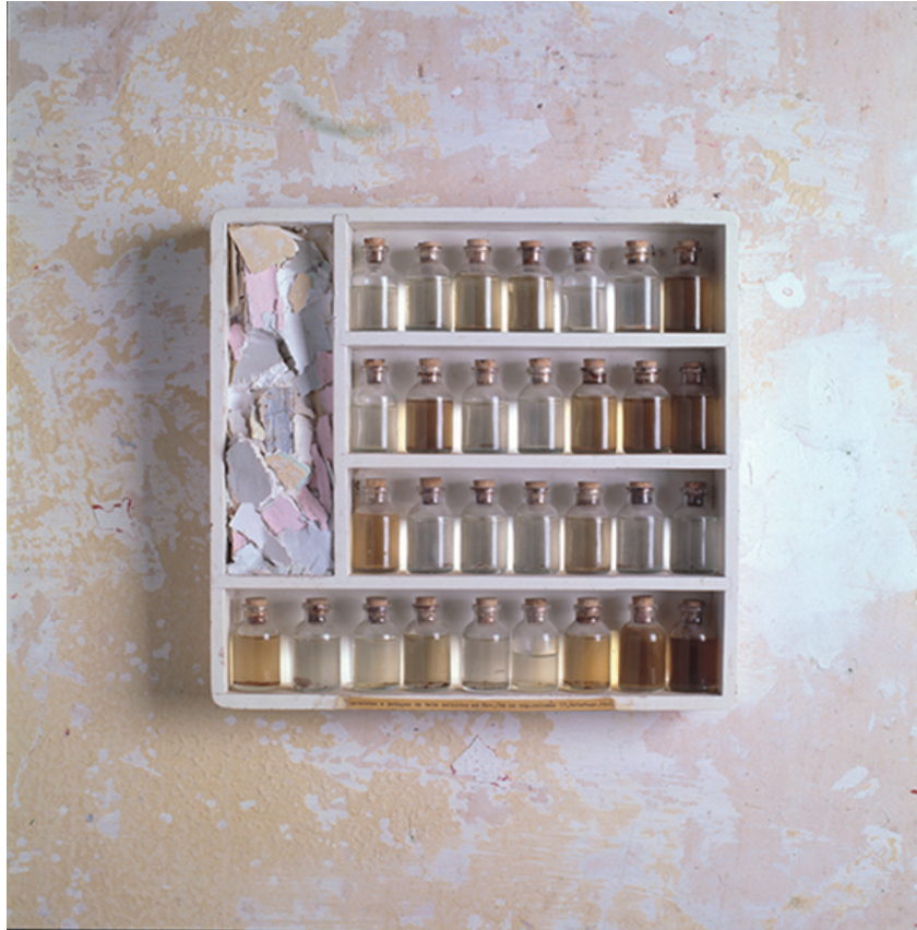
Figura 8 - A coleta de goteiras , de Brígida Baltar (1994). Vidro, água de goteiras, casca de tinta e estante de madeira, 33,5 x 35 x 5 cm. 7