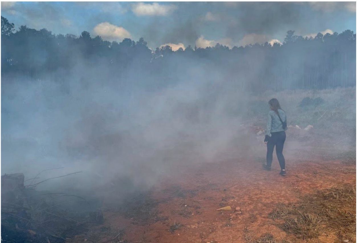
Figura 1 - Dentro do nevoeiro (2024). Fotografia de ação de caminhada em área de mata sendo incendiada.

Segundo Wisnik, dentro do nevoeiro contemporâneo estaríamos expostos permanentemente a um estado de vigília diante de uma luz intensa e difusa, como no clarão de uma névoa cerrada. Contudo, mesmo permeados pela baixa definição das nuvens de capitais, pela falta de nitidez e pelo excesso de