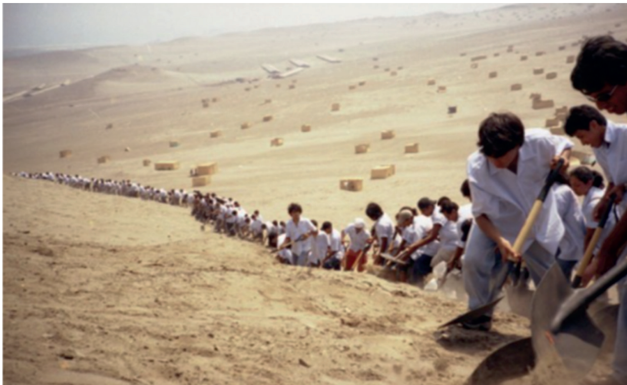
Figura 7 - Cuando la fe mueve montañas , de Francis Alÿs (2002).