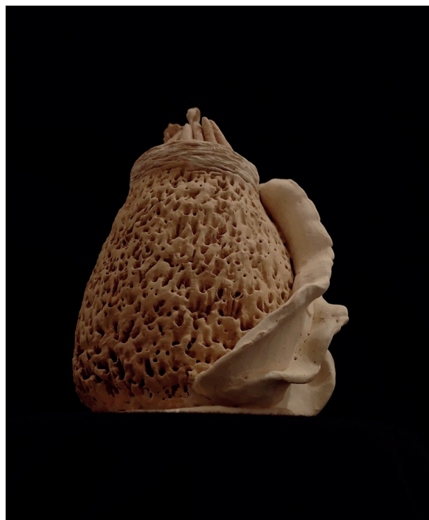
Figura 5 - EVO 05 (2023), Dannah Cortat Simoneli, 9x12cm. Peso 311g. Técnica pote de aperto com estrutura de papel, placa e pequenos roletes.

Na peça final, denominada EVO 05 , buscou-se desenvolver novamente a concepção de vazio, deixando pouca informação na composição de seus elementos. Em sua boca, foram acrescentados detalhes de roletes ocios com pontas abertas. As texturas no corpo da peça começaram de maneira aleatória, para depois seguir uma direção específica, aplicando a ponta seca em um movimento de apunhalar de cima para baixo. A base foi feita de placa e optou-se por equilibrar a forma da escultura com duas placas adjacentes de roletes achatados, formando uma espécie de onda que se estende da ponta até a base, criando um movimento em curva.