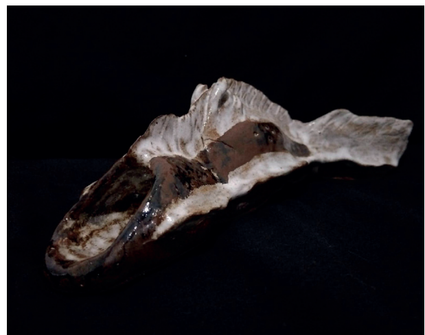
Figura 2 - EVO 02 (2022), Dannah Cortat Simoneli, 26x10cm. Peso 465g. Técnica de bloco único com roletes. Imagem de Bruna Cortat Simoneli.

Na segunda peça ( EVO 02 ) modelou-se a partir de um bloco único de argila, iniciando em uma configuração cilíndrica. As barbatanas dorsais e abas laterais foram adicionadas com roletes achatados nas pontas dos dedos, adicionando texturas por meio de riscos da ponta seca. Foi experimentada a utilização de um pequeno boleador para detalhes mínimos em suas laterais, e adicionando rolinhos cavados (com a inserção de um palito) em uma área de sua dorsal.