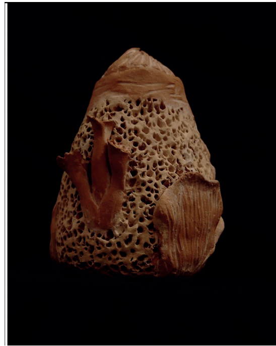
Figura 3 - EVO 03 (2023), Dannah Cortat Simoneli, 7x12cm. Peso 162g. Cerâmica com esmalte. Técnica de placas com estrutura de papel e pequenos roletes.

Ao criar a terceira peça da série Quimeras ( EVO 03 ), voltou-se à forma inicial, com a ponta composta por diversos roletes pequenos, desta vez voltada para cima centralizada. Em EVO 03 , buscou-se experimentar mais o conceito de “vazio” da forma, mantendo quase toda a sua superfície com uma única textura (as perfurações de aspecto poroso), e “equilibrando” a composição adicionando um pedaço de placa de argila de bordas arredondadas e curvilíneas em uma de suas laterais; além de um outro pedaço menor com a marca de uma ferramenta estriada ao seu lado. No lado oposto, foram colocados três pequenos roletes ocos com a ponta mais aberta e texturizada com um palito.