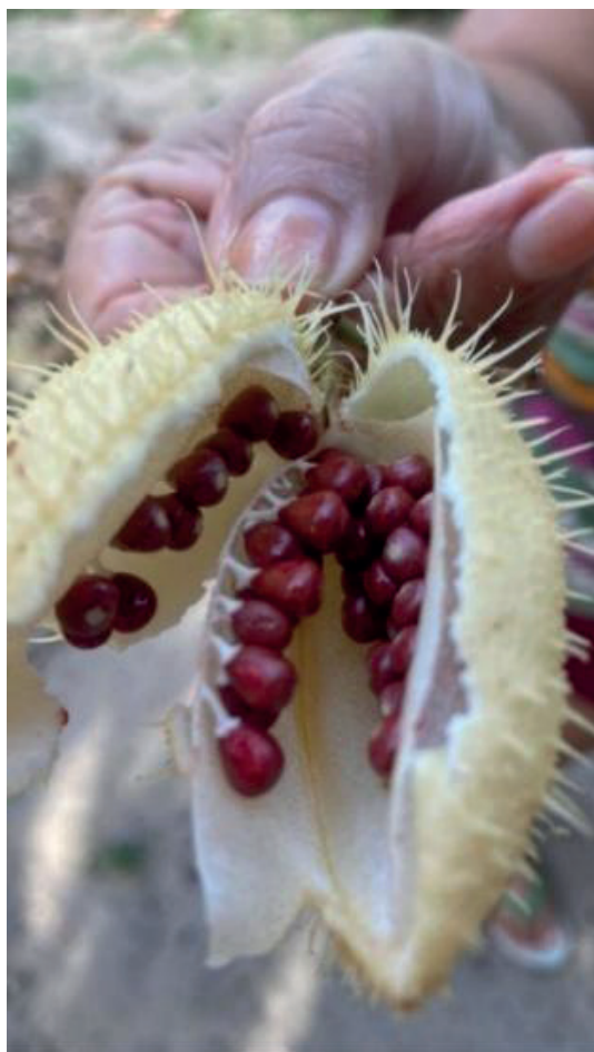
Figura 1 - Fruto do urucum (2023). Dimensões: 828 x 1472 pixels. 14