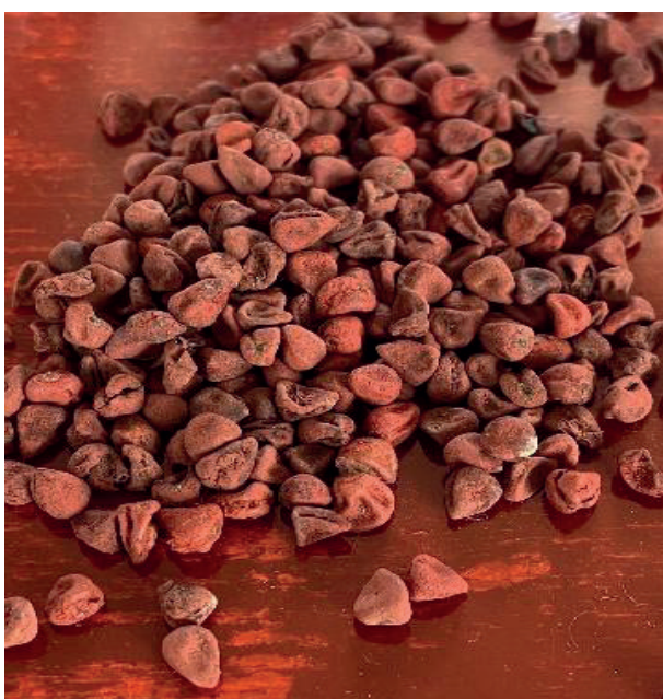
Figura 2 - Sementes secas de urucum (2021). Dimensões: 1080 x 1346 pixels. 15

Assim como outros frutos da natureza, o urucum passou a ser observado como interessante objeto de comercialização graças às suas propriedades medicinais, alimentícias e coloríficas. Dessa forma, dentro da máquina antropocêntrica, o urucum é resumido à sua funcionalidade; e a consequente capitalização de seus compostos orgânicos gera vastos lucros em escalas industriais, farmacêuticas, alimentícias e têxteis.