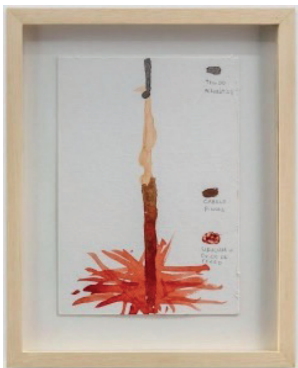
Figura 4 - Estudos para performance 01 (2023). Aquarela em papel algodão de Luciana Magno. Dimensão: 19,50 x 14 cm. 17

Como observado nas figuras anteriores, em suas experimentações Magno vai além de esquadrihar as possibilidades de meros “usos” industriais da planta para cumprir certos “propósitos” esvaziados. Em Estudos para performance 01 , nota-se que em sua pesquisa poética Luciana busca estudar os cenários possíveis para “tornar-se com” o urucum: os estudos de sua pesquisa desaguam em produções visuais que prezam por visualidades que comunicam suas experiências pessoais com o bioma: intimidades, simbioses. No que tange à representação do urucum em suas obras, Luciana preza pelo “nós”.