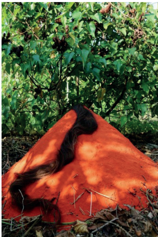
Figura 9 - Uatumã , de Luciana Magno (2023). Pigmento mineral sob papel de algodão. Dimensão: 45 x 30 cm. 14

Visualmente, em Uatumã , Luciana Magno - aqui simbolizada por seus longos cabelos - aos pés de um urucuzeiro, sobre folhagens secas e galhos, a artista mescla a sua figura com um amontoado de colorau formando figurativamente uma espécie de "vulcão", como Luciana descreve. Em sua intencionalidade poética, os cabelos descem serpenteando o pequeno monte vermelho, com a premissa visual do magma vulcânico. A visualidade da performance foi estudada anteriormente pela artista em ensaios de aquarela sobre papel algodão, como visto na imagem da Figura 10.