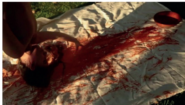
Figura 6 - Uruku - 4º ato, de Luciana Magno, 2025. Captura de vídeo. Dimensões 1920 x 1080 pixels.