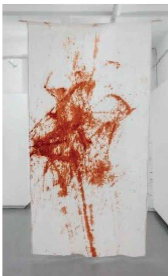
Figura 7 - Uruku 2 , de Luciana Magno (2023). Pigmento de urucum sob linho de algodão. Dimensões: 300 x 141 cm.