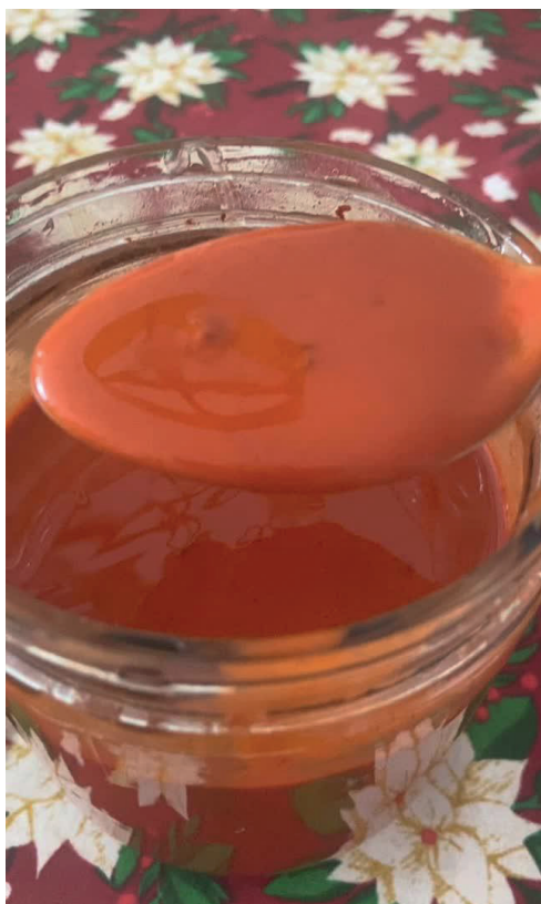
Figura 3 - Pigmento natural de urucum produzido pela artista (2023). Captura de vídeo. Dimensões 640 x 1136 pixels. 16