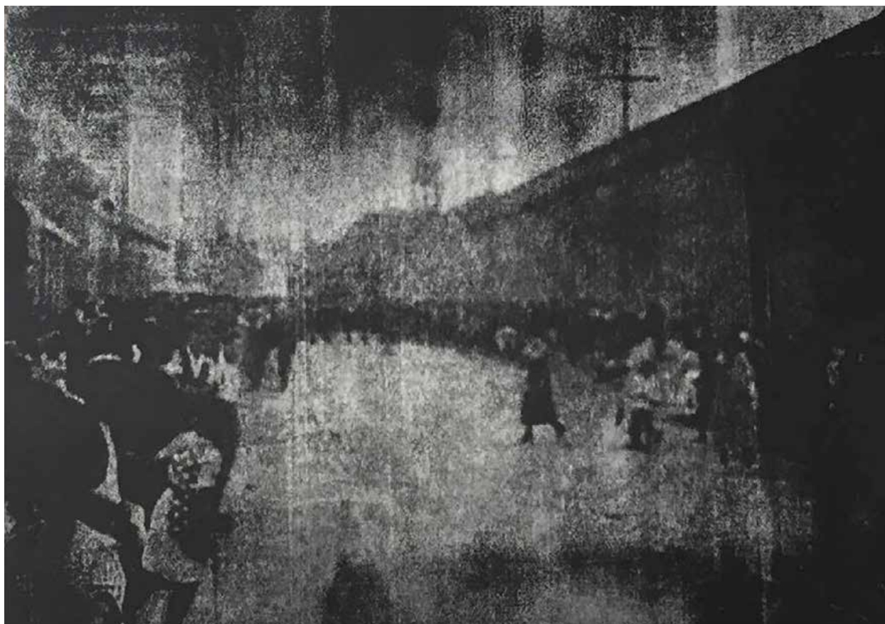
Figura 7 – Fotogravura que abre a exposição. Sou aquela mulher do canto esquerdo do quadro.

semana trágica: a greve geral anarquista de 1917. São Paulo: Museu da Imigração, 1977.