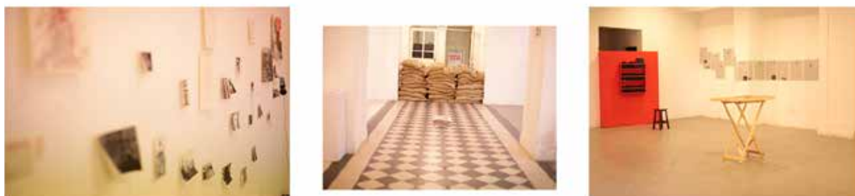
Figura 1 – Exposição Arquivo 17 .

pesquisadora é a própria artista da ação, mas quem convoca é a narradora construída: a Mulher do Canto Esquerdo do Quadro, que é o gatilho da montagem e da construção espacial, e nasce do punctum .