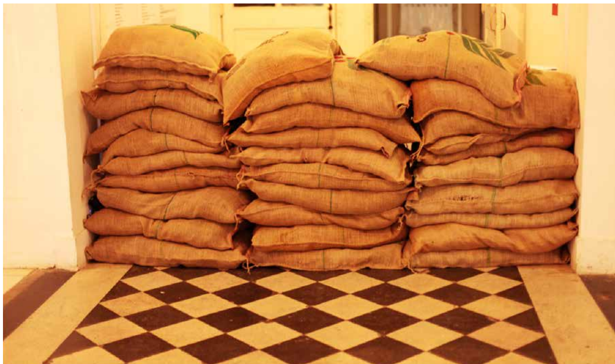
Figura 2 – Site specific Arrimo–Barricada. Barricada é uma estratégia anarquista, arrimo é uma homenagem às mulheres trabalhadoras da indústria da sacaria, que sustentavam suas casas e foram responsáveis por um motim silencioso. Alargaram as pontas das sacas de café em uma ação contrária aos barões e aos industriais do século passado.

do Araçá. Era um cortejo–manifestação pela morte de José Martínez, sapateiro morto pela polícia. Era a Greve Geral de 1917. Na época São Paulo tinha 550 mil habitantes, e no dia 12 de julho amanheceu sem pão e sem transportes; muitas camadas de trabalhadores aderiram ao movimento. A greve se manteve até 16 de julho e teve participação de 100 mil trabalhadores, e outros eventos tomaram conta da cidade, como saques a mercados e comícios. Um dos pontos que a pesquisa de Christina Lopreato destaca é a solidariedade entre os grevistas.