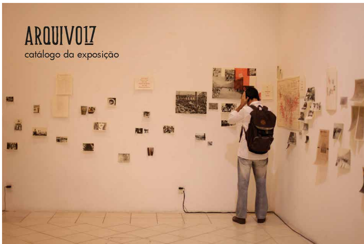
Figura 3 – Para acessar todo o conteúdo do catálogo, a partir do seguinte endereço: https://issuu.com/fernandagrigin/docs/catalogo_certo_a17__6_

do movimento. Na exposição, ela se repete três vezes: sozinha como imagem estática; em montagem com outras imagens no cartaz; e, por fim, no vídeo.