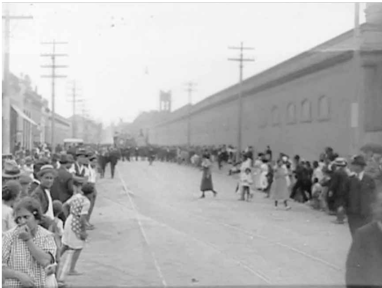
Figura 4 – Sou aquela mulher do canto esquerdo do quadro.

(2013), a historiografia feminista e queer possui uma preocupação de descobrir o que foi esquecido ou reprimido, bem como de apontar a economia da visibilidade em que o arquivo é predicado. Ao falar de trabalhos feministas, entre eles o arquivo proposto por Zoe Leonard, Zapperi diz que esses trabalhos são investigações sobre a formação de conhecimento histórico, mas seus usos como arquivo, como matéria visual, também abrem possibilidades de imaginar temporalidades feministas.