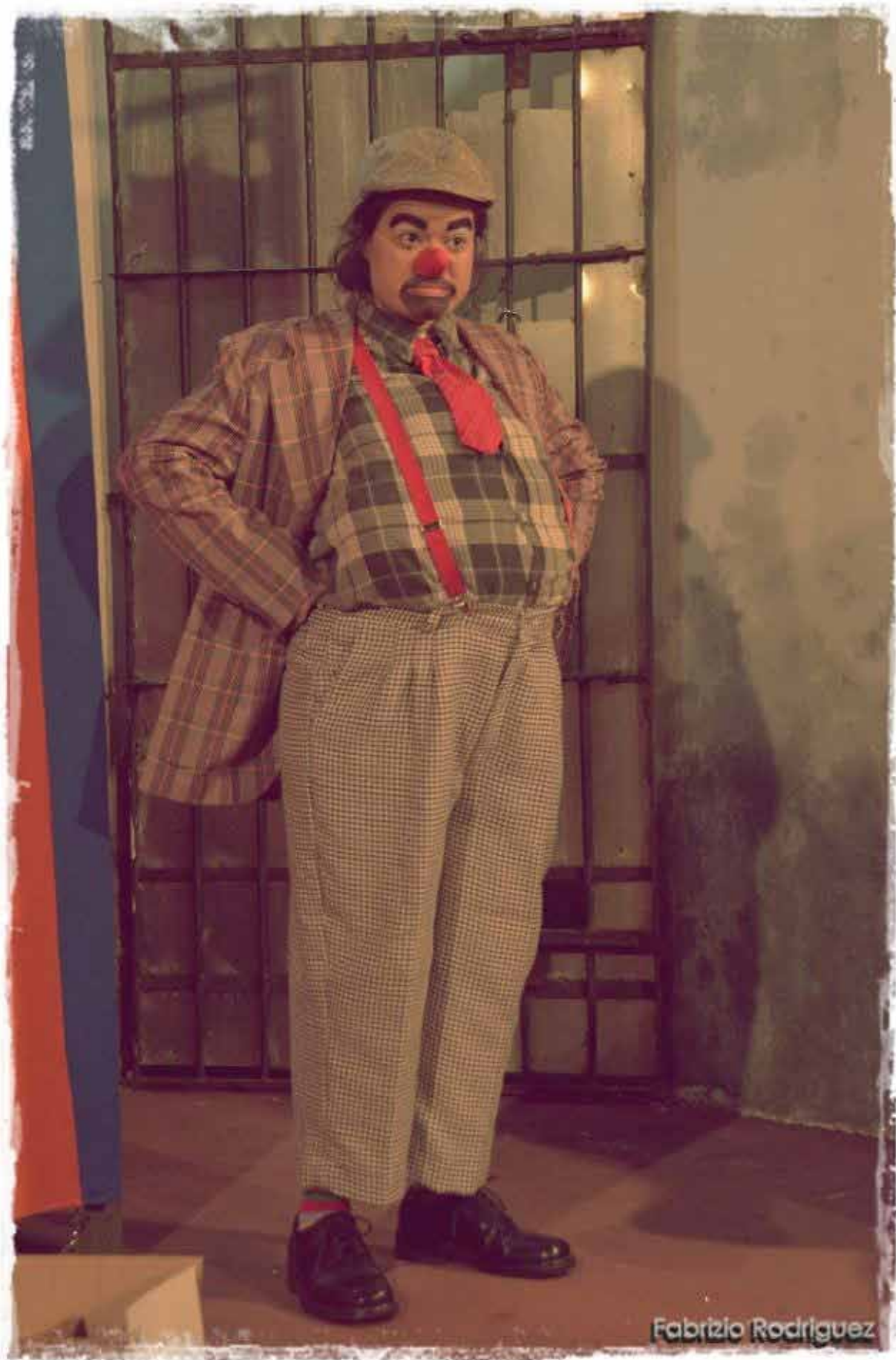
Figura 3 – Palhaço Uisquisito.