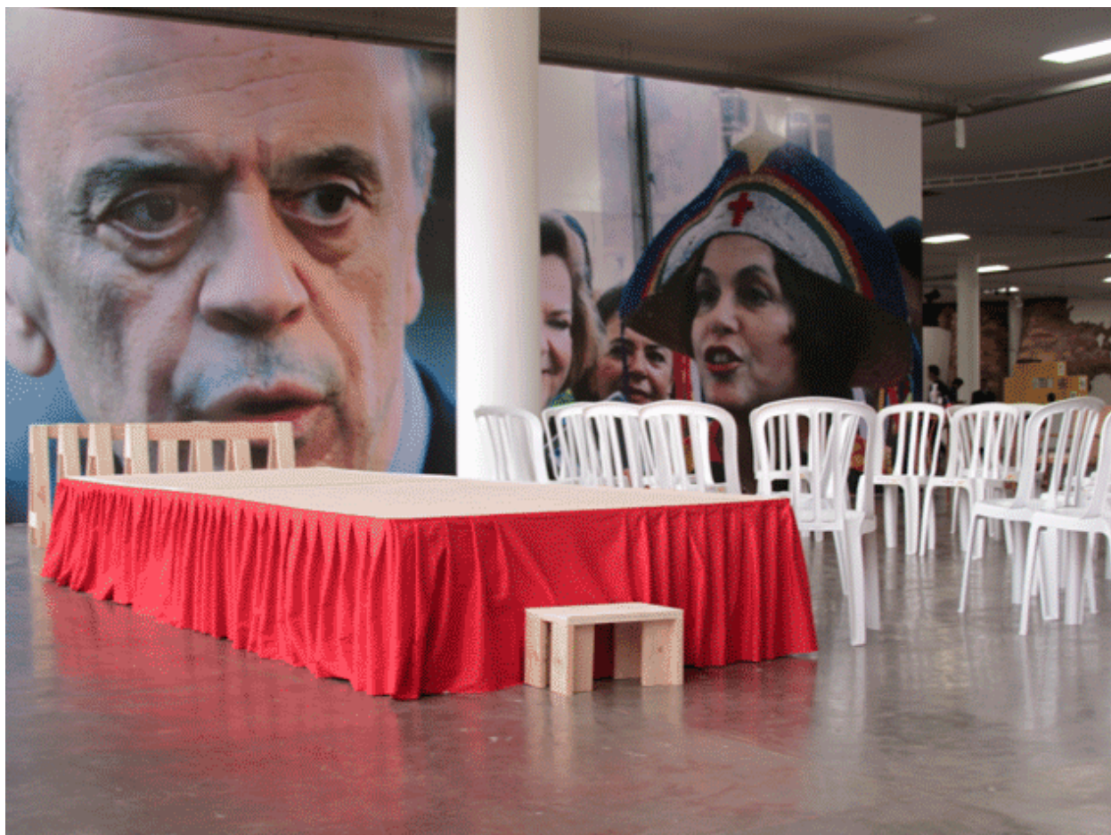
Figura 6 – Roberto Jacoby, El Alma Nunca Piensa Sin Imagen , (fragmento), 29ª Bienal de São Paulo 2010.

La obra aceptada en la Bienal de San Pablo en 2010, llamada El alma nunca piensa sin imagen , tuvo como antecedente dos rechazos sucesivos de los curadores que lo habían invitado. Inicialmente la propuesta se llamó Unidad Básica y su objetivo era articular una frontera entre Arte y Política a través del cine y el site specific , problema central de la Bienal en esa edición. En la obra finalmente aceptada, Jacoby sigue el impulso de los intelectuales, poetas y artistas que formaban parte de la llamada Brigada Argentina por Dilma, con el objetivo de canalizar los efectos de la intervención en favor del Partido de los Trabajadores y la candidatura de Dilma Rousseff. La acción de Jacoby consistió en mandar en el lugar de la obra inexistente dos fotografías, una de Dilma y otra de Serra tituladas bajo la fórmula: “El alma nunca piensa sin imagen”. La intervención ocurrió durante el período del ballottage de las elecciones como parte de una propaganda política que produjo un vértigo en la propia Bienal.