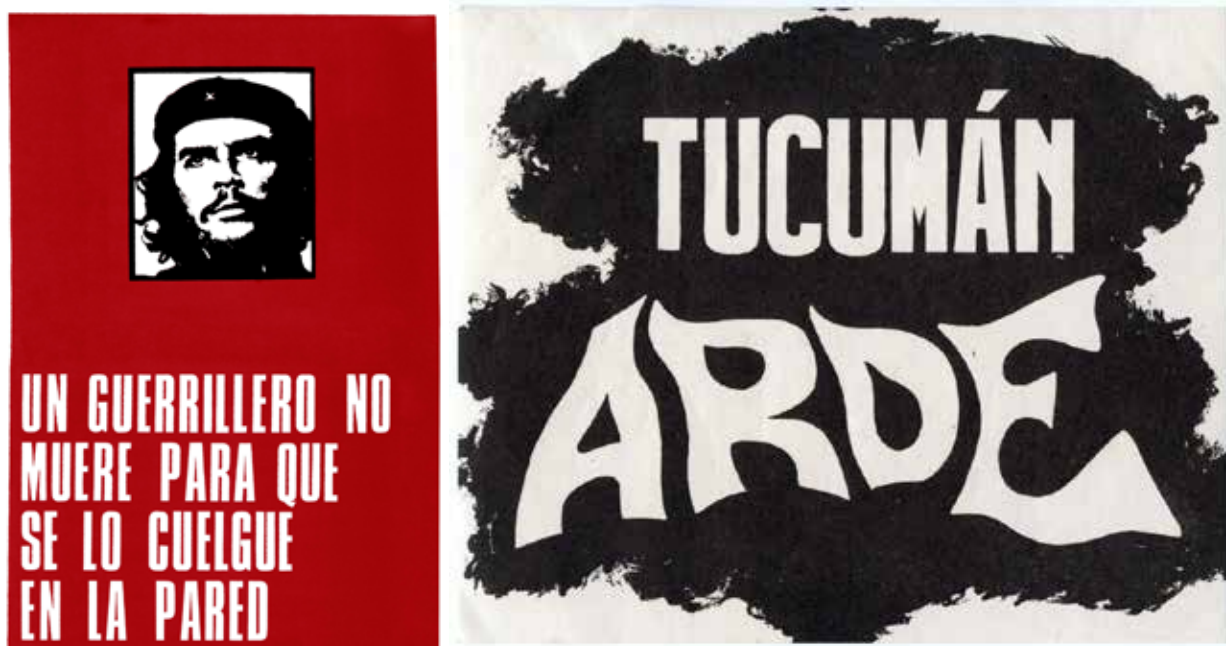
Figura 7 – Roberto Jacoby, Un Guerrillero No Muere Para Que Se Lo Cuelgue En La Pared (Serigrafía), 1969 / Tucumán Arde (acción colectiva – investigación, campaña y exposición), 1968

después de una protesta o a “Un guerrillero no muere para que se lo cuelgue en la pared” con la imagen del Che en el momento de su muerte. Las fórmulas de Jacoby problematizan la imagen desde la cultura folk, porque las imágenes nunca sostienen un programa político aunque no dejemos de votar un semblante o una consigna. Las imágenes son personalizadas para Jacoby como imaginéras o espectáculos sin ideas que hunden sus raíces en el sentir ciego de las pasiones de odio o de la potencia de la alegría colectiva de la fiesta, para cargarse entonces de una tendencia de sentido.