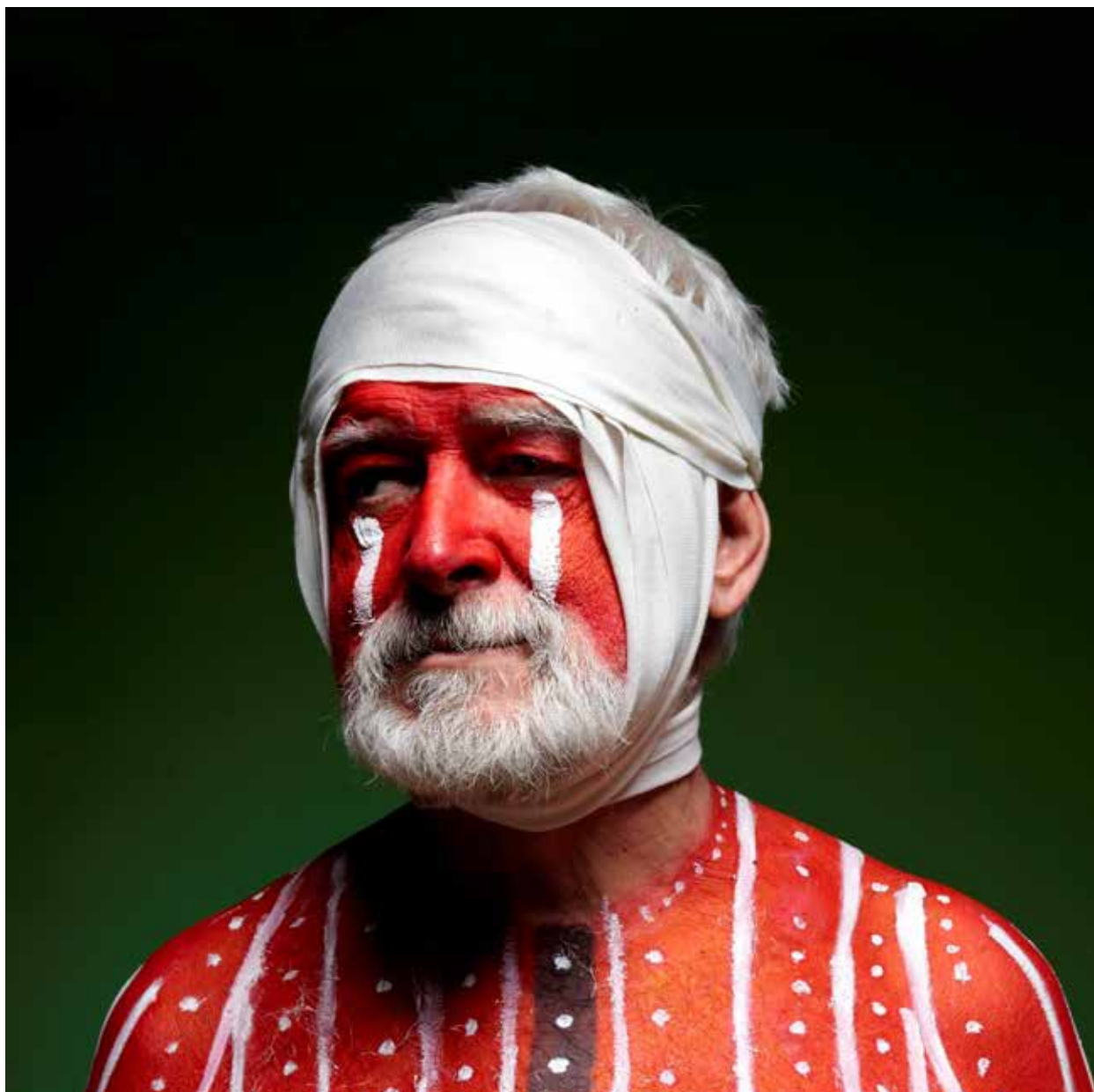
Figura 1 – Juna Carlos Romero, Serie Selkman (yo/el otro), VII, Infografía, 2010.

considerada por muchos una tarea innecesaria porque en ella el objeto mismo no llega a la existencia ni insiste como fin de los procesos de invención. Sin embargo instaura y compone un plano de sentido y un destino existencial.