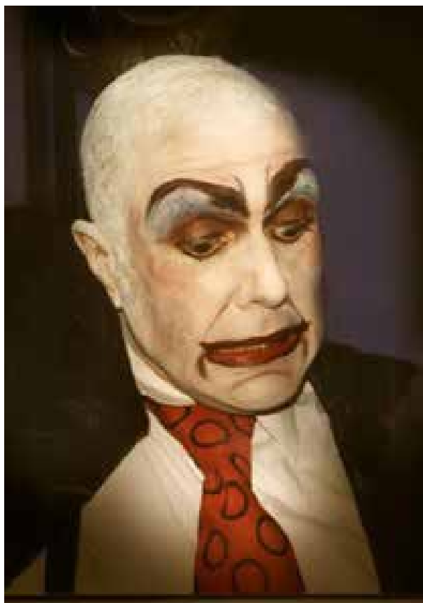
Figura 5 – Roberto Jacoby, No Soy un Cown, Instalación (fragmento), seis pequeñas fotos iluminadas levemente. Acervo: Colección particular, 2001.

Diego Tatián se pregunta en Contra Córdoba. Historias mínimas (2016) 6 quién ha financiado el arte de vanguardia a mediados de los años 60 en la Argentina. Pregunta crucial para indagar una performance declarativa de los cuerpos populares en un clima cultural de la mítica Córdoba. Entre 1962 y 1966, en sus tres ediciones, las Bienales Kaiser con sede en la ciudad, fueron financiadas por las Industrias Kaiser Argentina. Industria automotriz que recorrió los gobiernos de Perón, Frondizi e Illia impulsada por capitales estadounidenses que buscaban de manera expresa el desarrollo de la Alianza para el Progreso en América Latina, cuyo objetivo declarado es el impulso del capitalismo para contener el comunismo en la región.