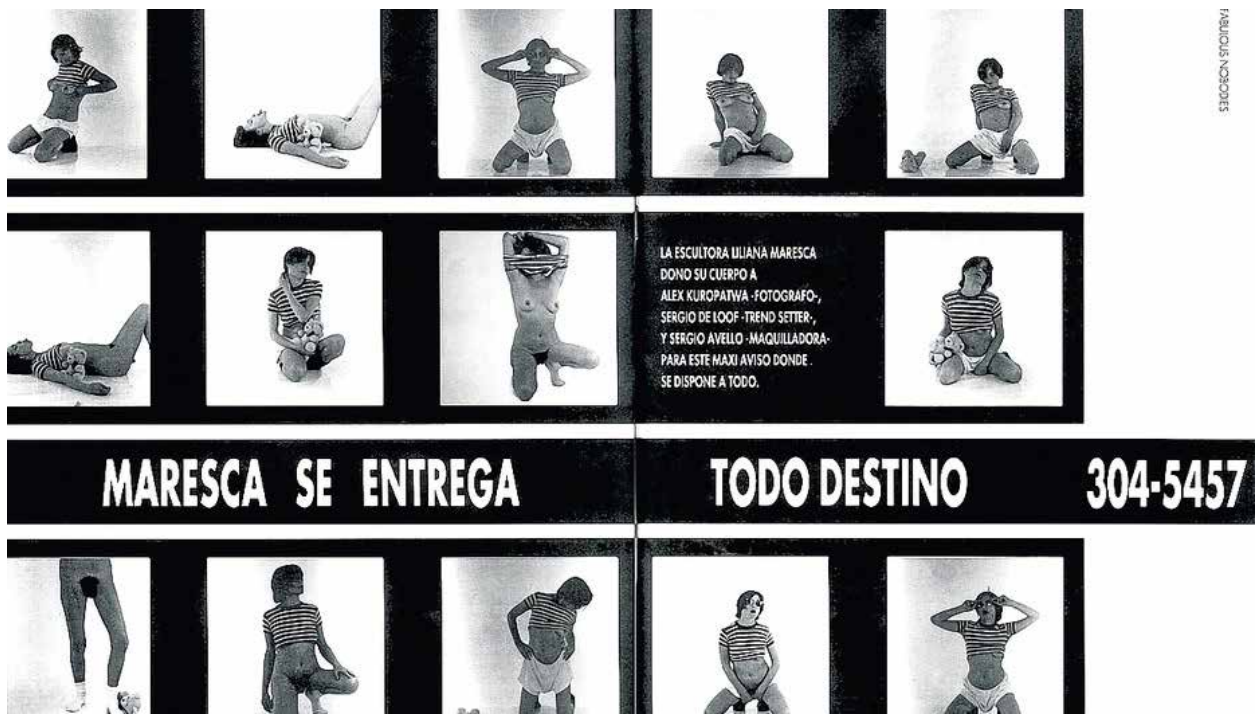
Figura 12 – Maresca se Entrega Todo Destino 304-5457, Foto-Performance. Foto: Alejandro Kuropatwa, 1993.