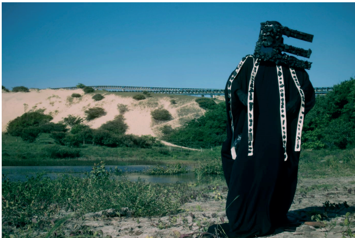
Figura 04 – Still de Vídeoperformance. Performance/Instalação Carvão Para Seus Olhos Tocarem.

na paisagem, essa mistura e co-performatividade com a matéria, foram do interesse central para o desenvolvimento do projeto, determinando um modo de engajamento e relação com a paisagem, assim como estratégias de promoção do contato com tal materialidade e a paisagem do Pecém para pessoas que viessem a lidar com o projeto, seja através de uma vídeo-máscara performada com imagens das paisagens, ações ao vivo envolvidas por múltiplas projeções ou fragmentos de carvão mineral coletados, derramados agressivamente no espaço expositivo, ou misturados com baião.