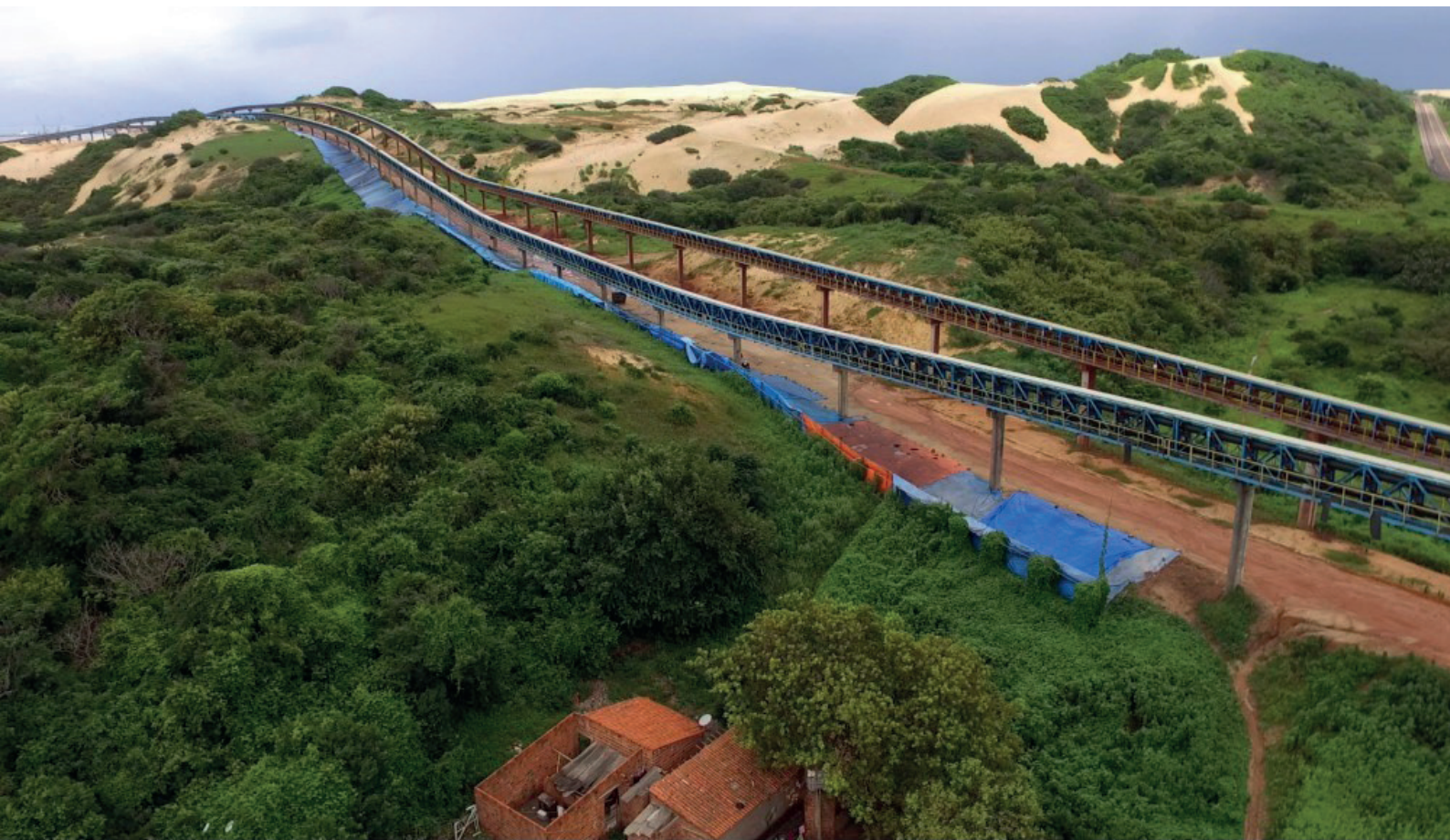
Figura 03 – Esteira Transportadora de Minério.

do carvão que chegava ao Ceará. A região é marcada por uma forte tradição indígena e uma histórica presença de guerrilheiros, assim como também atual palco de projeção e execução, de acordo com Becerra (2009), de uma série de megaprojetos de desenvolvimento industrial relacionados a interesses pelo desenvolvimento de infraestrutura viária, portuária, energética e de exploração de carvão.