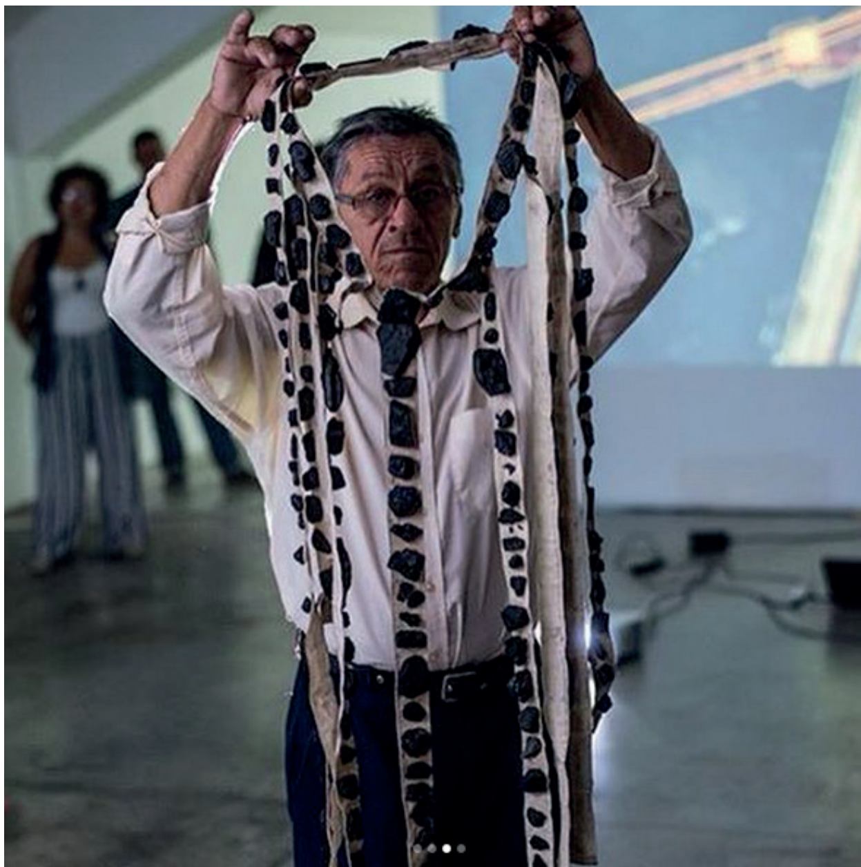
Figura 02 – Morador de comunidade afetada participando da performance com vestível. Performance/Instalação Carvão Para Seus Olhos Tocarem.