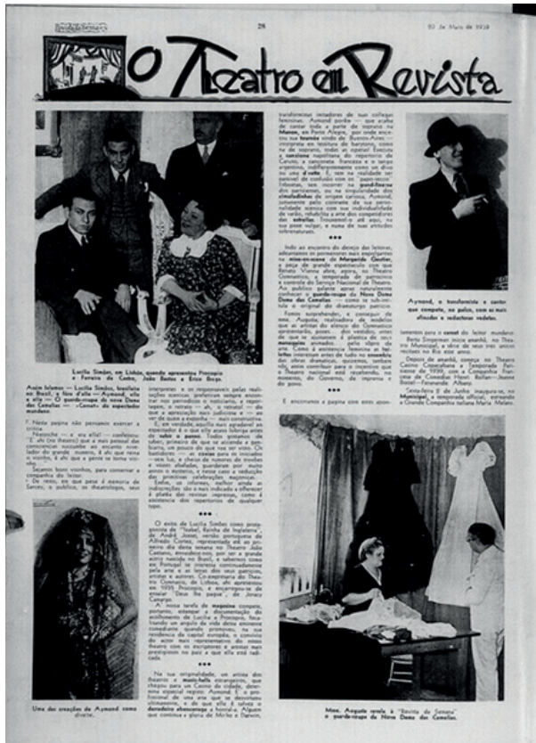
Figura 2 – O Teatro em Revista, Rio de Janeiro, 20 de maio. 1933.p.28.