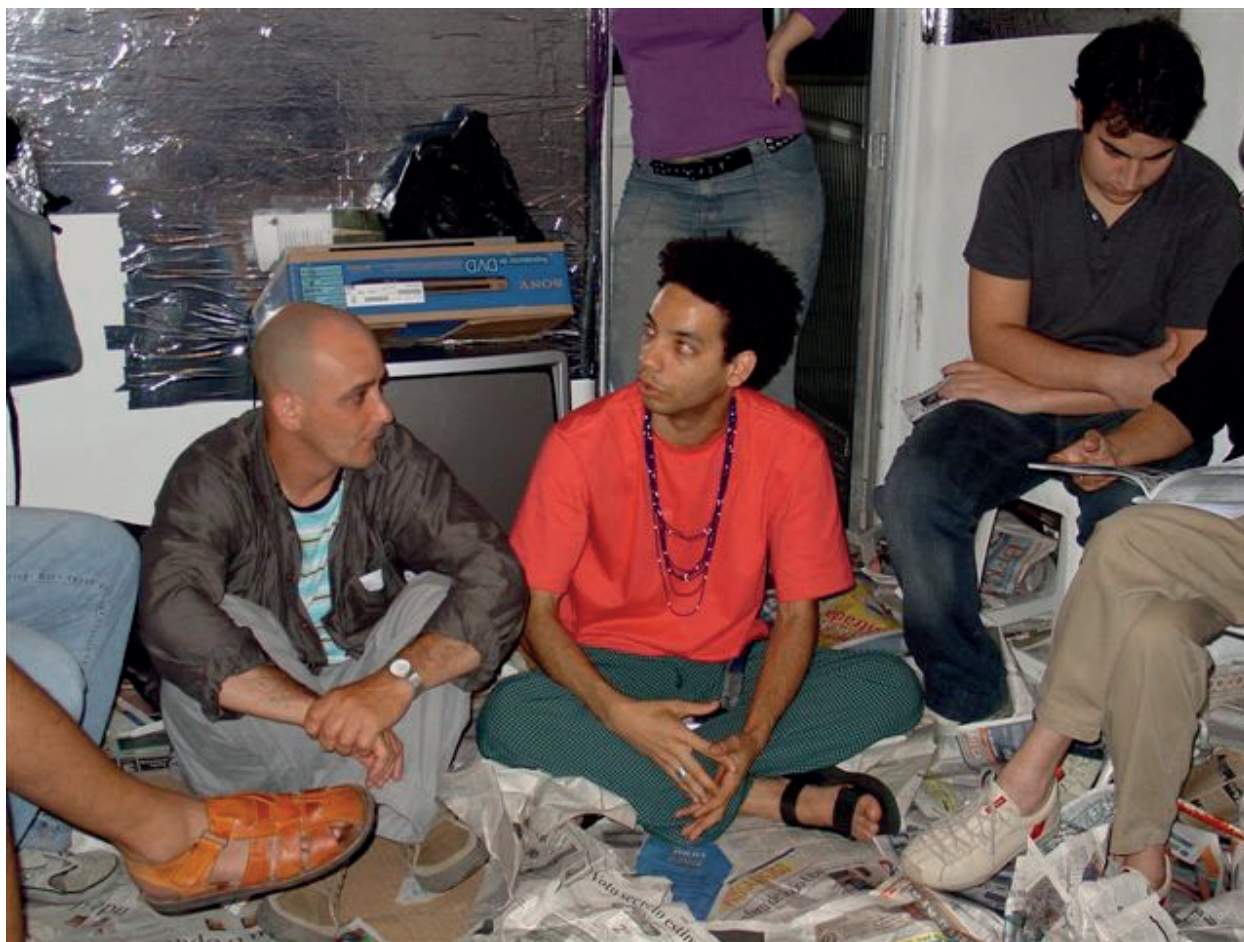
Figura 8 – Mapa de caminhos – Pensando Paris, Rés do Chão, Rio de Janeiro, 2004.