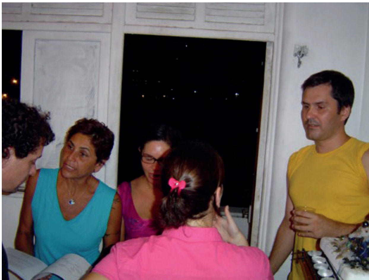
Figura 5 – Rés 2º aniversário, Rio de Janeiro, 2004

algo parecido. Havia uma recusa a isso explícita. Existia sim, a mania de dizer 'a gente', e a minha questão então é saber o que fez o Rés viver tantas situações? E que inteligência nós produzimos através dos combates e dos prazeres que aí articulamos? E discordo que o Rés teve um período de não-potência, constituía a ideia do Rés funcionar também na baixa frequência. Mais latente, permanecendo como uma pancada repercutindo em cabeçasssssssss. Produzimos a mania de dizer a gente, e adubamos um champ intermediário pela via da hidrossolidariedade. « Use e não estrague » era a nossa solidariedade líquida. Esse enunciado ajuda entender a ideia de usuário que sempre trabalhamos no Rés. A gente usava, pura e simplesmente, sem nos preocuparmos com o resultado nem com as classificações do que fazíamos. Essa preocupação quem nos trouxe ao Rés foi alguém sem nunca ter rés-viv-ido. Um deita enquanto outro ri, enquanto outro come, enquanto outro beija, enquanto outro