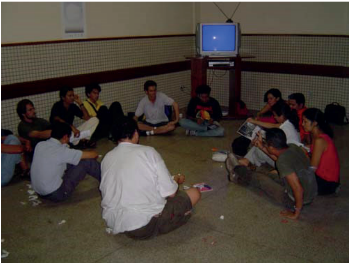
Figuras 6 e 7 – rés-Qui-Nós-Cio, Macapá , UNIFAP, 2004